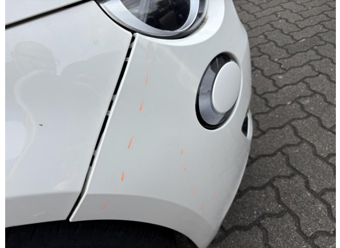
Stoßfänger vorne - stark deformiert - erneuern