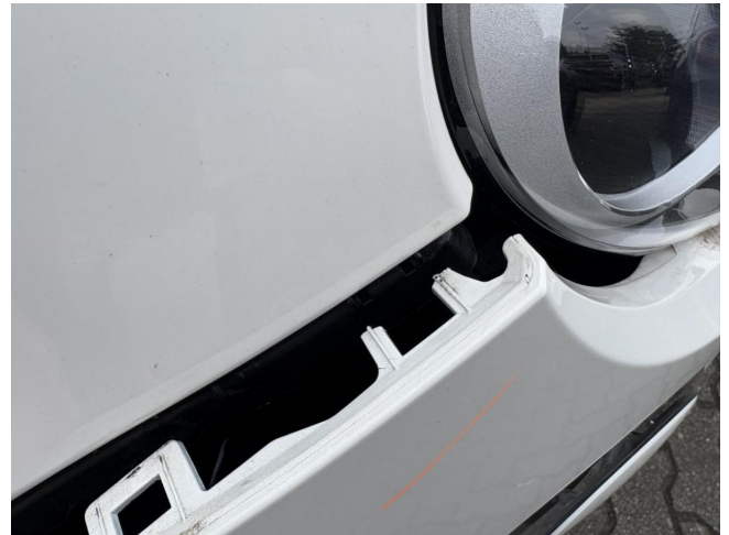
Stoßfänger vorne - stark deformiert - erneuern