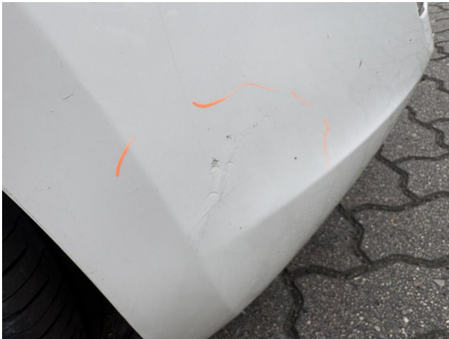
Stoßfänger vorne - stark deformiert - erneuern