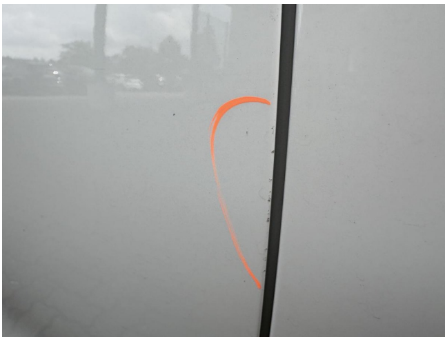
Türkante L - Lackabplatzer - Smart