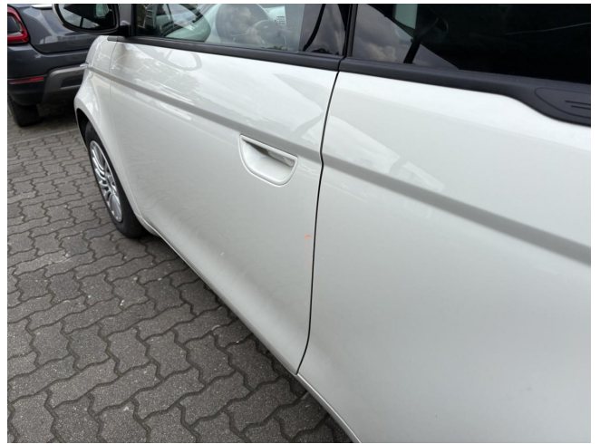
Türkante L - Lackabplatzer - Smart