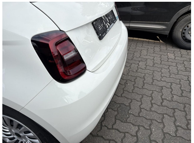
Stoßfänger H - Kratzer - Smart