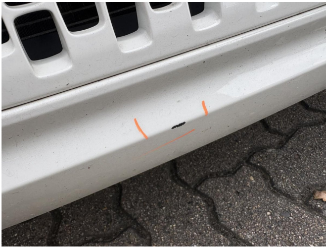
Stoßfänger vorne - stark deformiert - erneuern