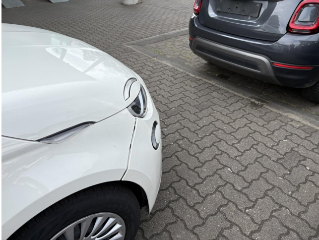
Stoßfänger vorne - stark deformiert - erneuern

Anzahl Halter lt. Zulbesch. II: keine Angabe