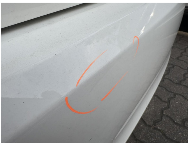
Stoßfänger H - Kratzer - Smart