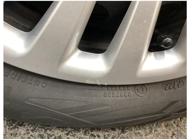
Felge (Sommer-Radsatz) - Vorderachse links - Radblende vo li verkratzt - erneuern