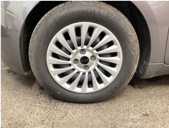
Felge (Sommer-Radsatz) - Vorderachse links - Radblende vo li verkratzt - erneuern