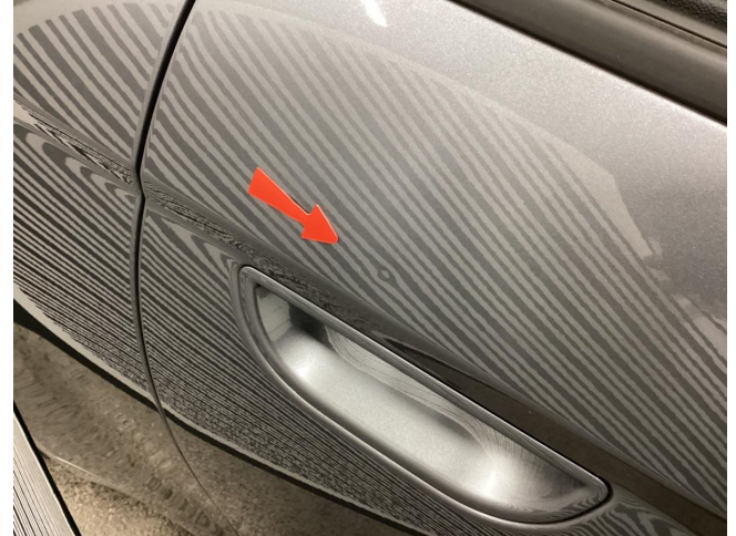
Tür vorne rechts - Delle - entfernen