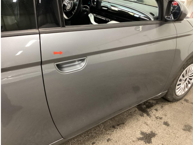
Tür vorne rechts - Delle - entfernen

Anzahl Halter lt. Zulbesch. II: keine Angabe