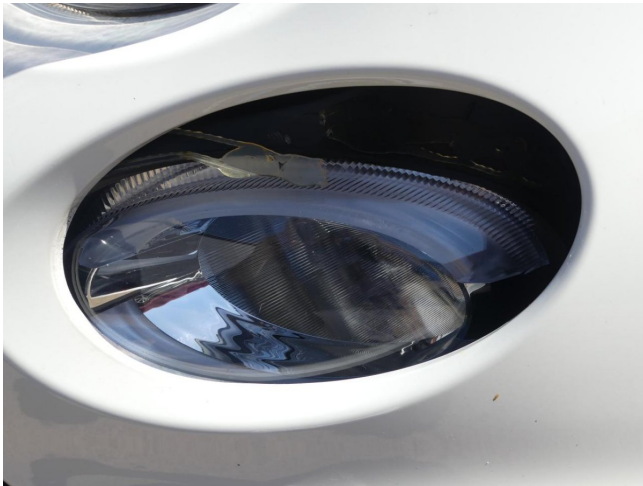
Zusatzscheinwerfer L - ersetzen