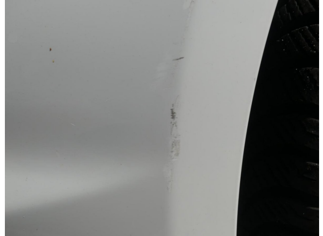
Stoßfänger V - Smart Repair