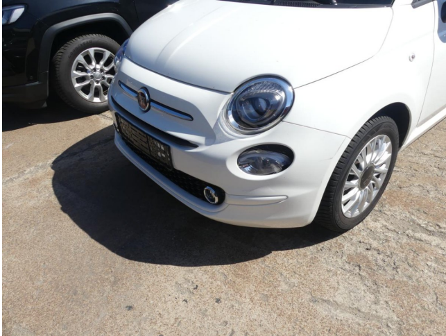
Stoßfänger V - Smart Repair

Anzahl Halter lt. Zulbesch. II: keine Angabe