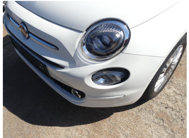
Zusatzscheinwerfer L - ersetzen