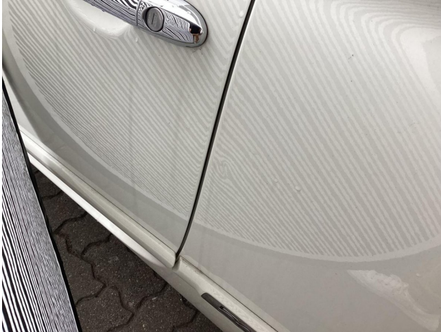
Fondseite links - Delle - entfernen

Anzahl Halter lt. Zulbesch. II: keine Angabe