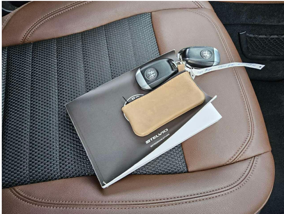
Bild 5 : Schlüssel, Servicenachweis / Serviceheft (letzter Eintrag)