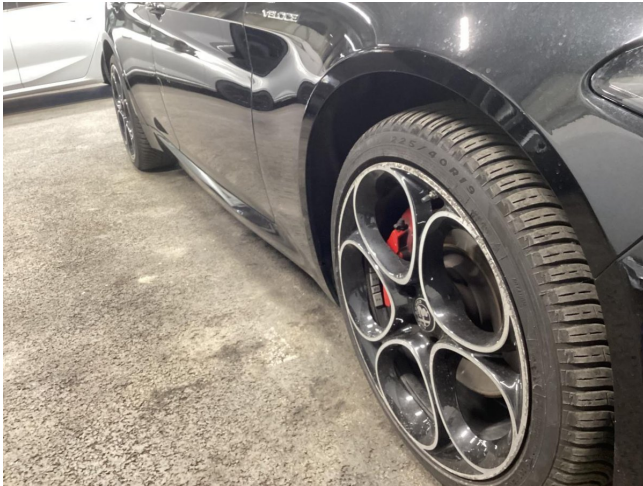
Reifen & Felge VR beschädigt - ersetzen

Anzahl Halter lt. Zulbesch. II: keine Angabe