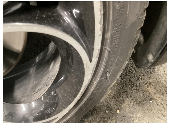
Reifen & Felge HR beschädigt - ersetzen