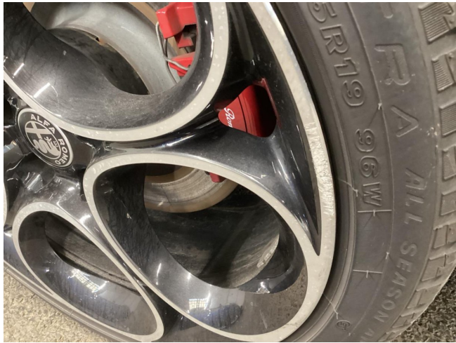
Reifen & Felge HL Ersetzen