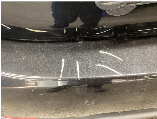
Stoßfänger H - Kratzer - Smart