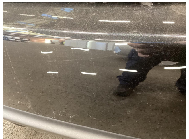
Stoßfänger H - Kratzer - Smart