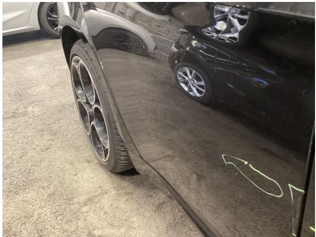
Tür HR - Kratzer - Lackieren