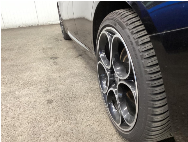
Reifen & Felge HL Ersetzen