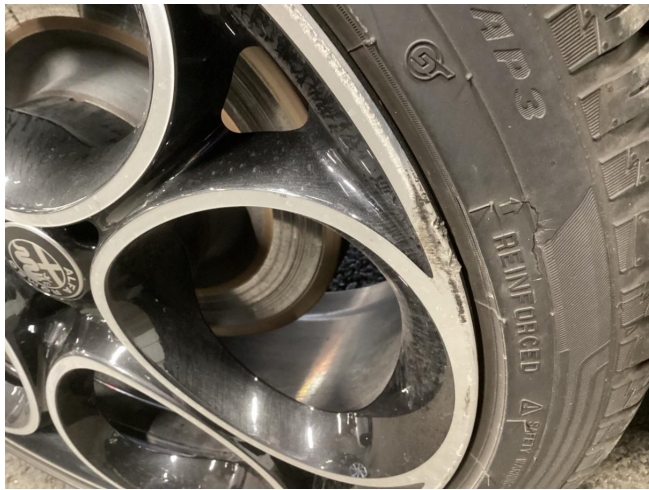
Reifen & Felge HR beschädigt - ersetzen