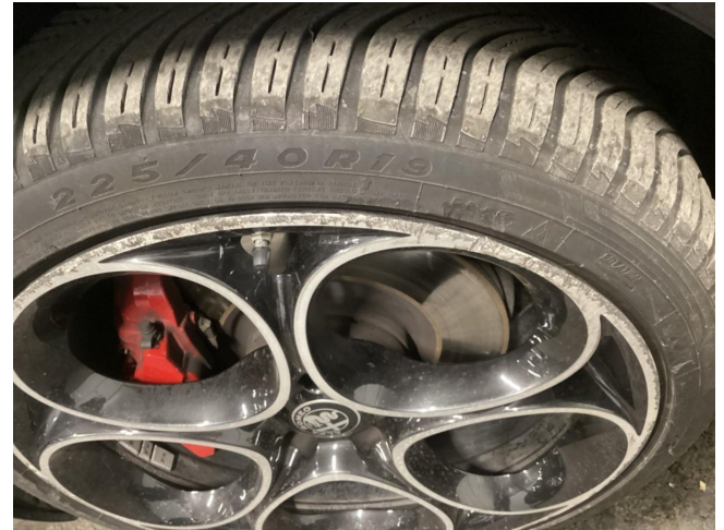
Reifen & Felge VR beschädigt - ersetzen