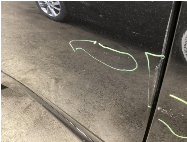
Tür HR - Kratzer - Lackieren