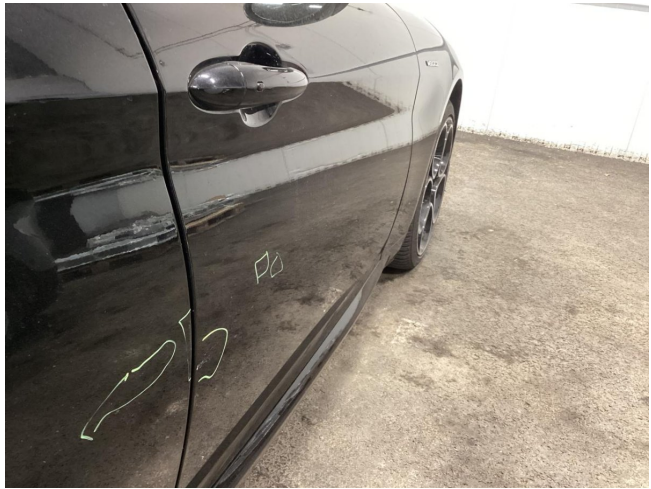
Tür VR - Kratzer - Lackieren