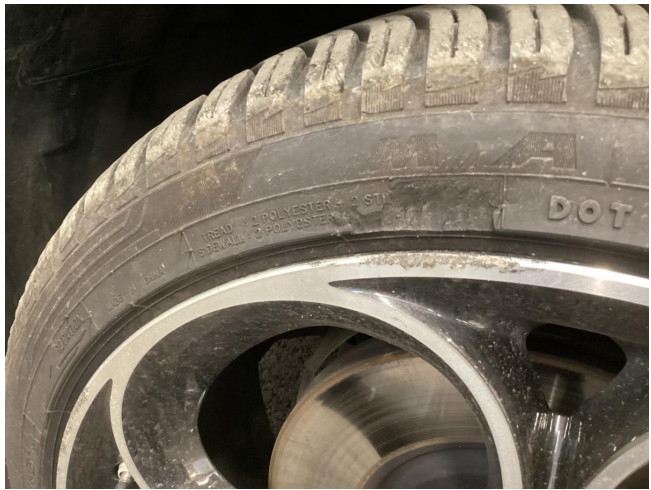
Reifen & Felge VR beschädigt - ersetzen