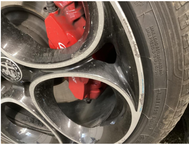
Reifen & Felge VL ersetzen