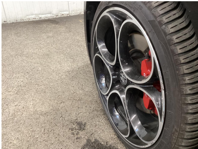
Reifen & Felge VL ersetzen