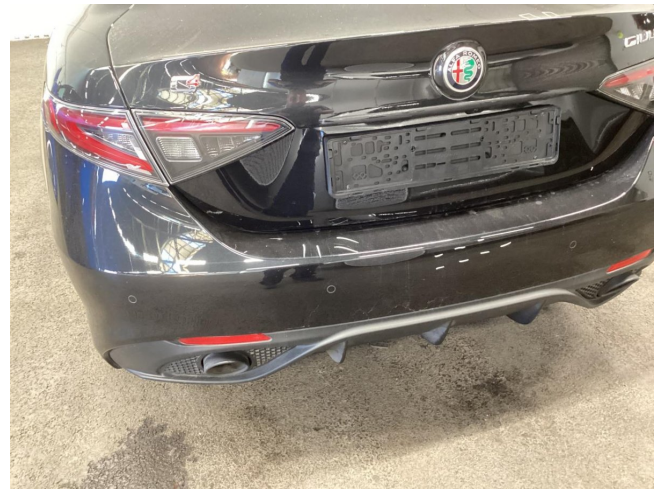
Stoßfänger H - Kratzer - Smart