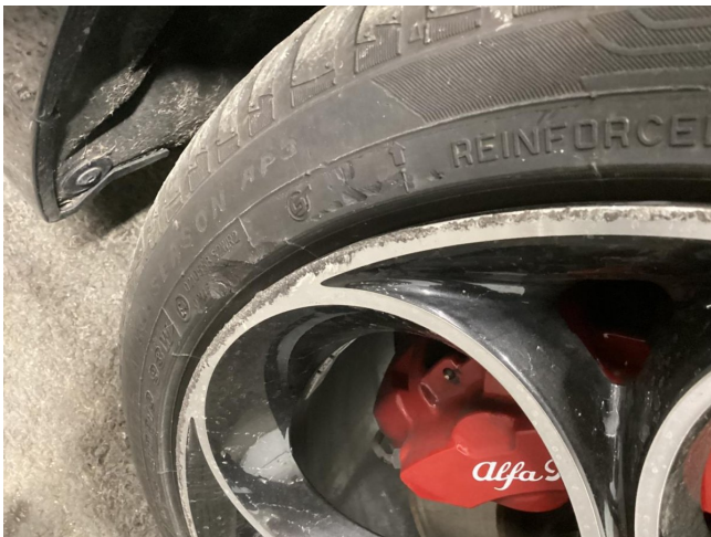
Reifen & Felge VL ersetzen