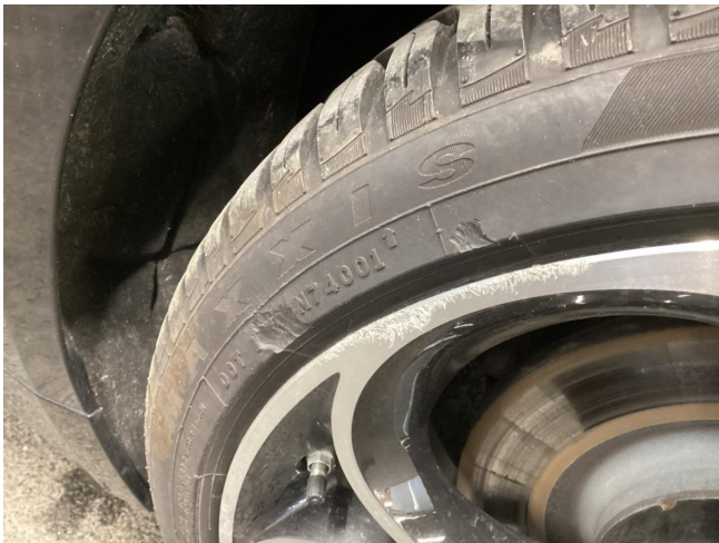
Reifen & Felge VR beschädigt - ersetzen