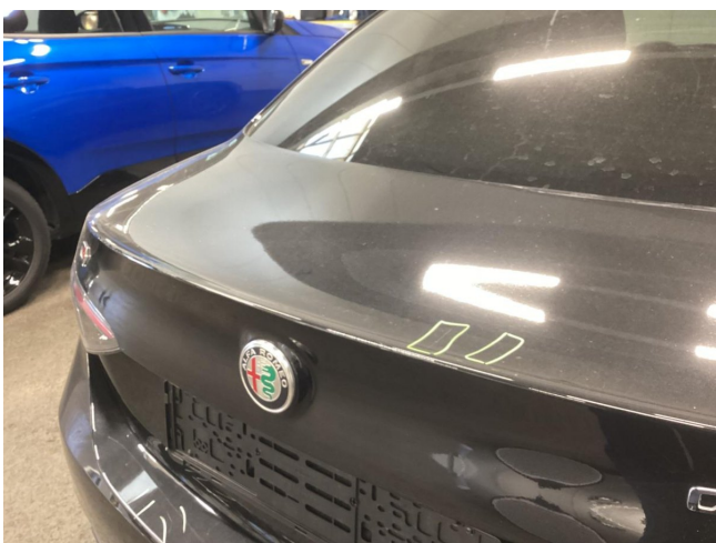
Kofferraumdeckel - Kratzer - Lackieren