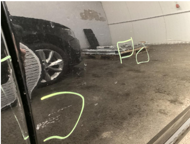
Tür VR - Kratzer - Lackieren