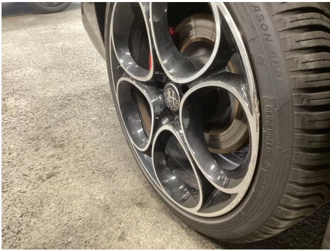
Reifen & Felge HR beschädigt - ersetzen