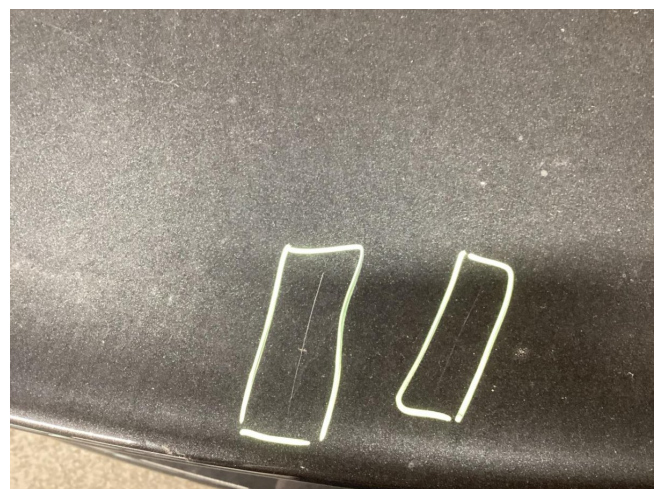
Kofferraumdeckel - Kratzer - Lackieren