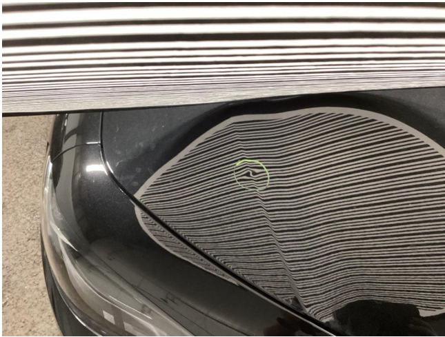
Motorhaube - Delle