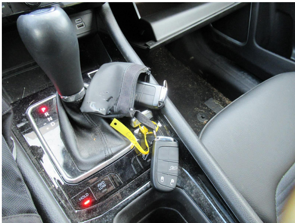
Bild 5 : Schlüssel, Servicenachweis / Serviceheft (letzter Eintrag)