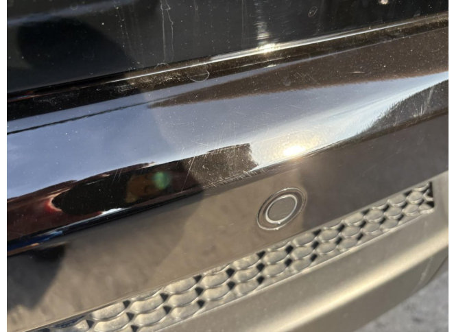
Stoßfänger H - Kratzer - Polierein