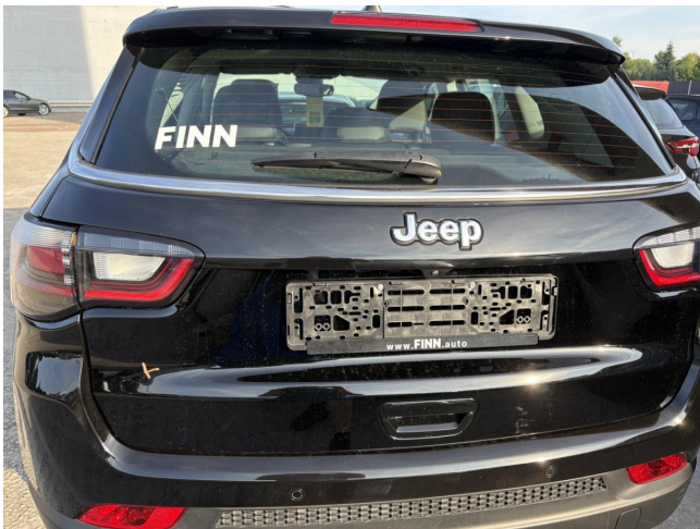
Heckklapengriff - Kratzer - Polieren