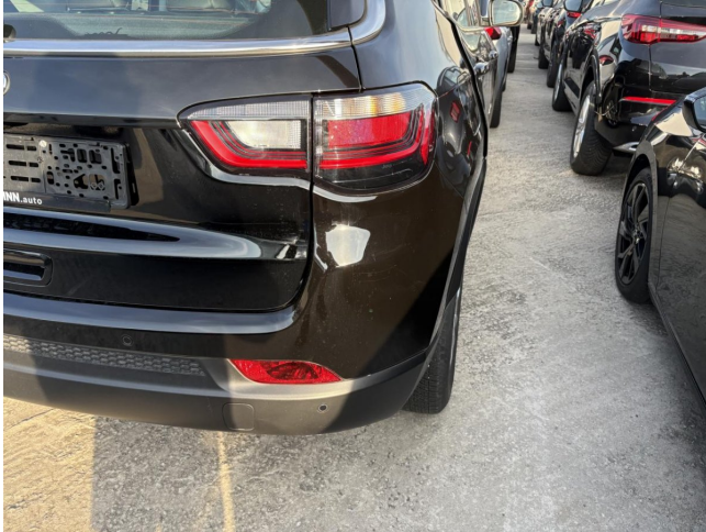
Stoßfänger H - Kratzer - Polierein

Anzahl Halter lt. Zulbesch. II: keine Angabe