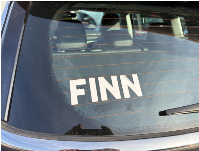
Heckscheibe Aufkleber entfernen