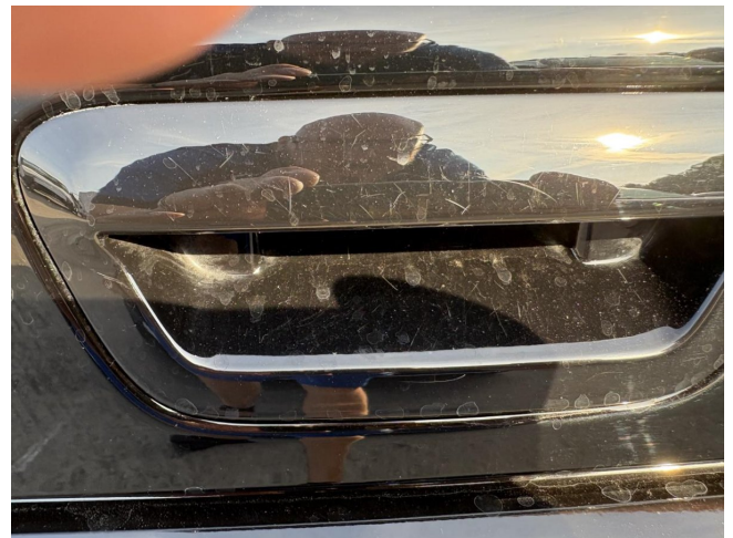
Heckklapengriff - Kratzer - Polieren