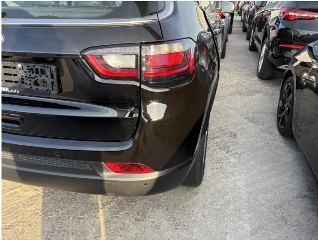
Stoßfänger H - Kratzer - Polierein

Anzahl Halter lt. Zulbesch. II: keine Angabe