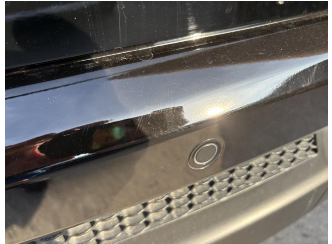
Stoßfänger H - Kratzer - Polierein