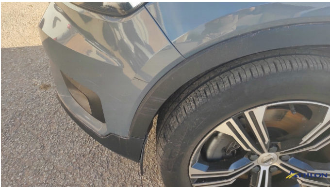
3. paraurti anteriore Graffio/Rigature