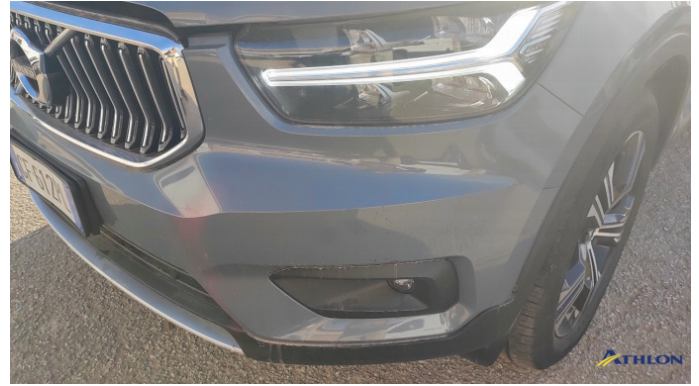
2. paraurti anteriore Graffio/Rigature