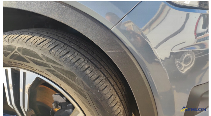
1. paraurti anteriore Graffio/Rigature