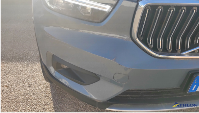
2. paraurti anteriore Graffio/Rigature