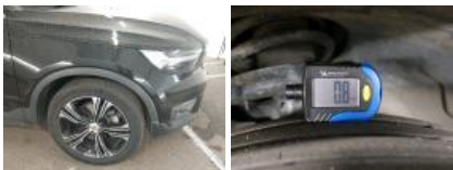
Jante alum. AVD bi-ton/polychrome, Griffe(s), Acceptable