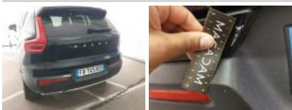
Coffre / hayon, Griffe(s), Acceptable