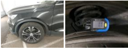
Jante alum. AVG bi-ton/polychrome, Griffe(s), Acceptable