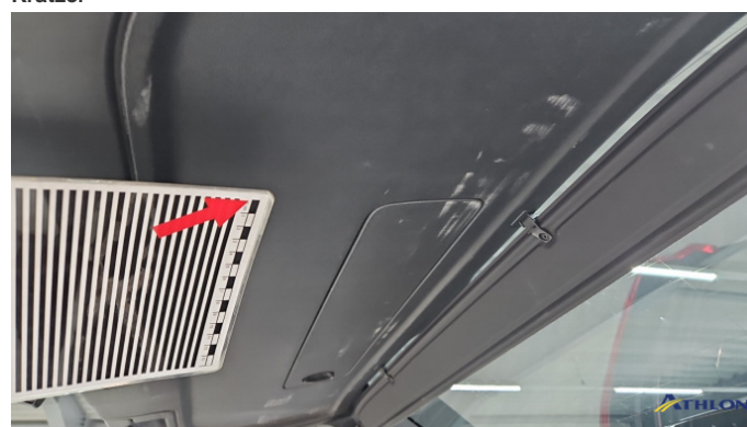
5. Heckklappenverkleidung Gebrauchsspuren