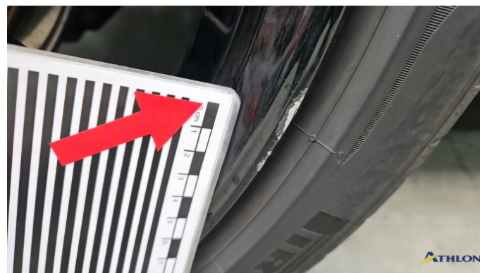
3. Felge Hinten - Rechts Kratzer