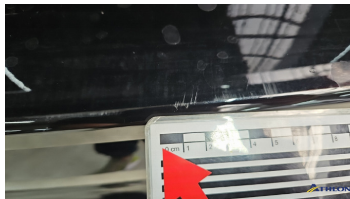
1. Stoßfänger Hinten Kratzer