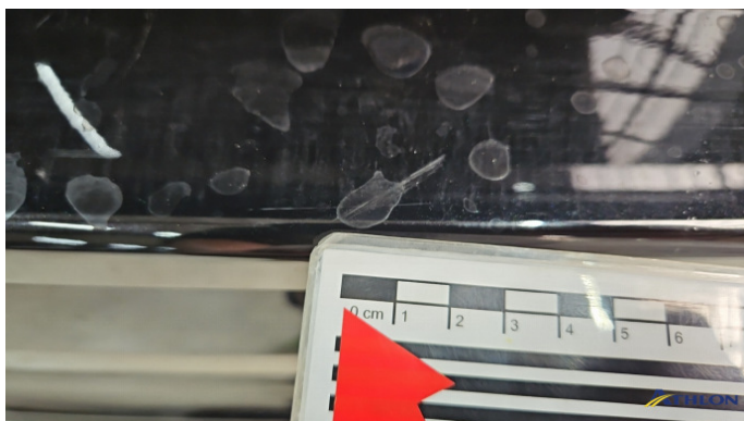
1. Stoßfänger Hinten Kratzer