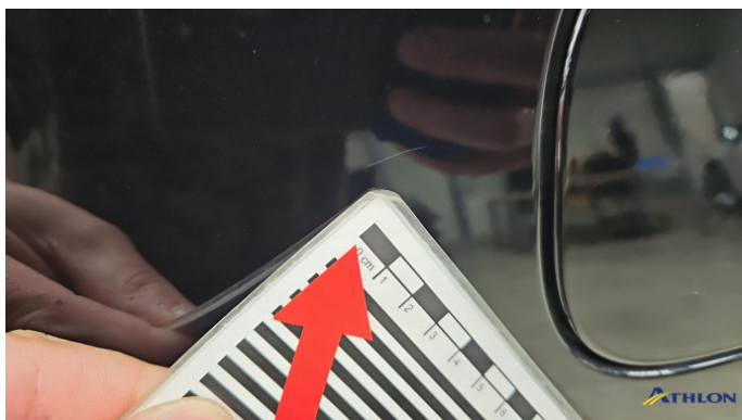
2. Seitenwand - Hinten - Rechts Kratzer