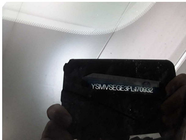
Abbildung 1: FIN