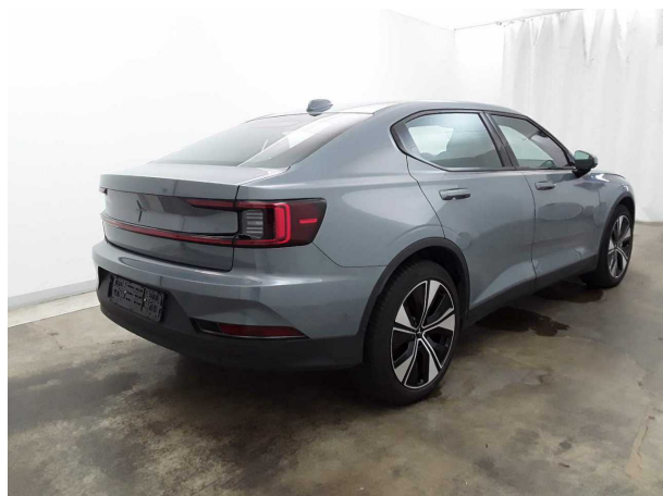
Abbildung 5: Schräg hinten