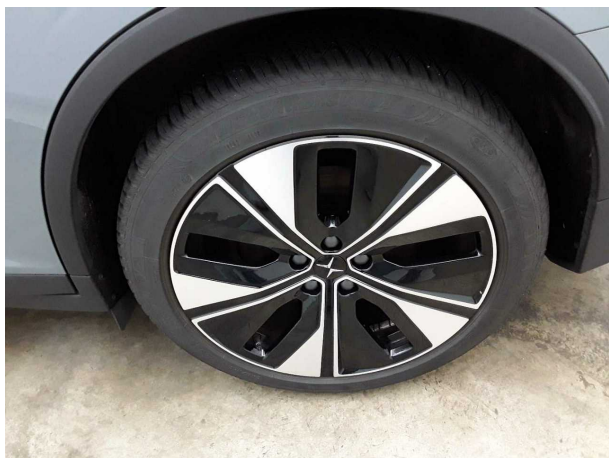
Abbildung 7: Montierte Bereifung