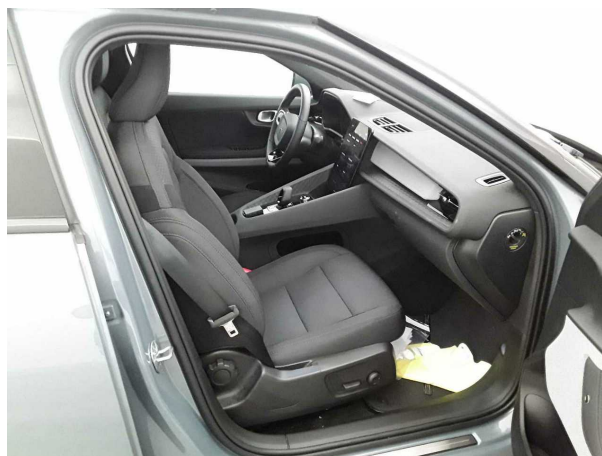
Abbildung 10: Innenraum vorne