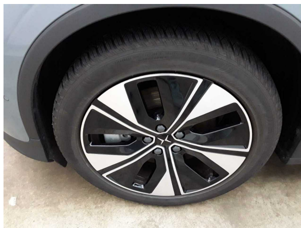
Abbildung 6: Montierte Bereifung