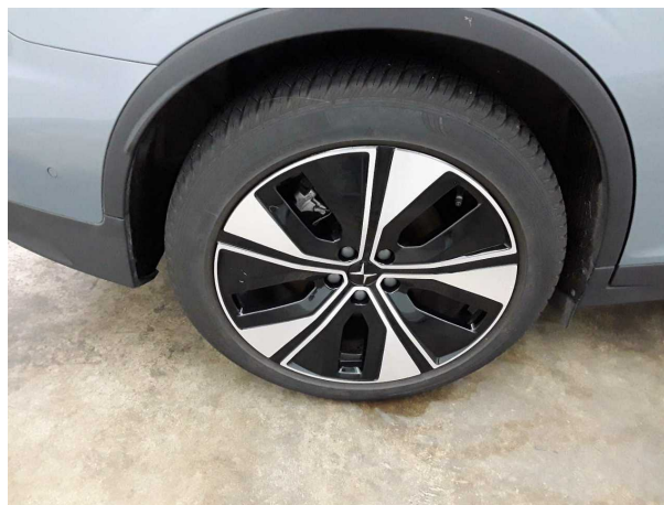
Abbildung 8: Montierte Bereifung