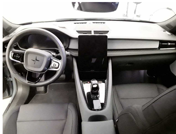
Abbildung 14: Instrumententafel