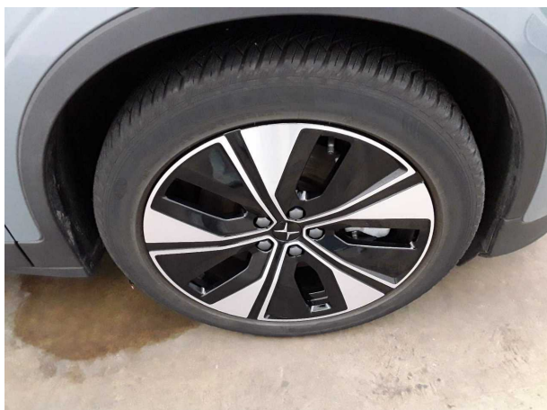
Abbildung 9: Montierte Bereifung