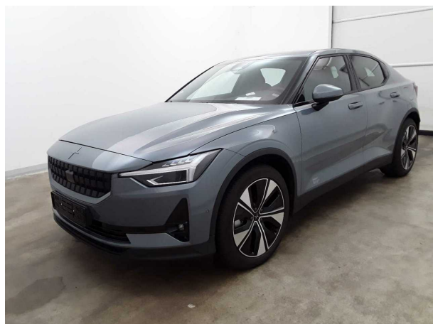
Abbildung 3: Schräg vorne