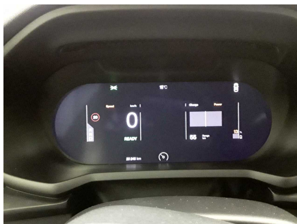
Abbildung 12: Kombiinstrument