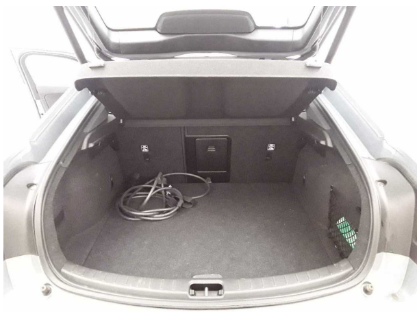
Abbildung 11: Laderaum