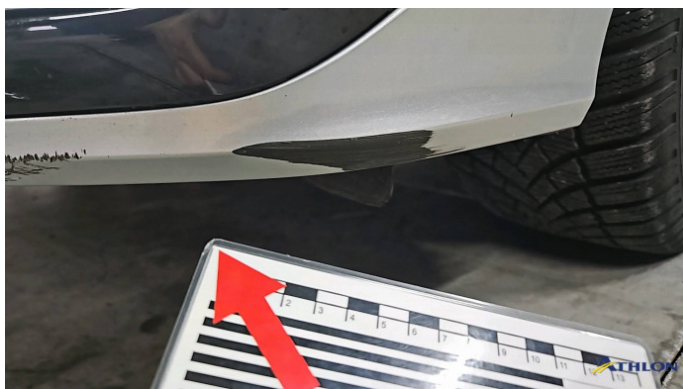
2. Stoßfänger Vorne Kratzer Ab 60mm