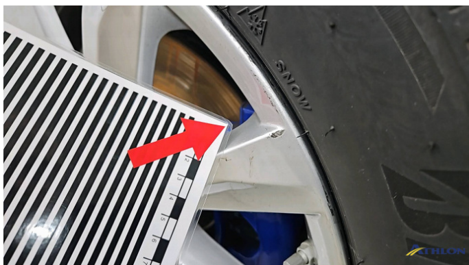
9. Felge Vorne - Rechts Kratzer