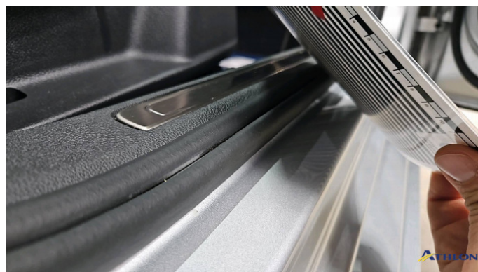
8. Türeinstieg Vorne - Rechts Verformt (leicht)