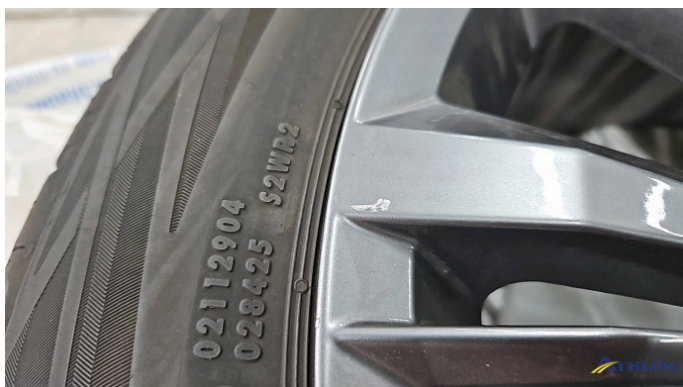
12. Sommerfelge 2 Kratzer