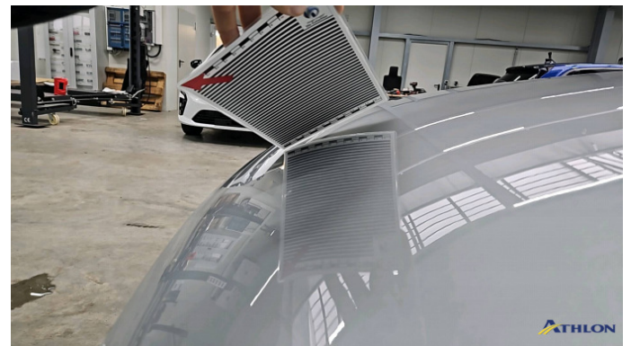
1. Motorhaube Verformt (leicht)