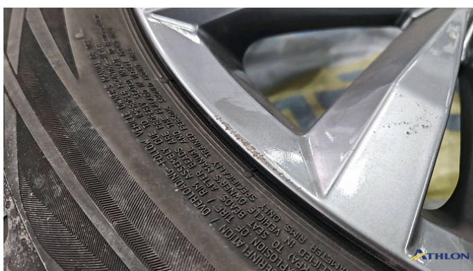
11. Sommerfelge 1 Kratzer