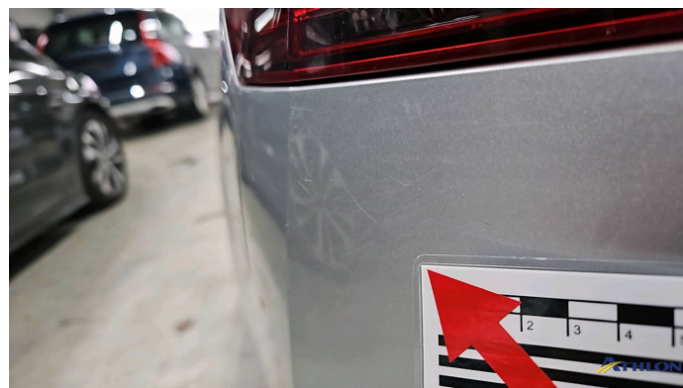
5. Stoßfänger Hinten Kratzer Ab 60mm