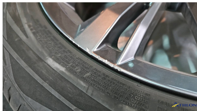
13. Sommerfelge 3 Kratzer