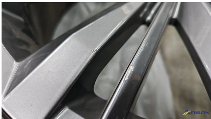
12. Sommerfelge 2 Kratzer