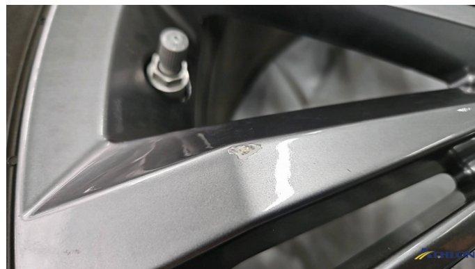
12. Sommerfelge 2 Kratzer