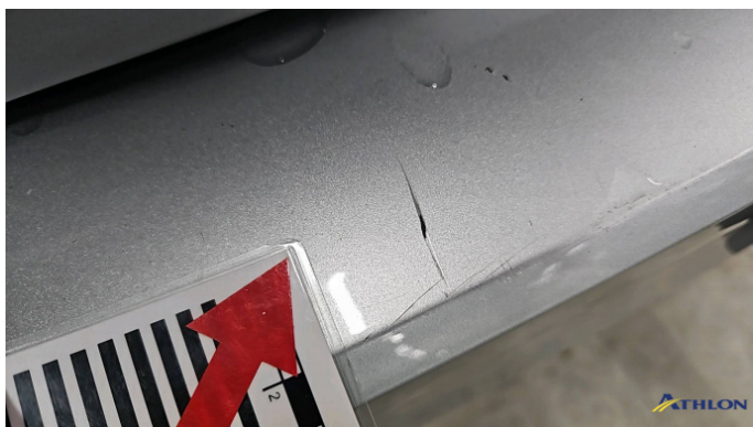
5. Stoßfänger Hinten Kratzer Ab 60mm