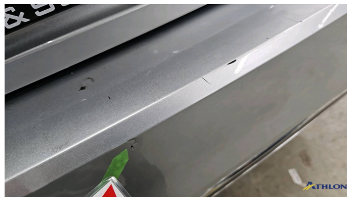
5. Stoßfänger Hinten Kratzer Ab 60mm