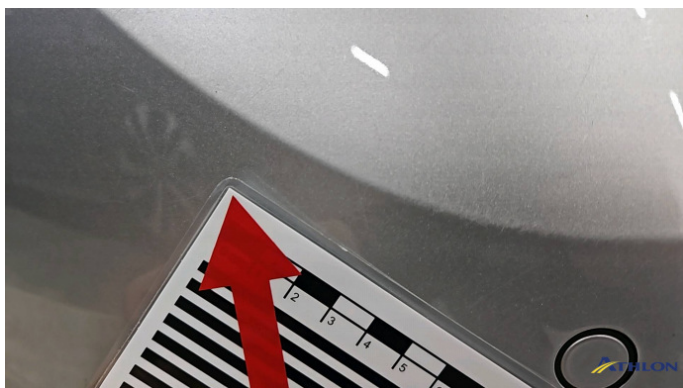
5. Stoßfänger Hinten Kratzer Ab 60mm