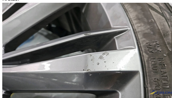
11. Sommerfelge 1 Kratzer