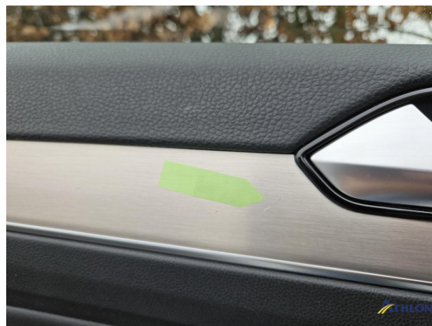
10. Türverkleidung Vorne - Links Kratzer