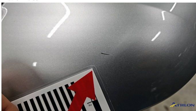
3. Außenspiegel Gehäuse - Links Kratzer