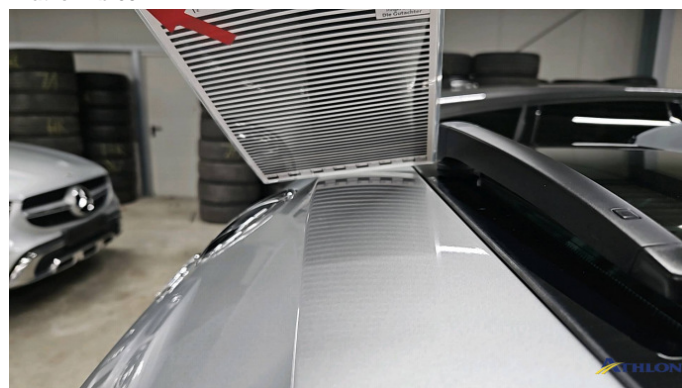
6. Heckklappe 1 Delle