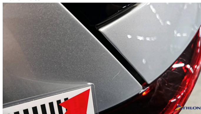
4. Seitenwand - Hinten - Links Kratzer