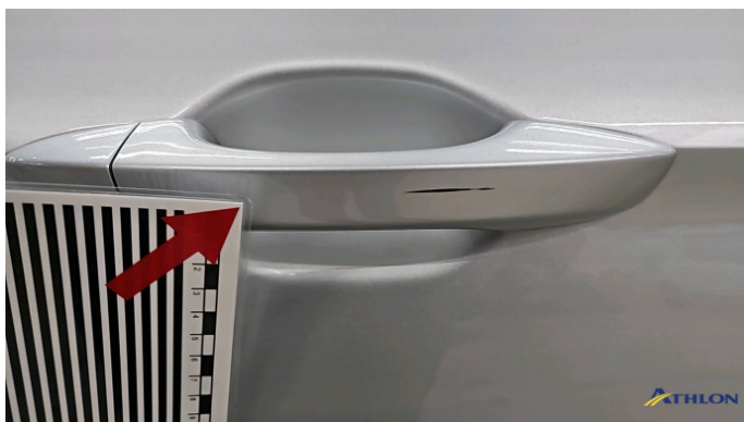
7. Außentürgriff Hinten - Rechts Kratzer