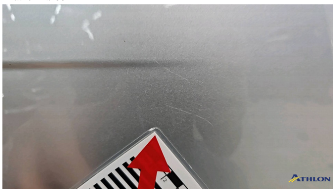
5. Stoßfänger Hinten Kratzer Ab 60mm