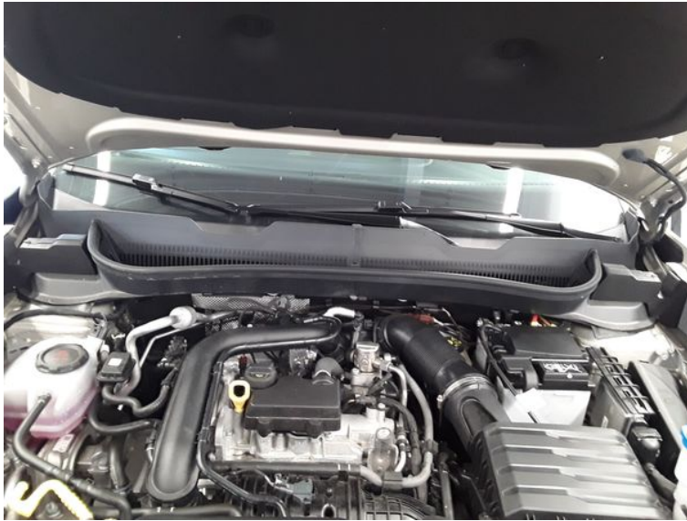
Motorraum / Frunk

Ingenieurbüro für Kfz-Technik GmbH Schmidt - Elsner - Espe