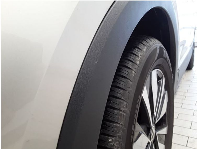
Radlaufblende vorne links - Gebrauchsspur

Ingenieurbüro für Kfz-Technik GmbH Schmidt - Elsner - Espe