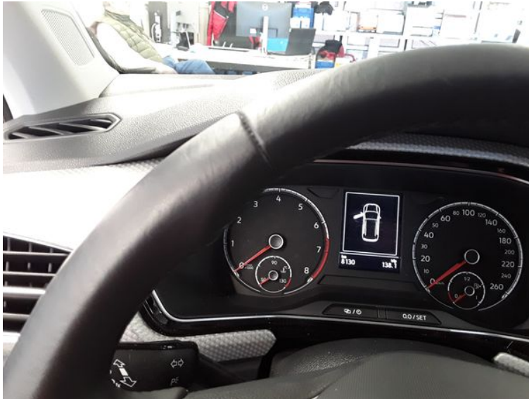
Lenkrad - Gebrauchsspur

Ingenieurbüro für Kfz-Technik GmbH Schmidt - Elsner - Espe