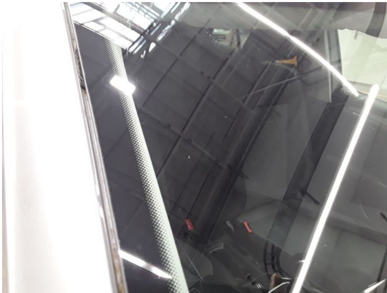
Frontscheibe - Gebrauchsspur

Ingenieurbüro für Kfz-Technik GmbH Schmidt - Elsner - Espe