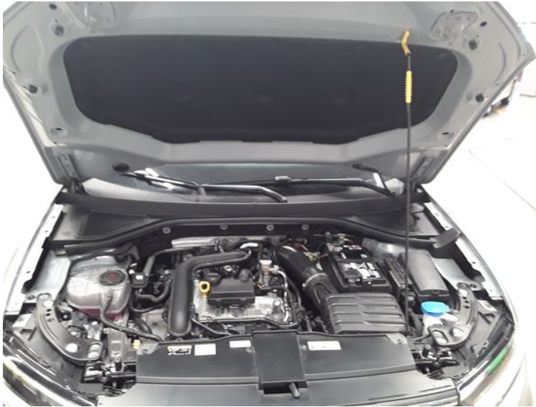
Motorraum / Frunk

Ingenieurbüro für Kfz-Technik GmbH Schmidt - Elsner - Espe