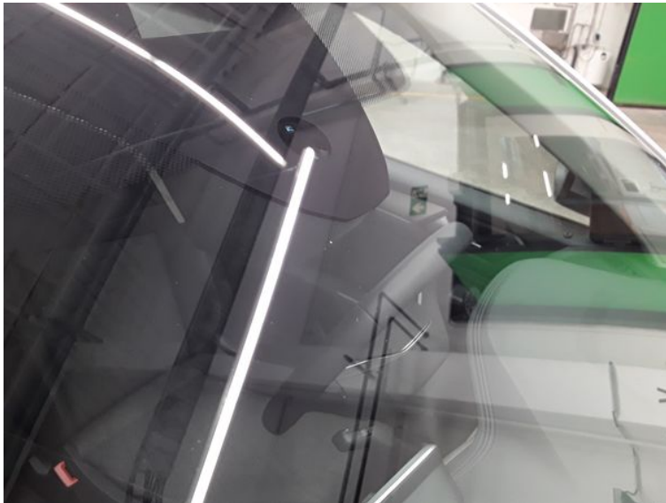
Frontscheibe - Gebrauchsspur