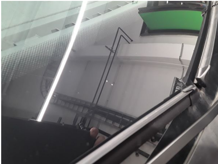
Frontscheibe - Gebrauchsspur