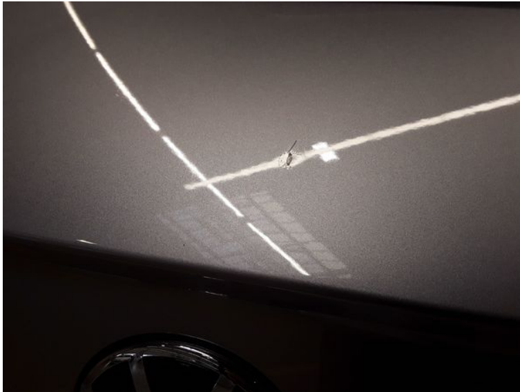
Heckklappe - Dellen + Kratzer

Ingenieurbüro für Kfz-Technik GmbH Schmidt - Elsner - Espe