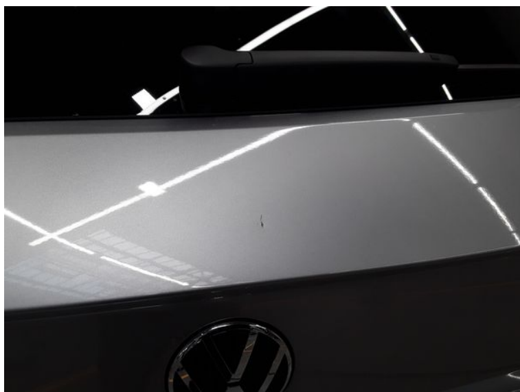
Heckklappe - Übersicht - Dellen + Kratzer