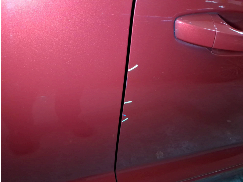
Tür außen: Tür vorne rechts - Kratzer - Smart Repair