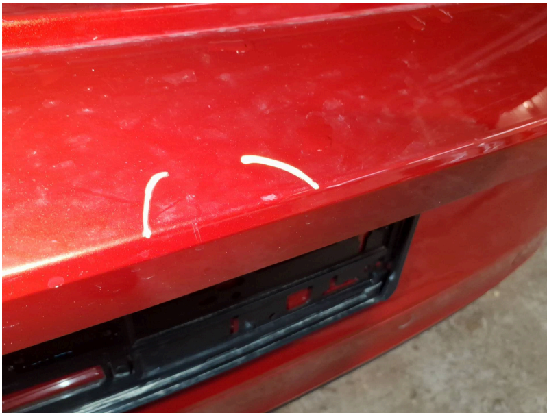
Stoßfänger: Stoßfänger hinten - Kratzer - Smart Repair