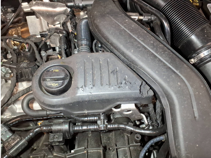
Motorraum: Motorraum Marderschaden - Marderverbiss - erneuern