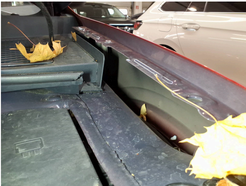
Motorraum: Motorraum Marderschaden - Marderverbiss - erneuern