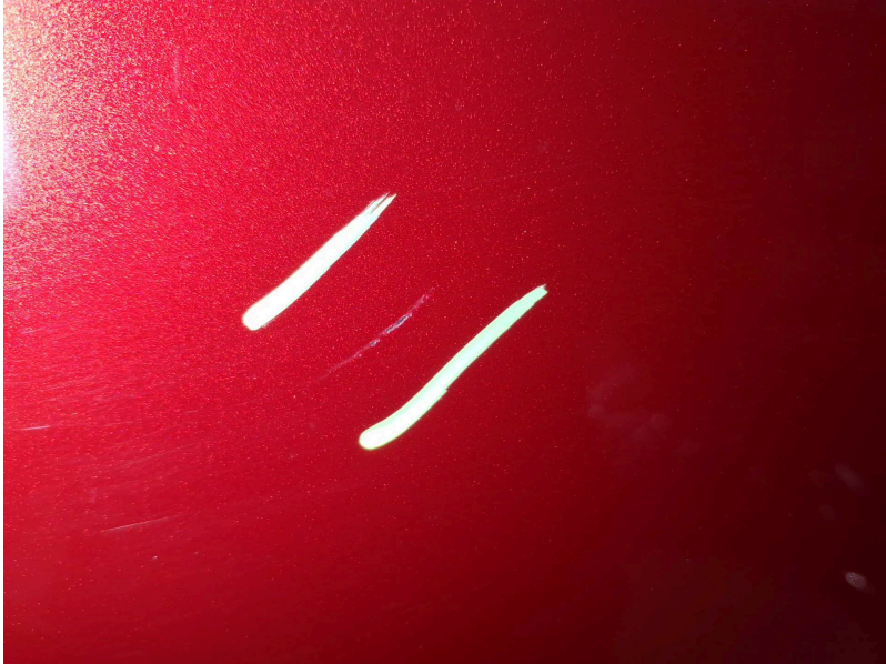
Seitenwand: Seitenwand hinten links - Kratzer - Smart Repair