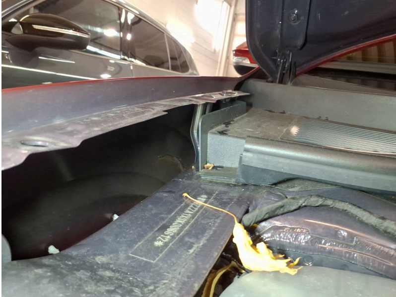
Motorraum: Motorraum Marderschaden - Marderverbiss - erneuern