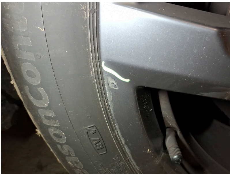
Räder vorn: Felge vorne rechts - Kratzer - lackieren