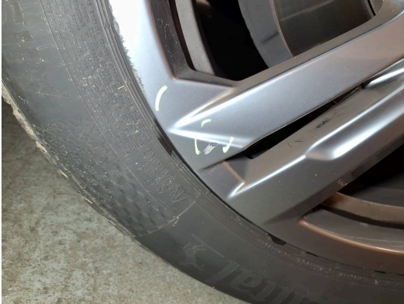
Räder vorn: Felge vorne rechts - Kratzer - lackieren