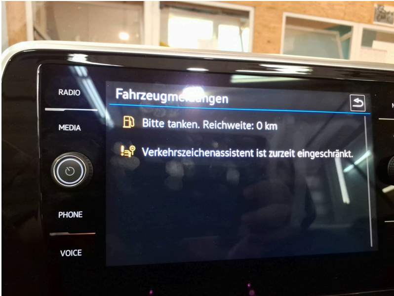
Beleuchtung / Kontrollanzeigen: Kontrollleuchte Kraftstoffreserve - fällig - einstellen