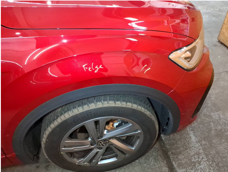
Kotflügel vorn rechts: Kotflügel vorne rechts - Kratzer - polieren