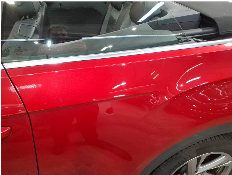
Seitenwand: Seitenwand hinten links - Kratzer - Smart Repair