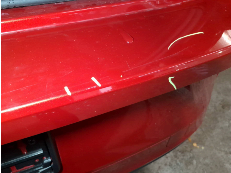
Stoßfänger: Stoßfänger hinten - Kratzer - Smart Repair