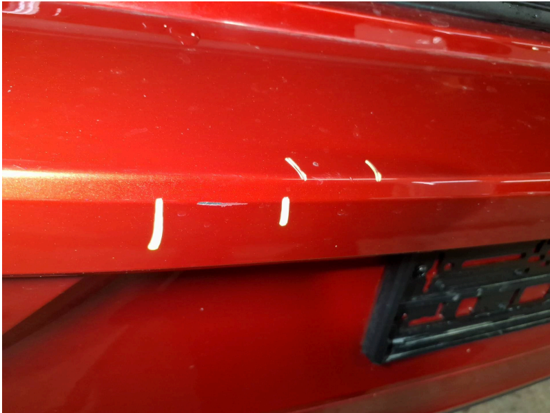
Stoßfänger: Stoßfänger hinten - Kratzer - Smart Repair