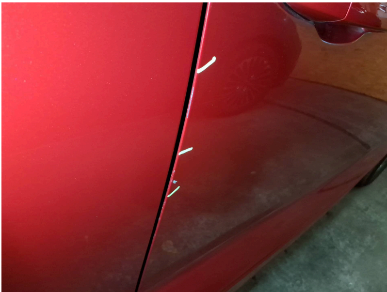
Tür außen: Tür vorne rechts - Kratzer - Smart Repair