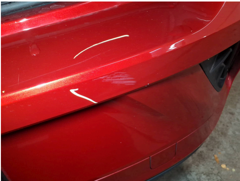
Stoßfänger: Stoßfänger hinten - Kratzer - Smart Repair