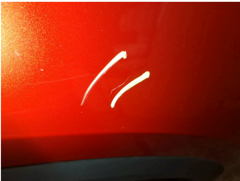
Kotflügel vorn rechts: Kotflügel vorne rechts - Kratzer - polieren