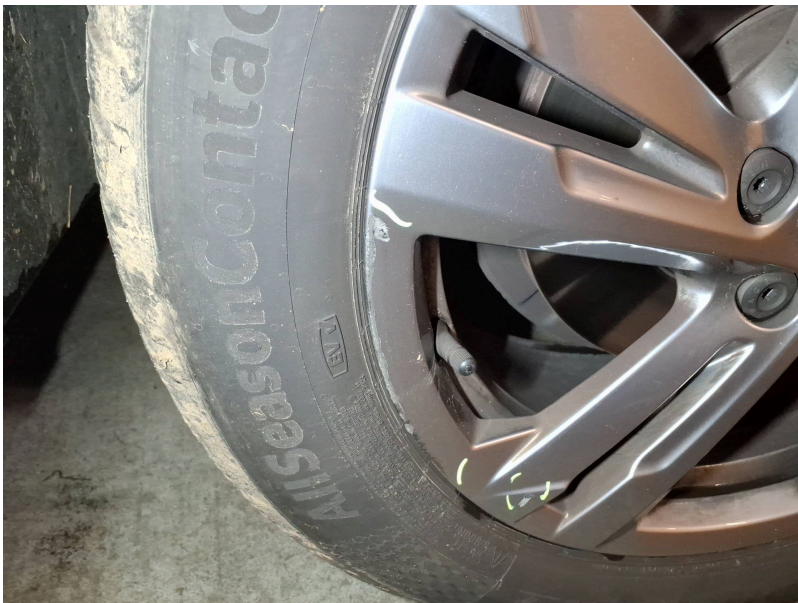
Räder vorn: Felge vorne rechts - Kratzer - lackieren