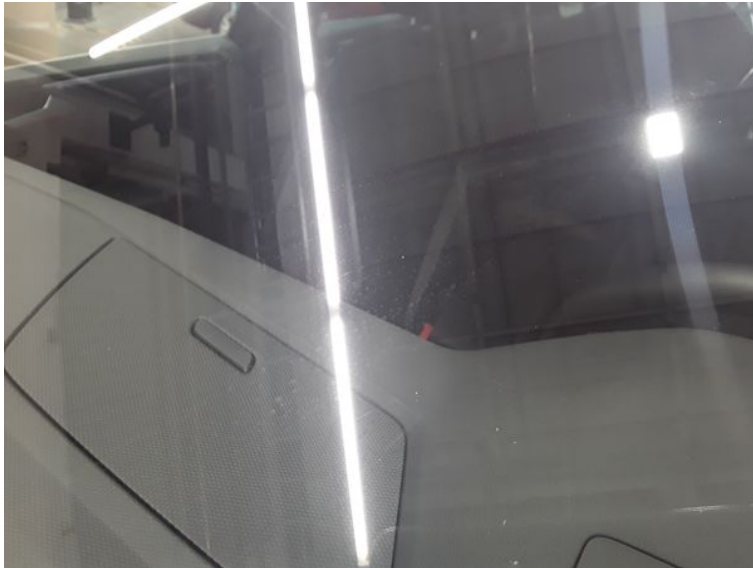
Frontscheibe - Gebrauchsspur

Ingenieurbüro für Kfz-Technik GmbH Schmidt - Elsner - Espe