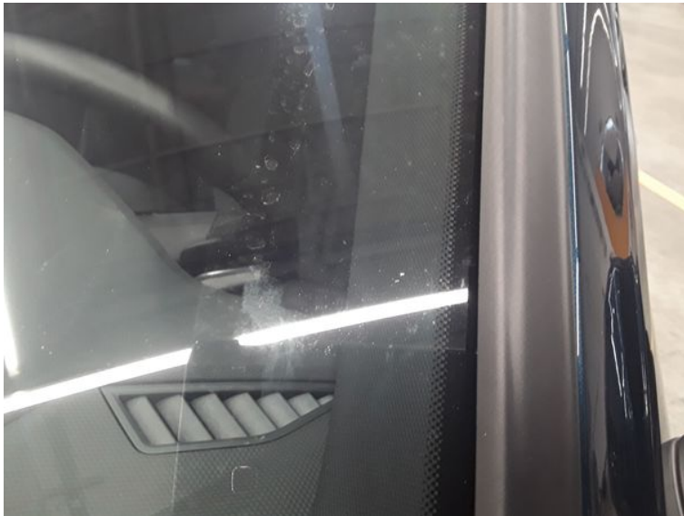
Frontscheibe - Gebrauchsspur