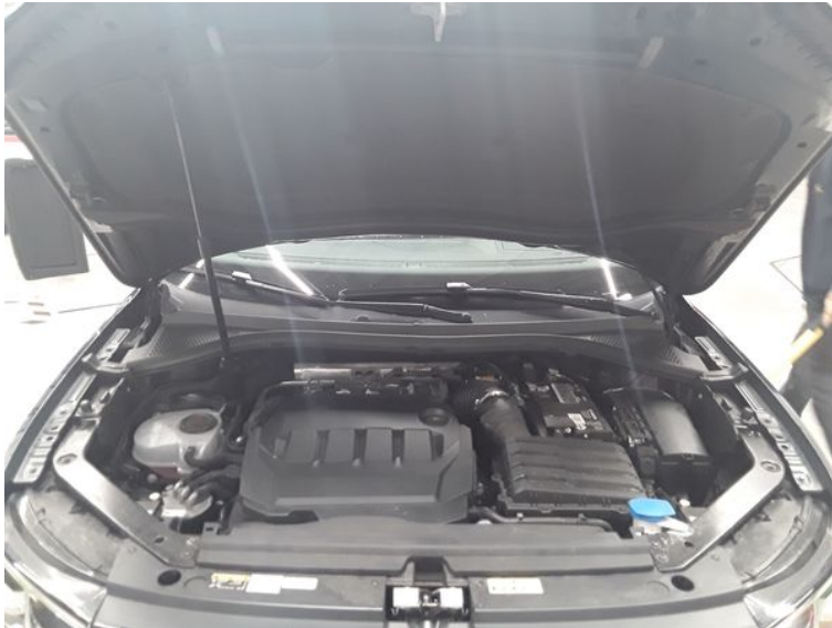
Motorraum / Frunk

Ingenieurbüro für Kfz-Technik GmbH Schmidt - Elsner - Espe