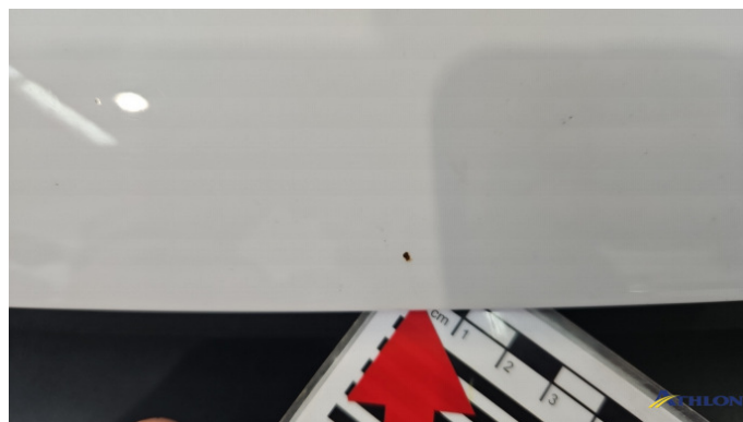
1. Motorhaube Rost