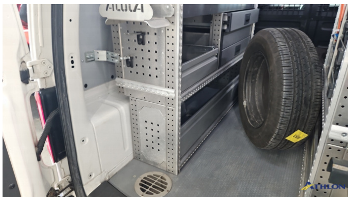
8. Laderaum Einbau Aluca In Ordnung