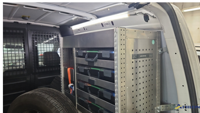
8. Laderaum Einbau Aluca In Ordnung