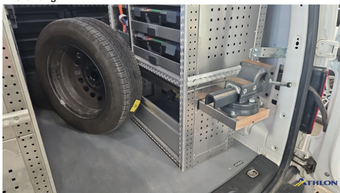
8. Laderaum Einbau Aluca In Ordnung