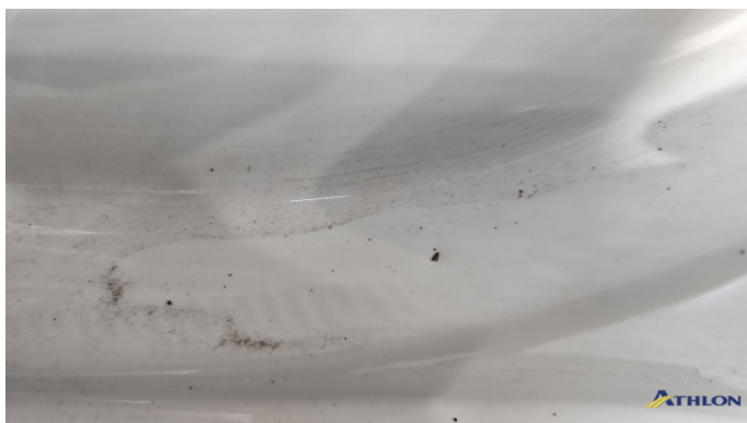
2. Türeinstieg Vorne - Links Verformt (leicht)