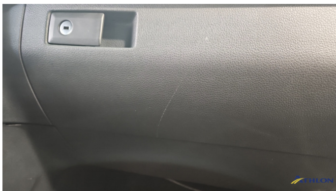
6. Handschuhfach Gebrauchsspuren