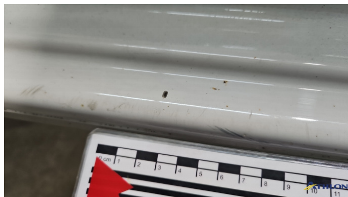
3. Türeinstieg Vorne - Links Kratzer