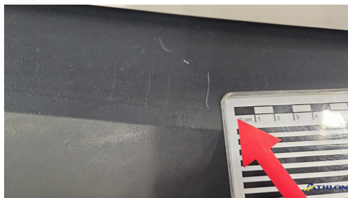
5. Stoßfänger Hinten Kratzer