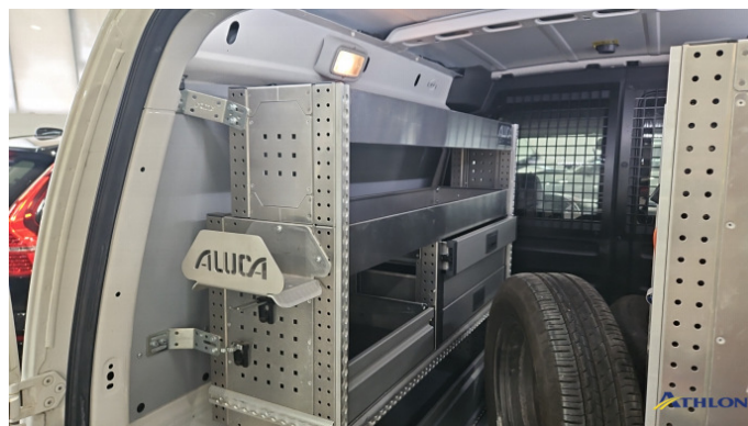
8. Laderaum Einbau Aluca In Ordnung