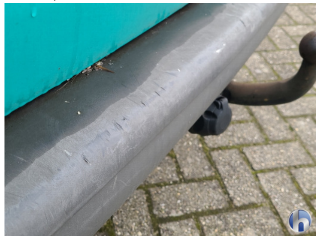
1. diverse Gebruikssporen - Aanvaardbaar