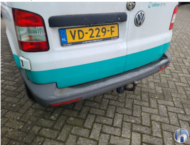
1. diverse Gebruikssporen - Aanvaardbaar