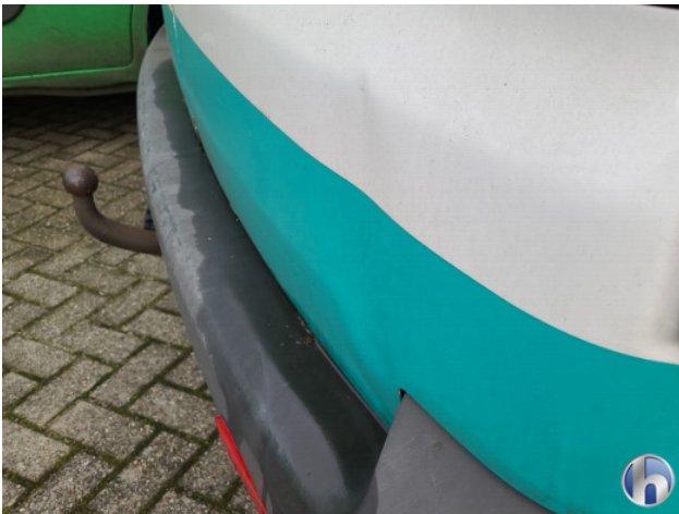
1. diverse Gebruikssporen - Aanvaardbaar