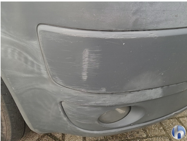
1. diverse Gebruikssporen - Aanvaardbaar