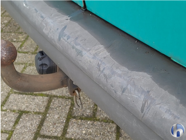
1. diverse Gebruikssporen - Aanvaardbaar