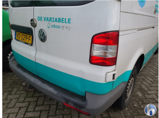
1. diverse Gebruikssporen - Aanvaardbaar