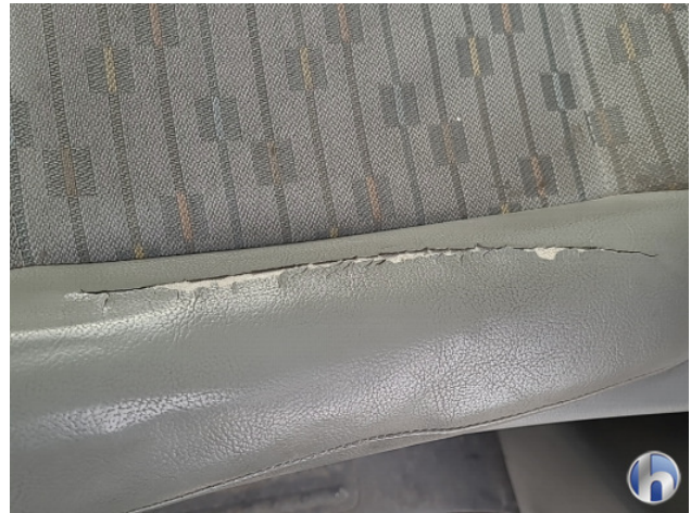
1. diverse Gebruikssporen - Aanvaardbaar