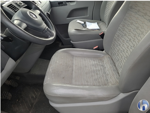
1. diverse Gebruikssporen - Aanvaardbaar