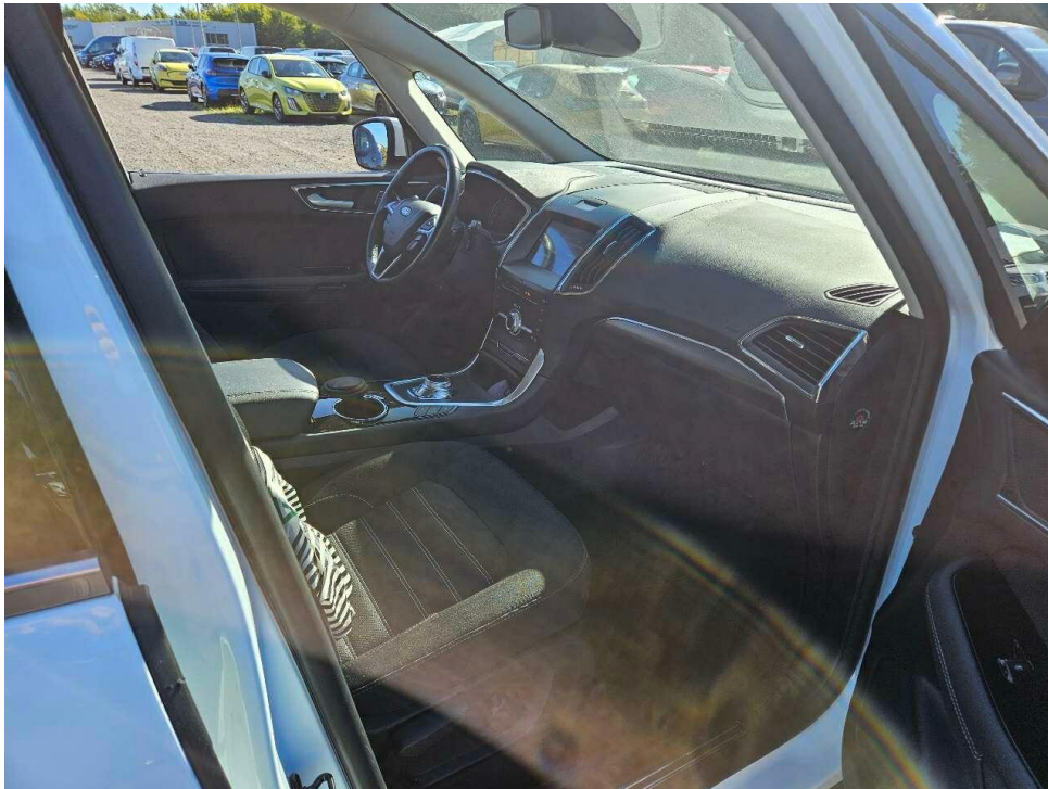
Bild 5 : Unterboden-Antriebsaggregat Innenraum durch Beifahrertür