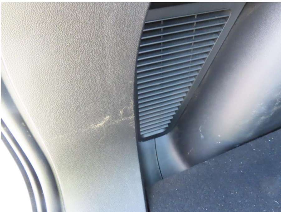
Bild 17 Kofferraumbelag Verschrammt