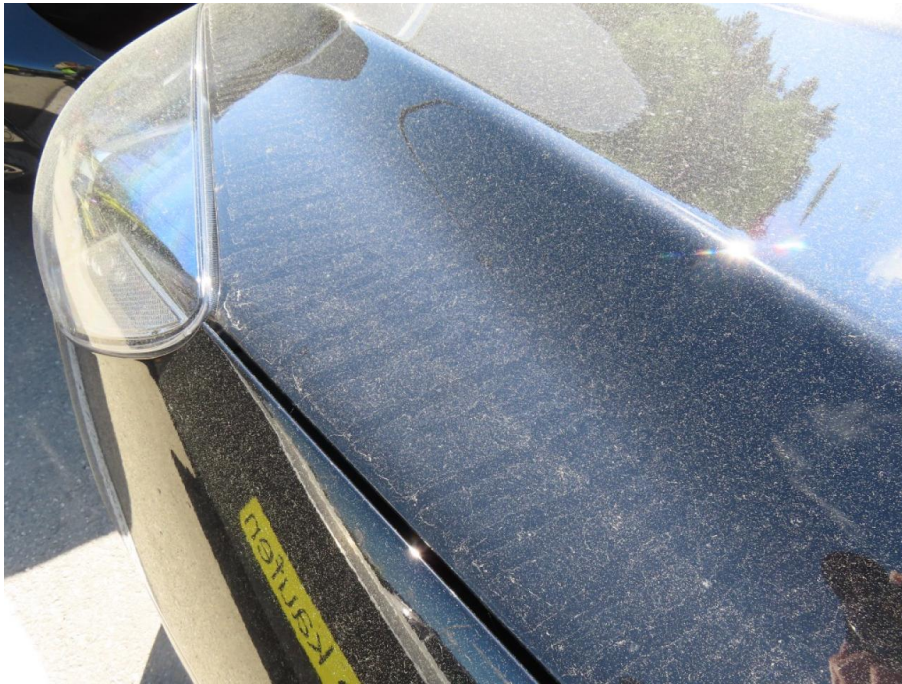
Bild 11 Fahrzeug aussen Verschmutzt - Reinigen