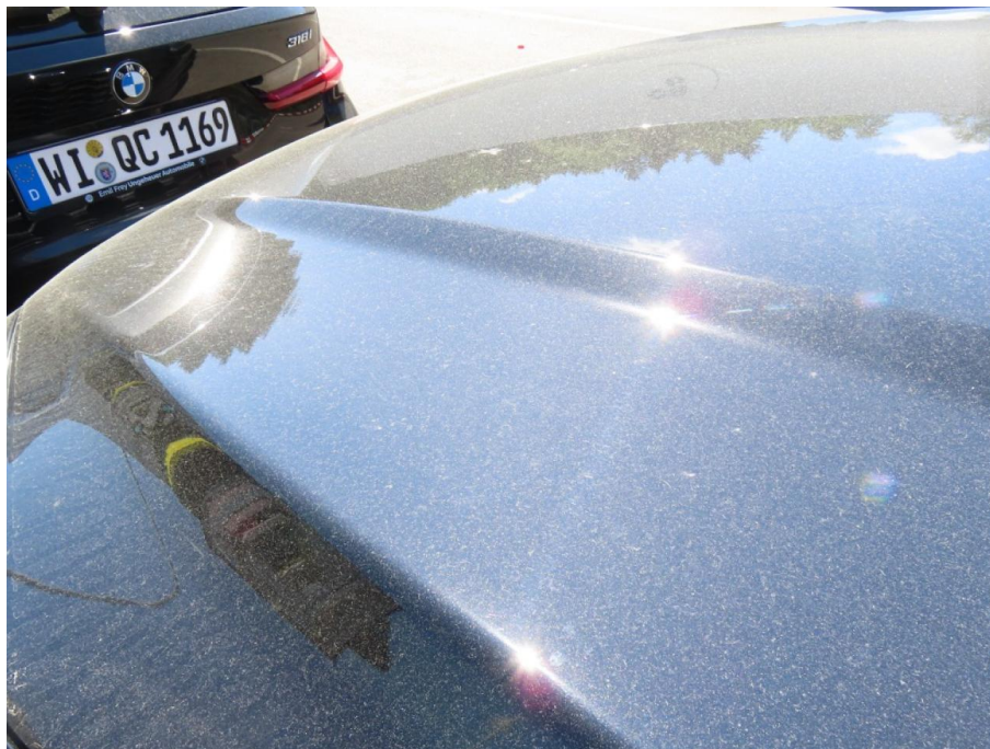
Bild 10 Fahrzeug aussen Verschmutzt - Reinigen