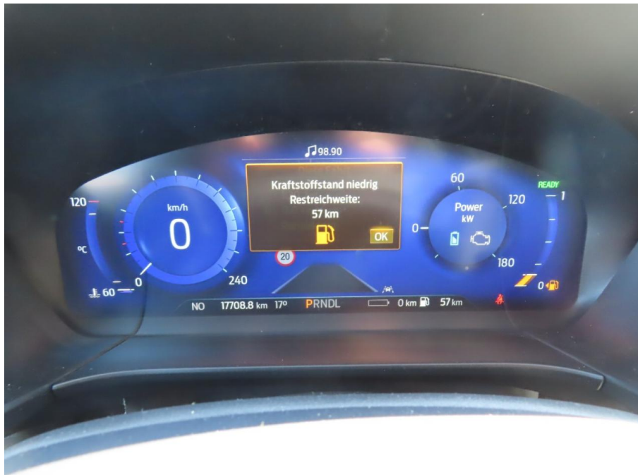
Bild 3 Tacho bei lfd. Motor