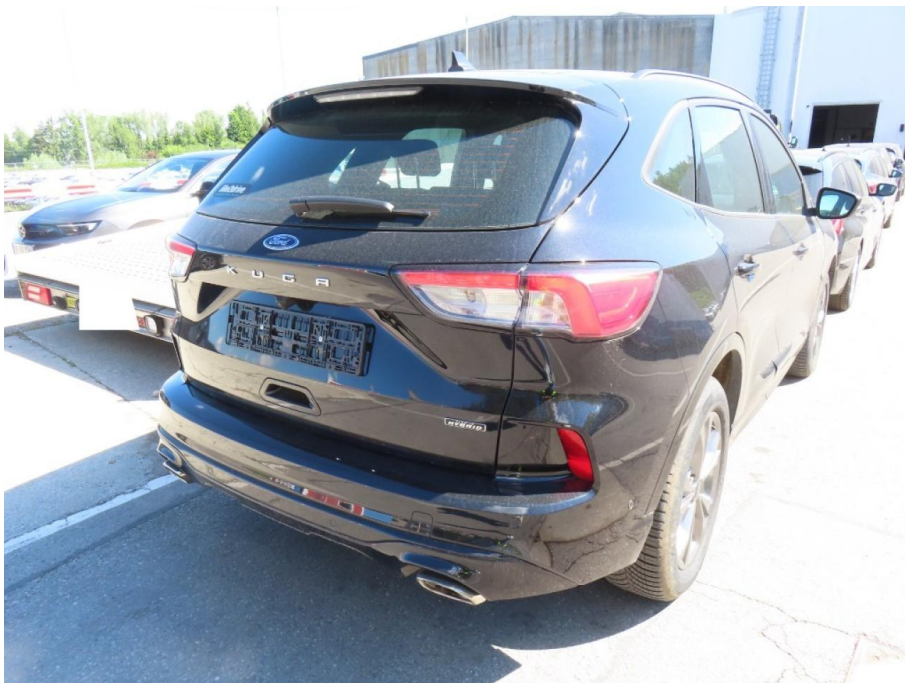
Bild 2 Diagonale hinten rechts