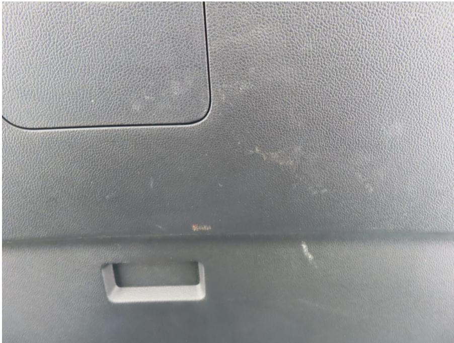
Bild 21 Kofferraumbelag Verschrammt