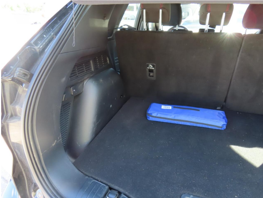
Bild 23 Kofferraumbelag Verschrammt