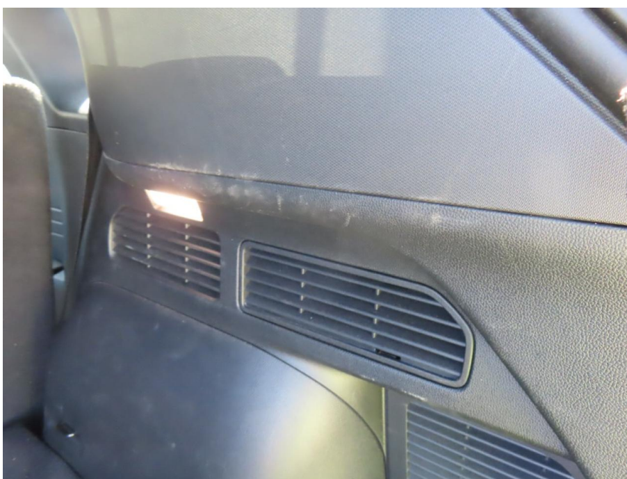
Bild 18 Kofferraumbelag Verschrammt