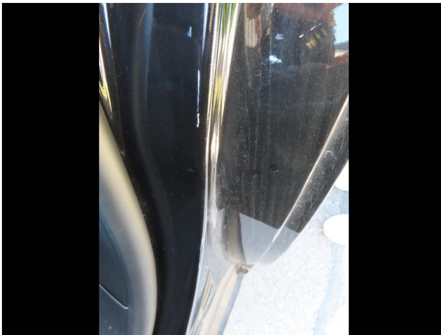
Bild 14 Türeinstieg hinten links Kratzer - Smart repair