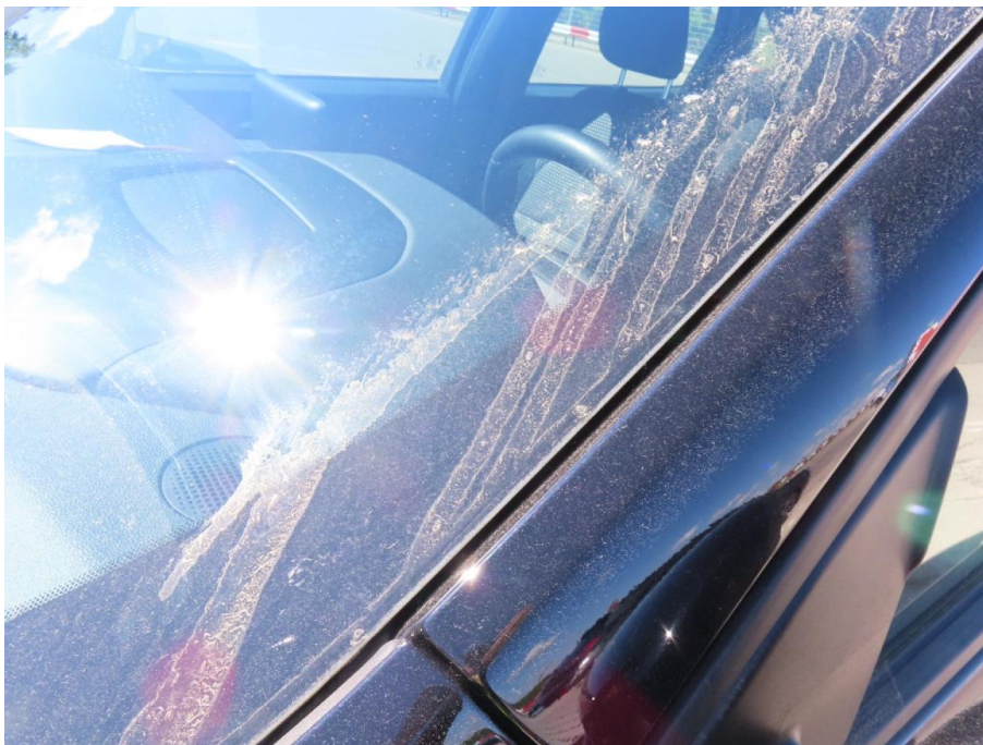
Bild 12 Fahrzeug aussen Verschmutzt - Reinigen