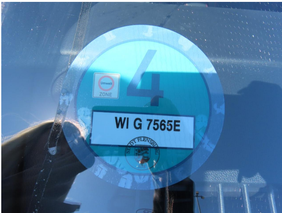
Bild 8 Umweltplakette