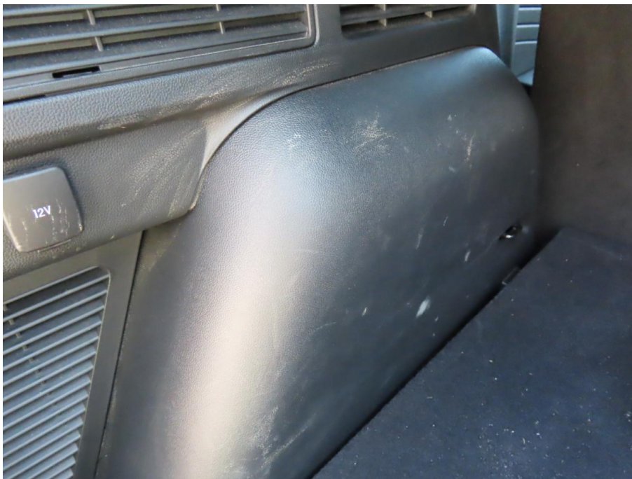
Bild 16 Kofferraumbelag Verschrammt