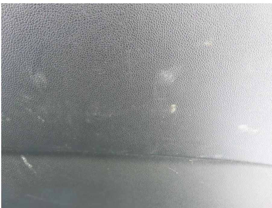
Bild 20 Kofferraumbelag Verschrammt