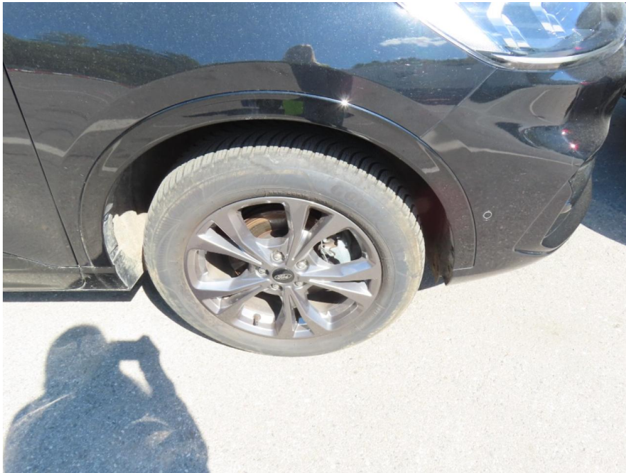
Bild 7 Reifen