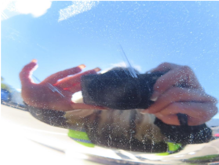
Bild 25 Aussenspiegel rechts Kratzer - Smart repair