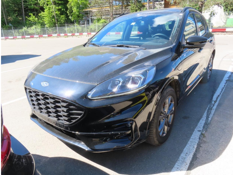
Bild 1 Übersicht vorn links