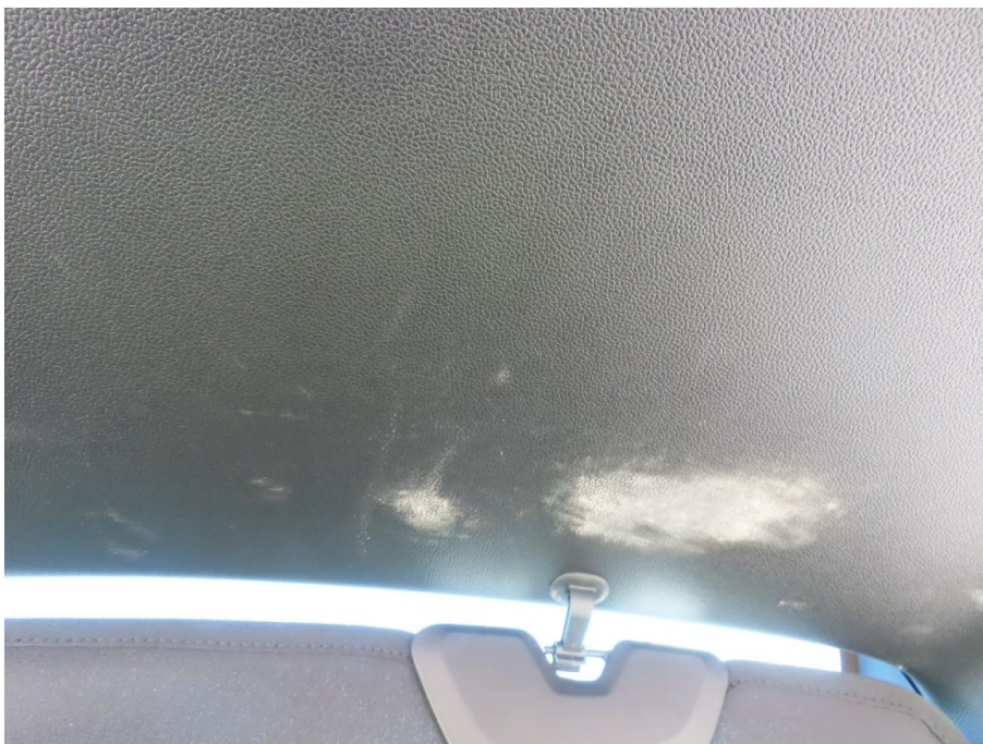
Bild 19 Kofferraumbelag Verschrammt