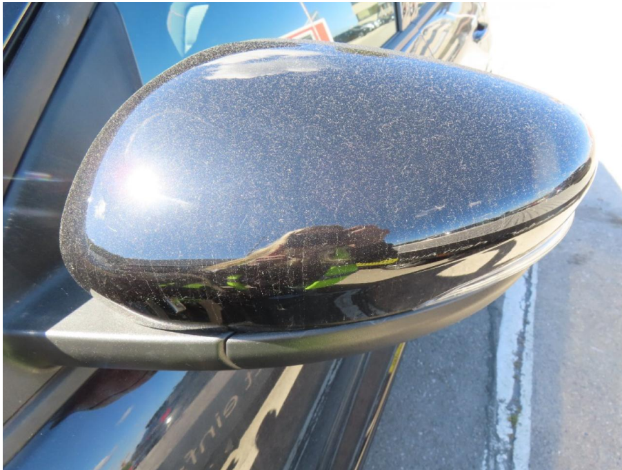
Bild 13 Fahrzeug aussen Verschmutzt - Reinigen