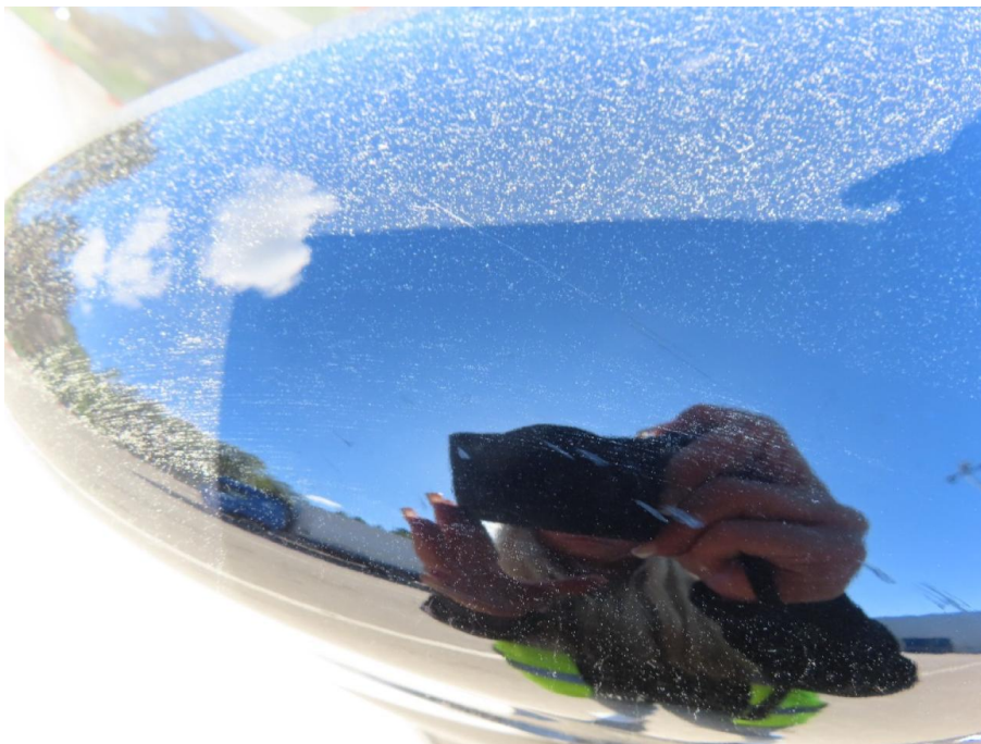
Bild 24 Aussenspiegel rechts Kratzer - Smart repair