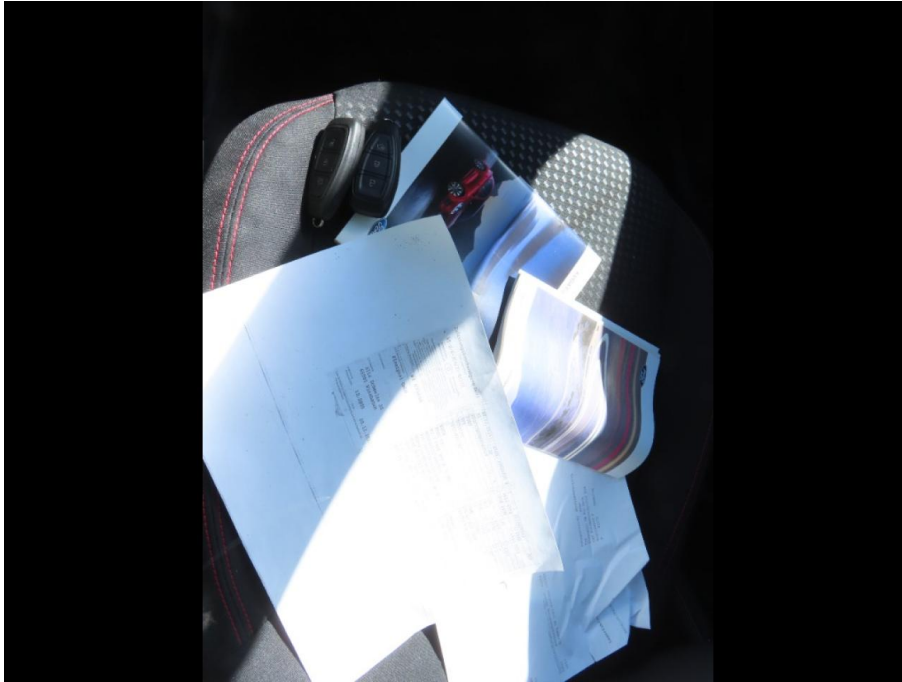
Bild 5 Schlüssel, Borddokumente