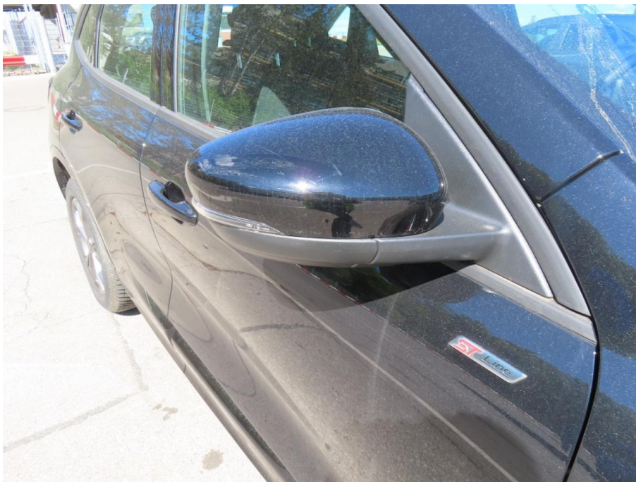
Bild 26 Aussenspiegel rechts Kratzer - Smart repair