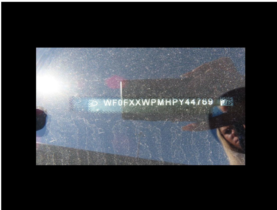
Bild 6 Fahrgestellnummer