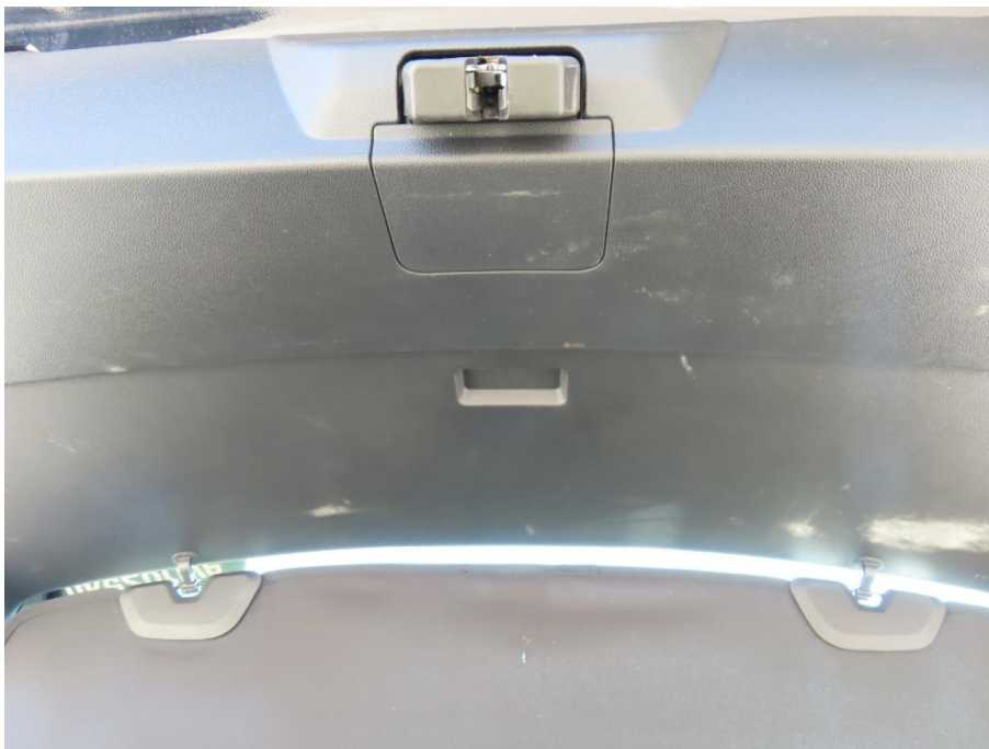
Bild 22 Kofferraumbelag Verschrammt