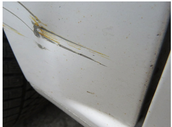
Bild 26: Seitenwand rechts deformiert - instandsetzen und lackieren