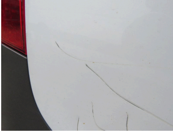
Bild 29: Seitenwand rechts deformiert - instandsetzen und lackieren