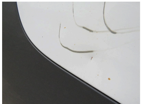
Bild 28: Seitenwand rechts deformiert - instandsetzen und lackieren