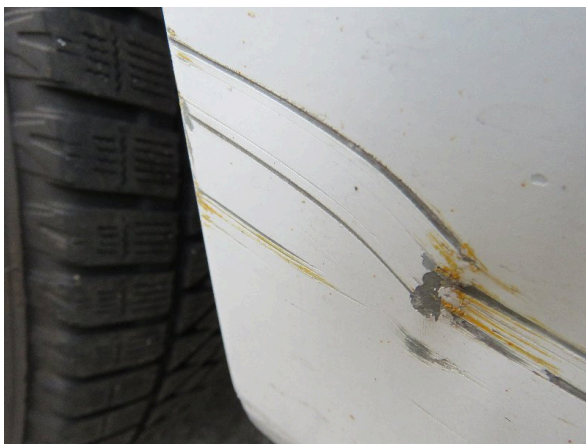
Bild 27: Seitenwand rechts deformiert - instandsetzen und lackieren