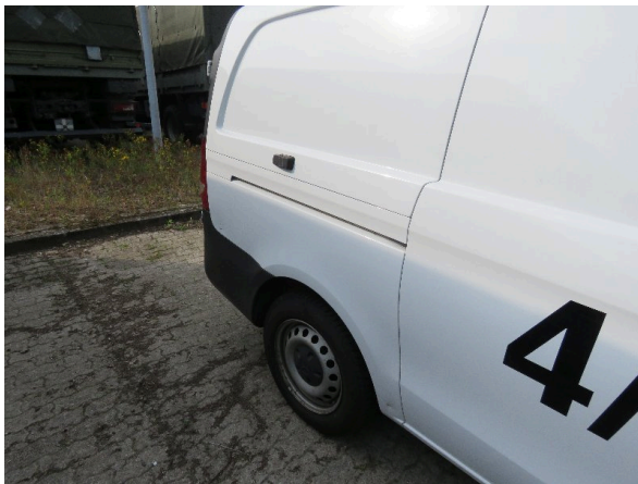
Bild 25: Seitenwand rechts deformiert - instandsetzen und lackieren