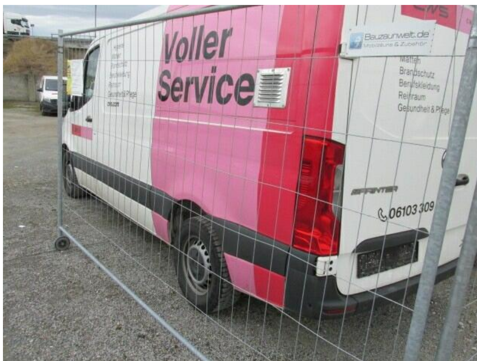
Bild 4 : Diagonal hinten links Werbung am gesamten Fahrzeug entfernen