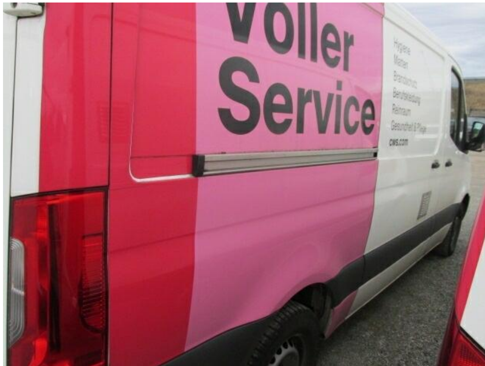
Bild 3 : Diagonal hinten rechts Werbung am gesamten Fahrzeug entfernen