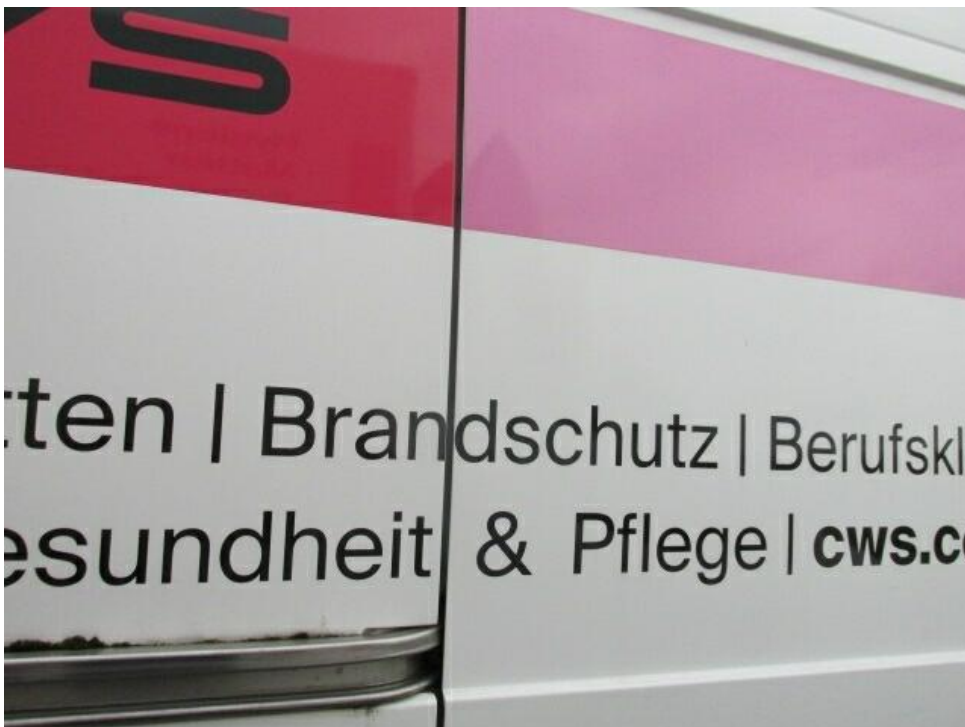
Bild 16 : Werbung am gesamten Fahrzeug entfernenb ( Schadenausweitungen möglich ).