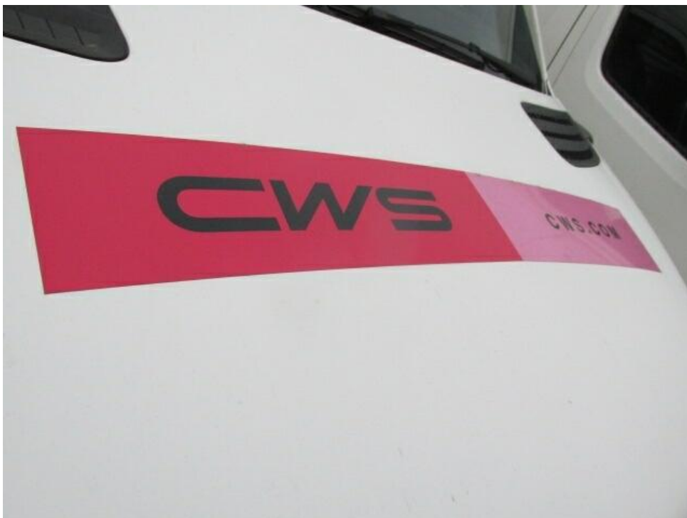
Bild 12 : Werbung am gesamten Fahrzeug entfernenb ( Schadenausweitungen möglich ).