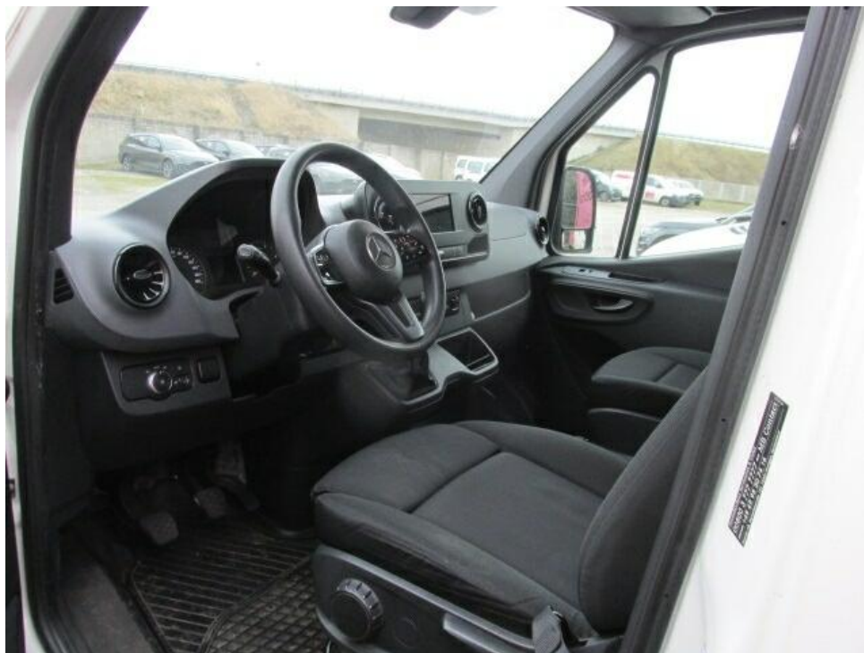
Bild 7 : Durch geöffnete Fahrertüre: Fahrersitz, Armaturenbrett und Schalthebel