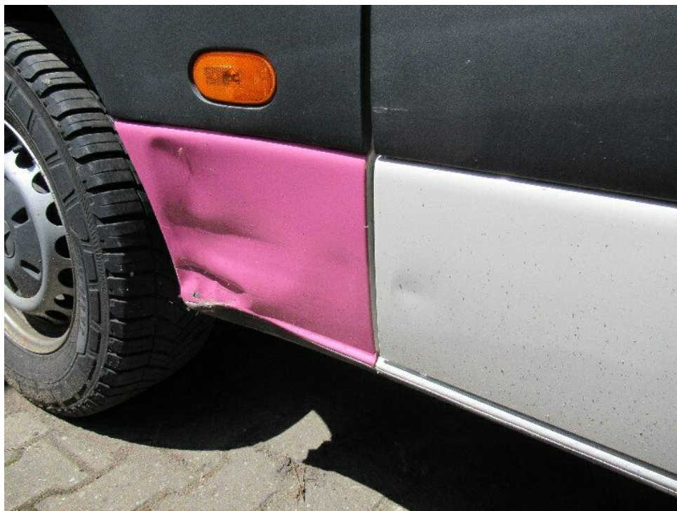
Bild 13 : Seitenwand und Schweller hinten rechts eingedrückt und verschrammt