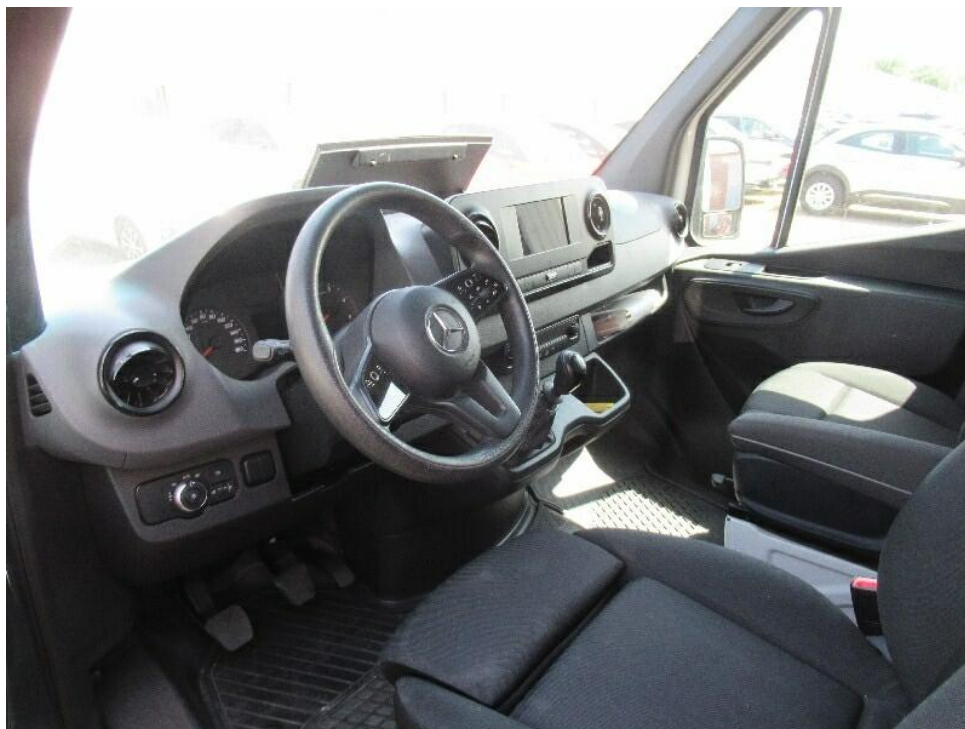
Bild 7 : Durch geöffnete Fahrertüre: Fahrersitz, Armaturenbrett und Schalthebel