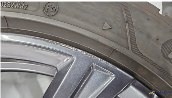
5. Winterfelge 1 Kratzer