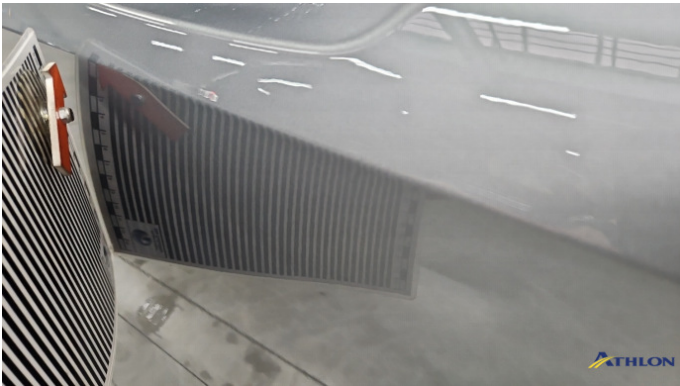
2. Tür Vorne - Rechts 1 Delle