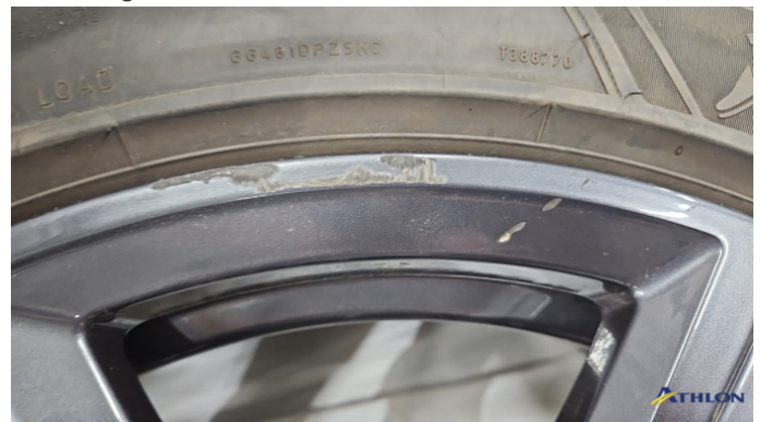
6. Winterfelge 2 Kratzer