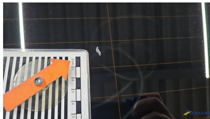
1. Heckscheibe Verschmutzt (leicht)