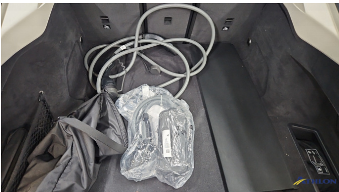
7. Ladekabel In Ordnung