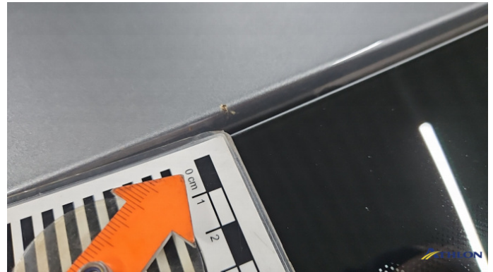
3. Dach Steinschlag