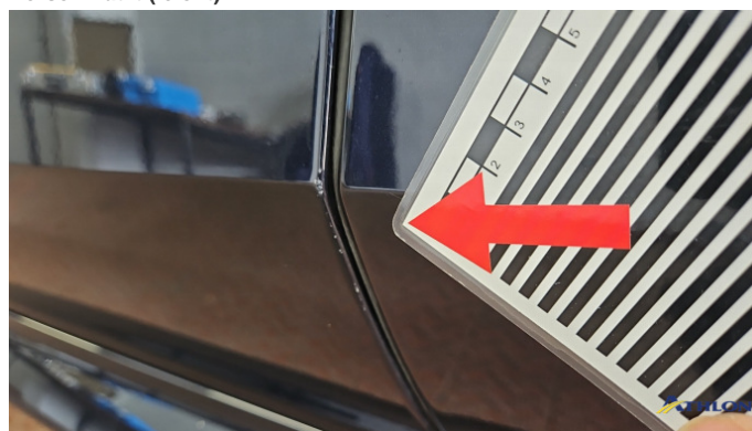
5. Tür Vorne - Links Kratzer