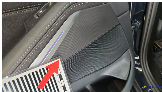
16. Türverkleidung Hinten - Links Kratzer