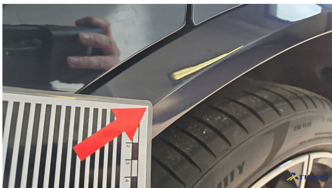
17. Verkleidung Radhaus h.l. Kratzer