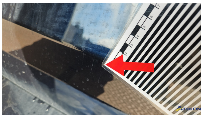
9. Heckklappe Kratzer