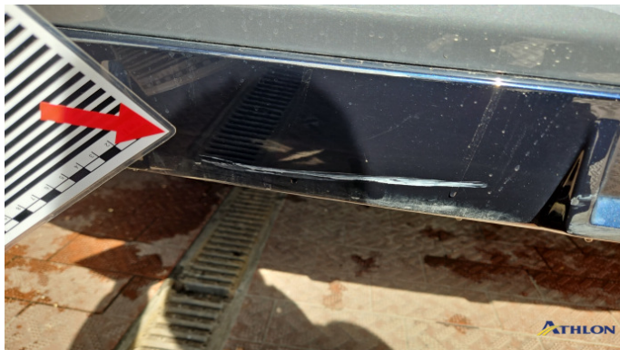
8. Stoßfänger Hinten Kratzer Ab 60mm