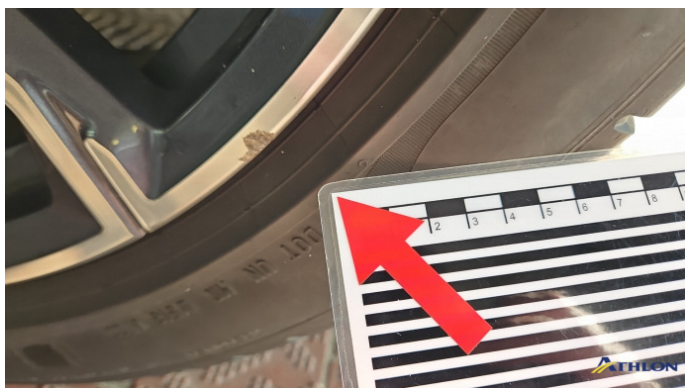
6. Felge Hinten - Links Kratzer