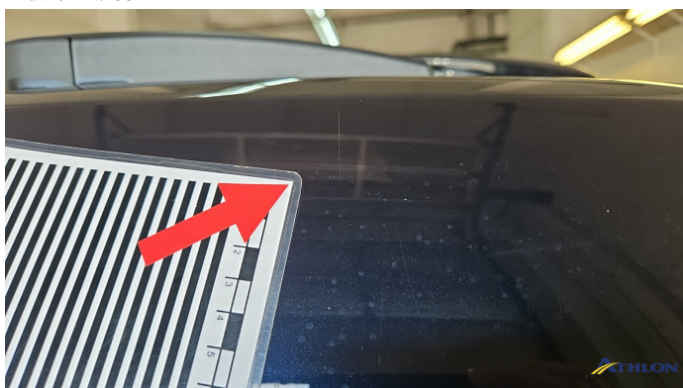
9. Heckklappe Kratzer