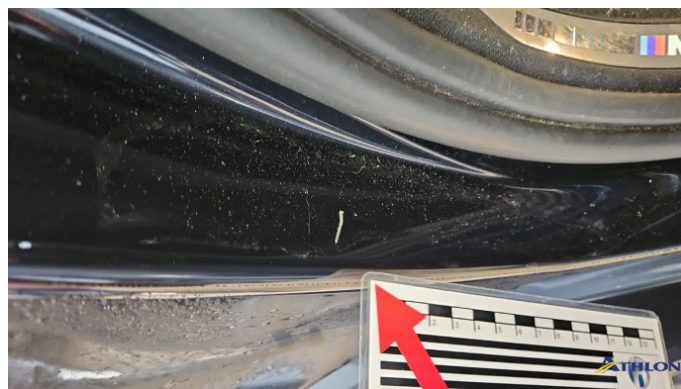
12. Türeinstieg Hinten - Rechts Kratzer