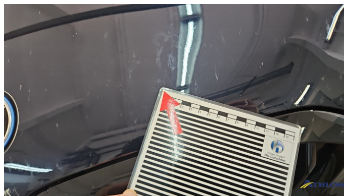
3. Motorhaube Verschmutzt (leicht)