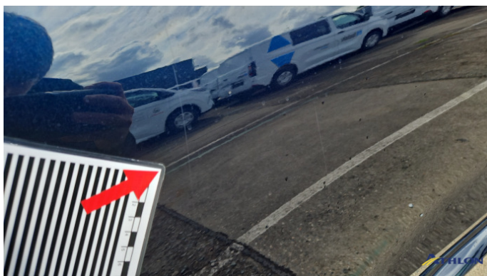
15. Tür Hinten - Rechts Kratzer