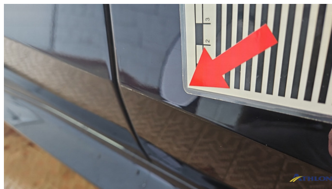
11. Tür Vorne - Rechts Siehe Gutachten