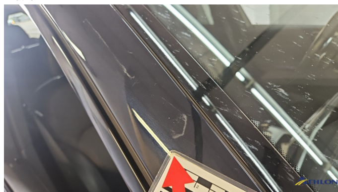
14. A-Säule Vorne - Rechts Kratzer