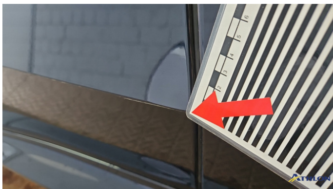
10. Tür Hinten - Rechts Siehe Gutachten