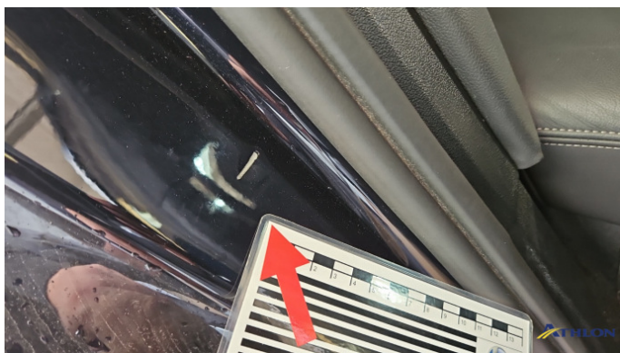
12. Türeinstieg Hinten - Rechts Kratzer