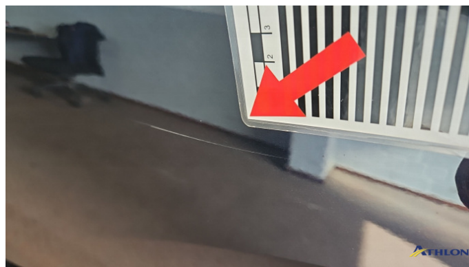
7. Tür Hinten - Links Kratzer