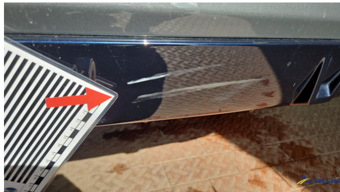
8. Stoßfänger Hinten Kratzer Ab 60mm