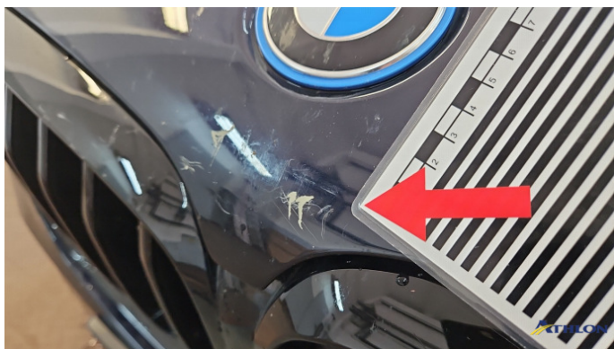
2. Motorhaube Kratzer