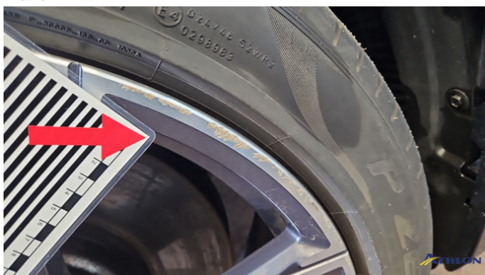
13. Felge Vorne - Rechts Kratzer