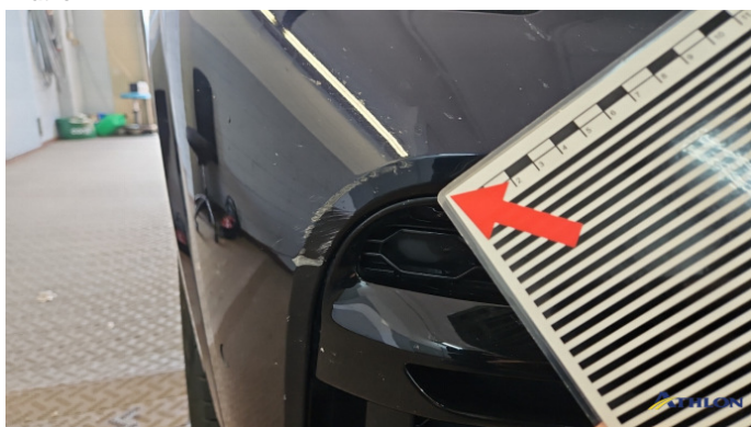
4. Stoßfänger Vorne Kratzer Ab 60mm