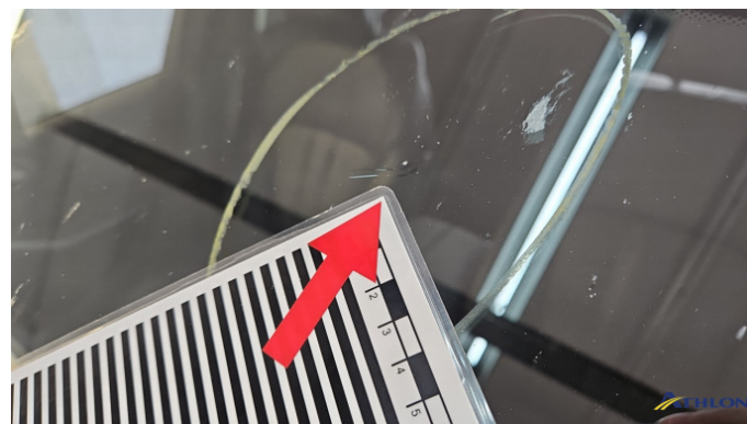
1. Windschutzscheibe Steinschlag