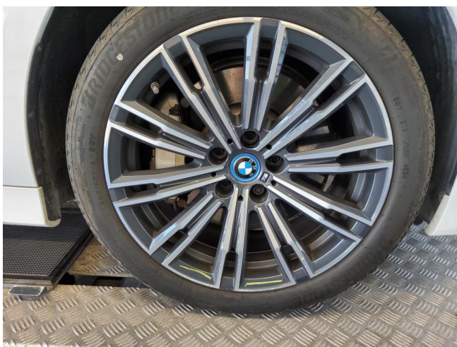
Felge VR stark verschrammt ern