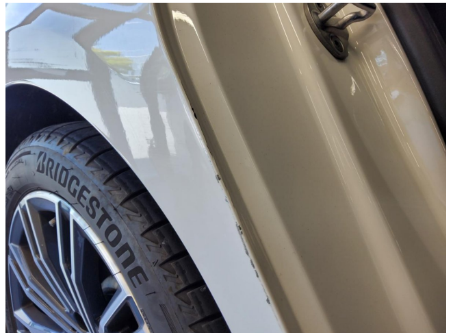
Fondseite rechts - Delle - instandsetzen u. lackieren