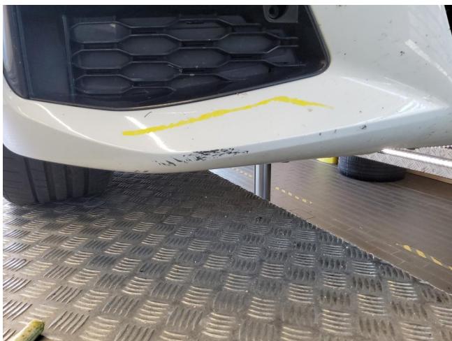
Stoßfänger vorne - Kratzer - lackieren