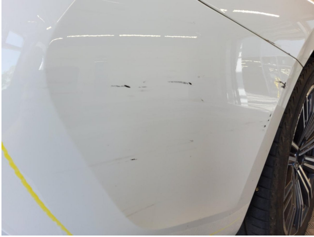
Stoßfänger hinten - Kratzer, erneuern (Radarsystem verbaut)