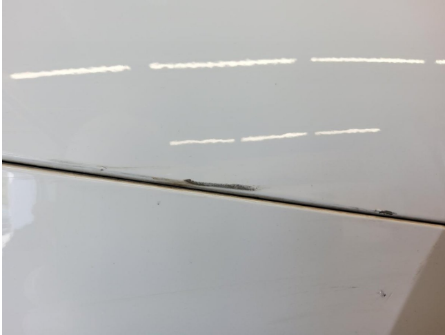
Fondseite rechts - Delle - instandsetzen u. lackieren