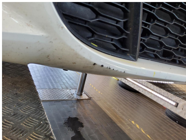
Stoßfänger vorne - Kratzer - lackieren