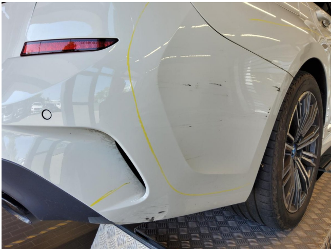
Stoßfänger hinten - Kratzer, erneuern (Radarsystem verbaut)