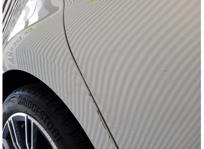
Tür hinten rechts - Kratzer - lackieren