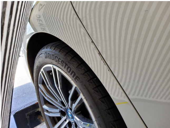
Fondseite rechts - Delle - instandsetzen u. lackieren