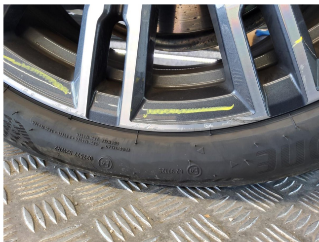
Felge VR stark verschrammt ern