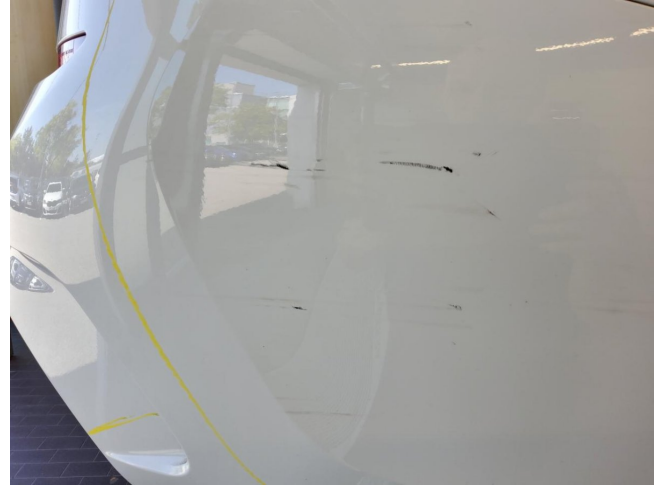
Stoßfänger hinten - Kratzer, erneuern (Radarsystem verbaut)