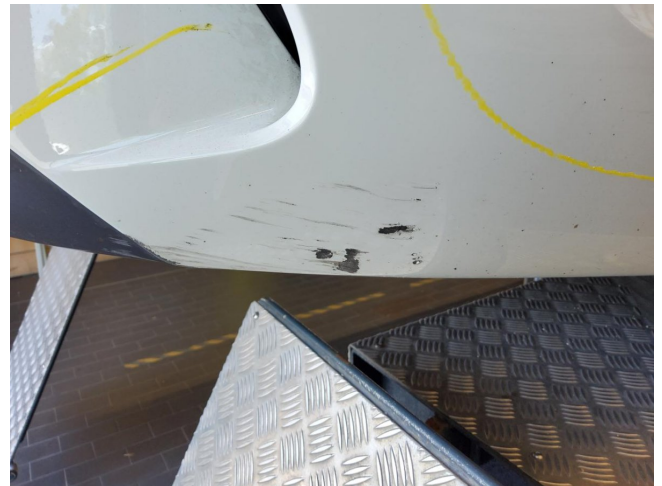
Stoßfänger hinten - Kratzer, erneuern (Radarsystem verbaut)