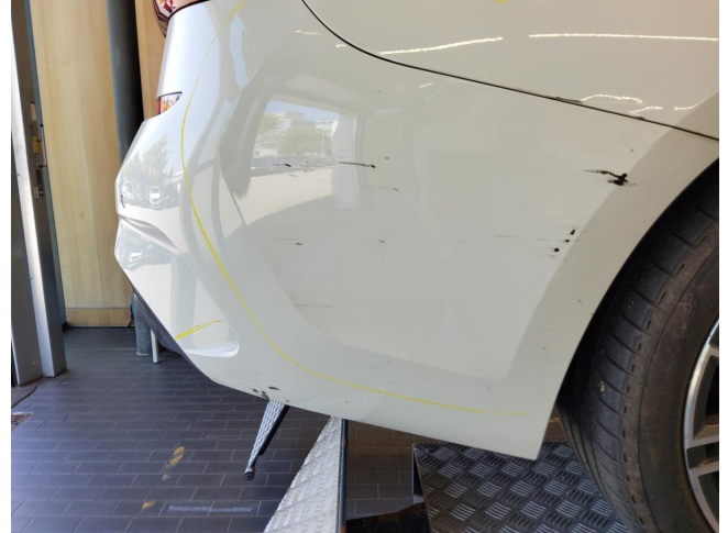
Stoßfänger hinten - Kratzer, erneuern (Radarsystem verbaut)