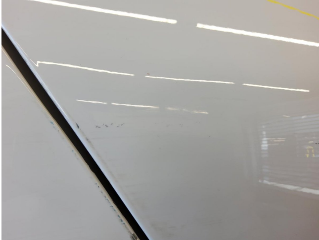
Tür hinten rechts - Kratzer - lackieren