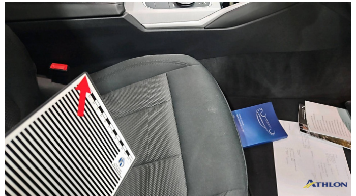
5. Sitz - Vorne - Rechts: Kissen Verschmutzt (mittel)