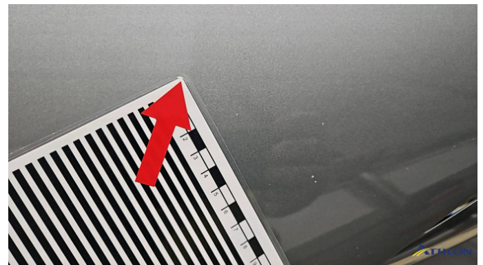
1. Motorhaube Steinschlag