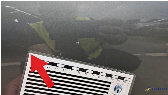
2. Tür Vorne - Links Kratzer