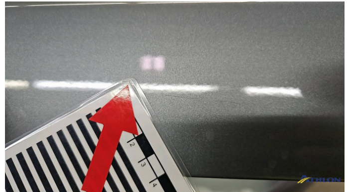
3. Heckklappe Kratzer