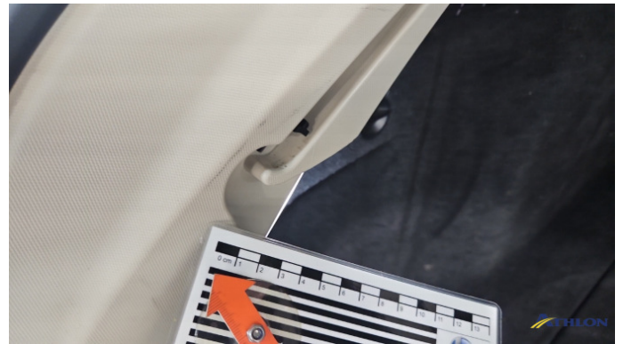
5. Kofferraumverkleidung Verschmutzt (leicht)