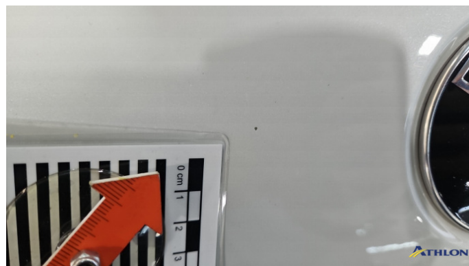
1. Motorhaube Steinschlag