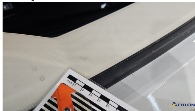
5. Kofferraumverkleidung Verschmutzt (leicht)