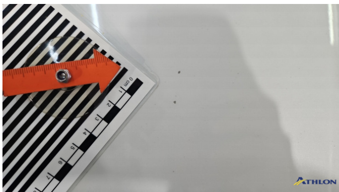
1. Motorhaube Steinschlag