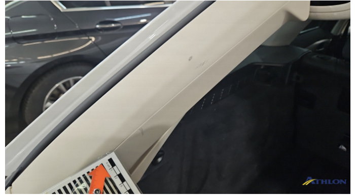
5. Kofferraumverkleidung Verschmutzt (leicht)