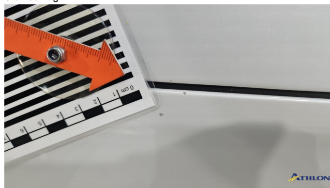
3. Kotflügel Vorne - Rechts Steinschlag