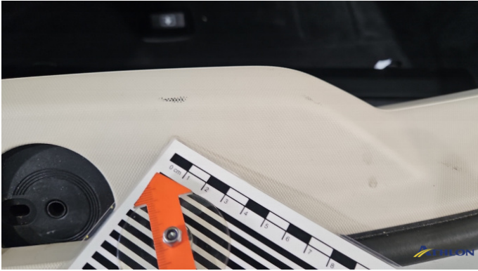
5. Kofferraumverkleidung Verschmutzt (leicht)