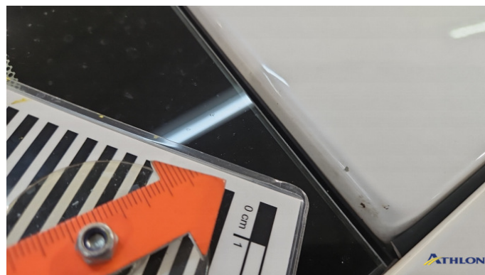
2. Dach Steinschlag