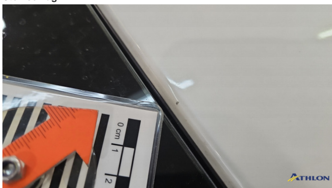
2. Dach Steinschlag