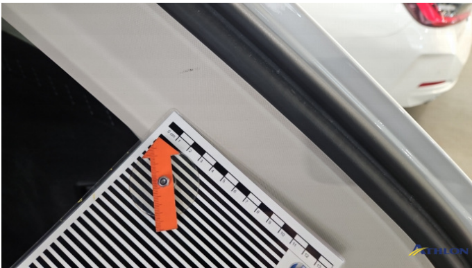
5. Kofferraumverkleidung Verschmutzt (leicht)