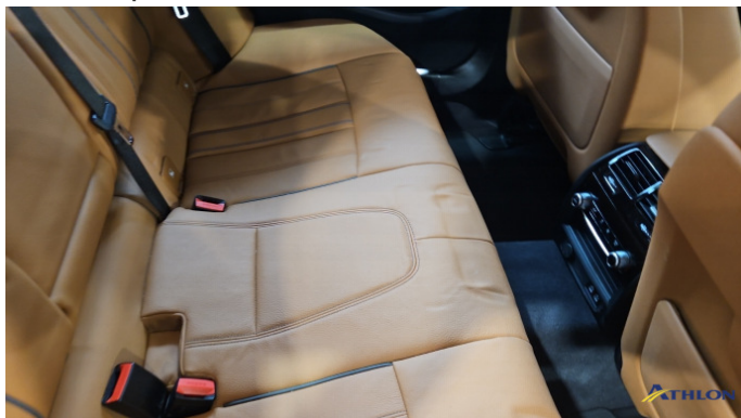
5. Sitzbank - Hinten Gebrauchsspuren