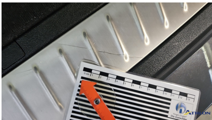
6. Laderaumkante Kratzer