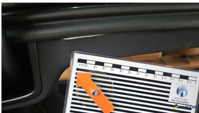
4. Dachhimmel Gebrauchsspuren