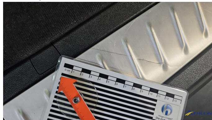
6. Laderaumkante Kratzer