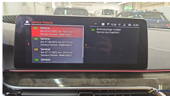
3. Wartungsnachweis In Ordnung