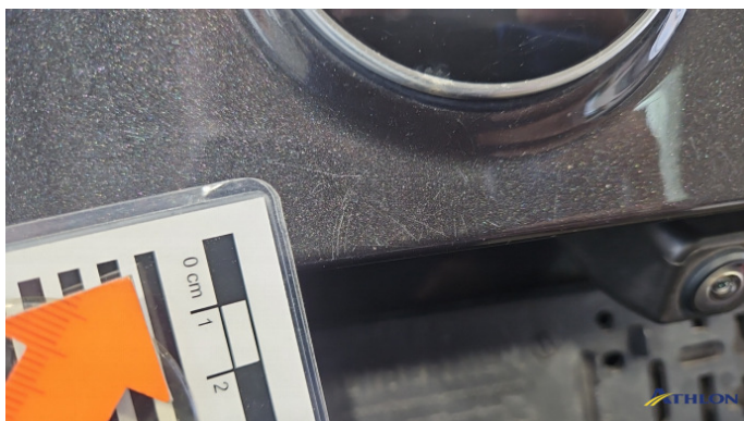
2. Heckklappe Kratzer