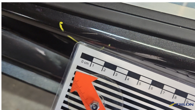
1. Türeinstieg Hinten - Links Kratzer