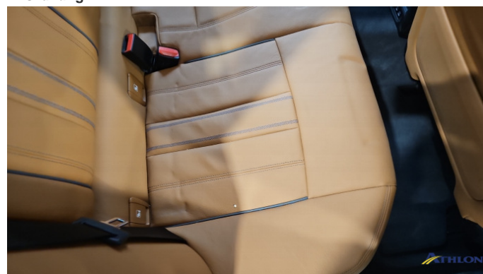
5. Sitzbank - Hinten Gebrauchsspuren