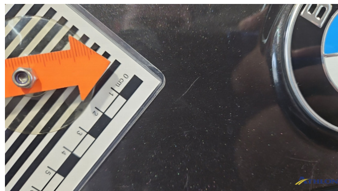
2. Heckklappe Kratzer