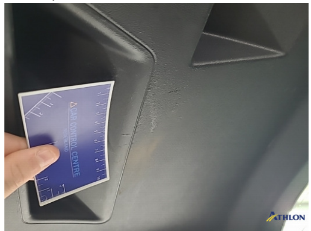
2. kofferdekselbekleding Gebruikssporen