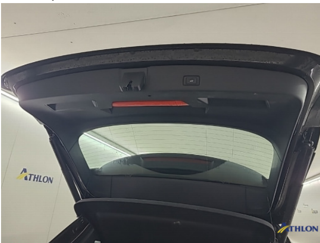
2. kofferdekselbekleding Gebruikssporen