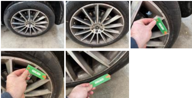
Jante alum. ARD bi-ton/polychrome, Griffes(s), Réparer/rempl. (montant forfaitaire)