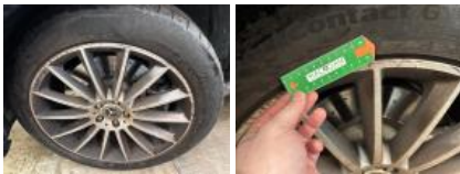
Jante alum. ARG bi-ton/polychrome, Griffes(s), Réparer/rempl. (montant forfaitaire)