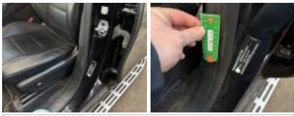
Intérieur, Tache, Nettoyer