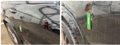
Aile AVD, Mauvaise réparation, Peindre