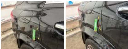
Porte ARD, Bosse(s), PDR - Débosselage ss peinture