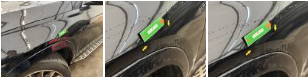
Porte ARG, Griffe(s), 67 - Lustrage