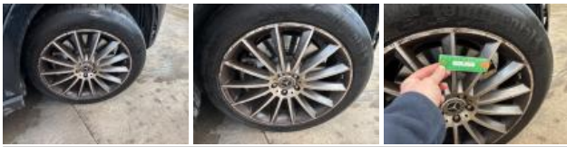
Pneu AVD, Déchirure, E - Remplacer