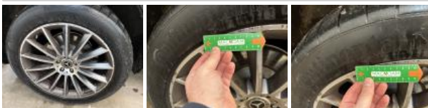
Jante alum. AVD bi-ton/polychrome, Griffes(s), Réparer/rempl. (montant forfaitaire)