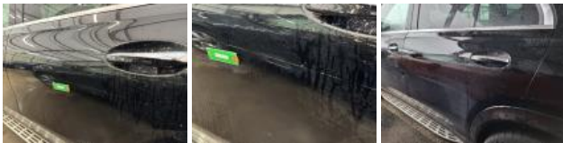
Aile ARG, Griffe(s), 67 - Lustrage