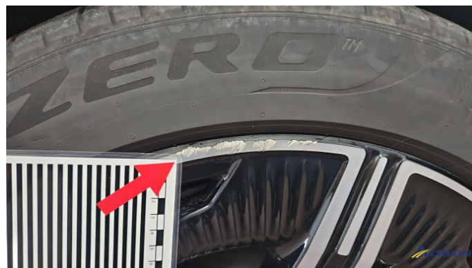
5. Felge Vorne - Rechts Kratzer