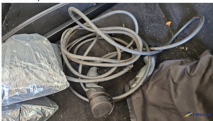
10. Ladekabel In Ordnung