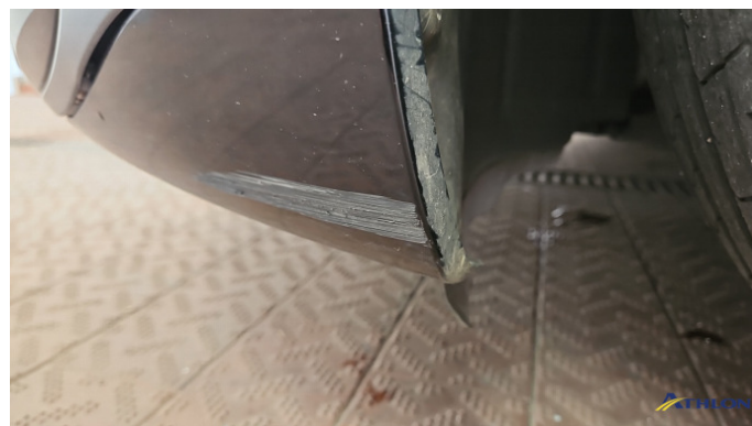
1. Stoßfänger Vorne Kratzer Ab 60mm