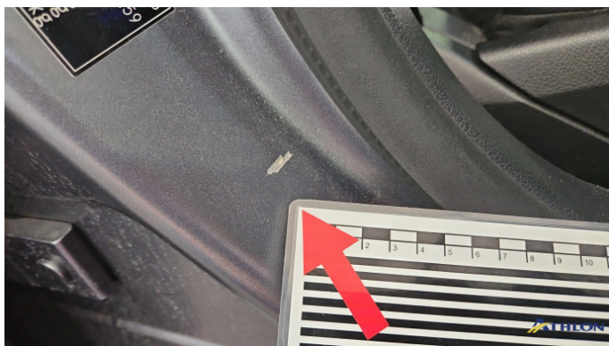
4. Türeinstieg Vorne - Rechts Kratzer