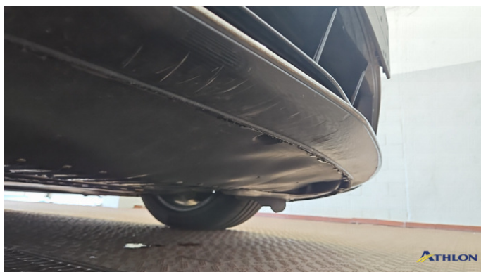
1. Stoßfänger Vorne Kratzer Ab 60mm