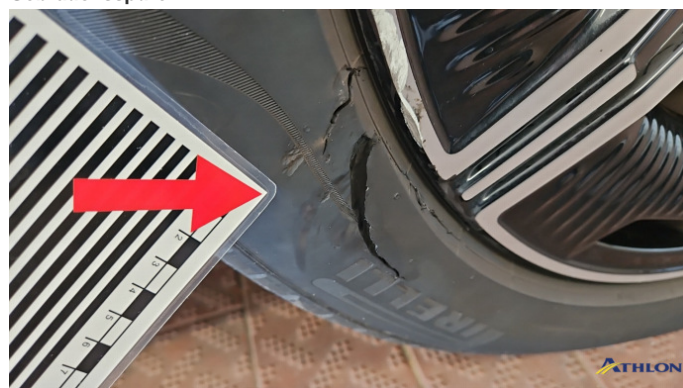
11. Reifen Vorne - Rechts Beschädigt