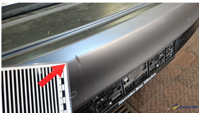
2. Stoßfänger Hinten Kratzer