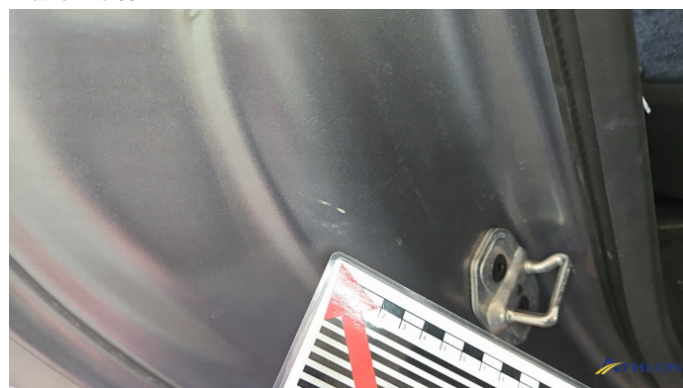
3. Türeinstieg Hinten - Rechts Kratzer