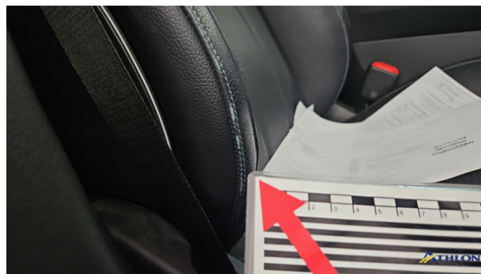
7. Sitz - Vorne - Rechts: Lehne Gebrauchsspuren