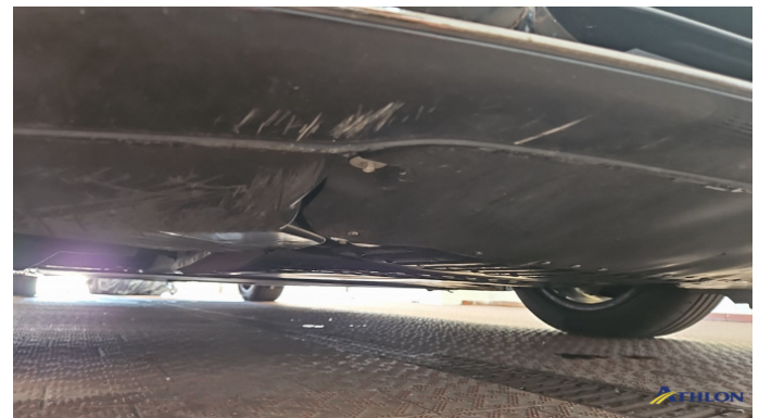
1. Stoßfänger Vorne Kratzer Ab 60mm