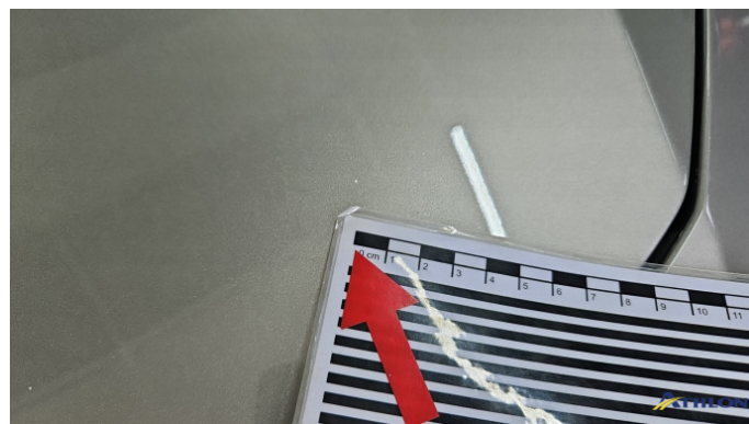
1. Motorhaube Steinschlag