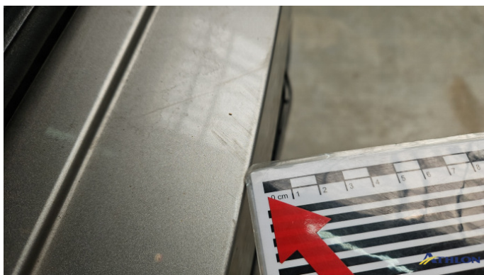
5. Stoßfänger Hinten Kratzer