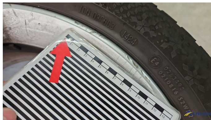
9. Winterfelge 1 Kratzer