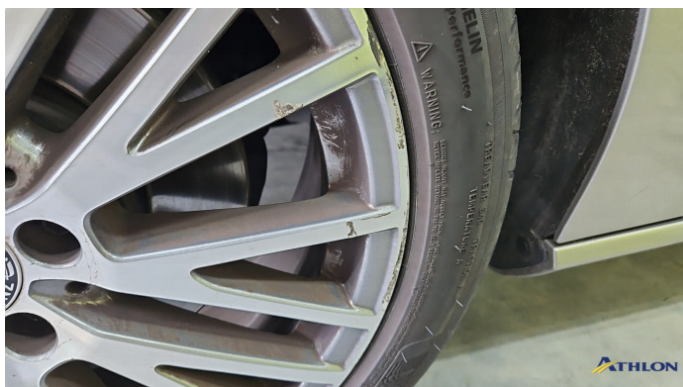
2. Felge Vorne - Links Kratzer