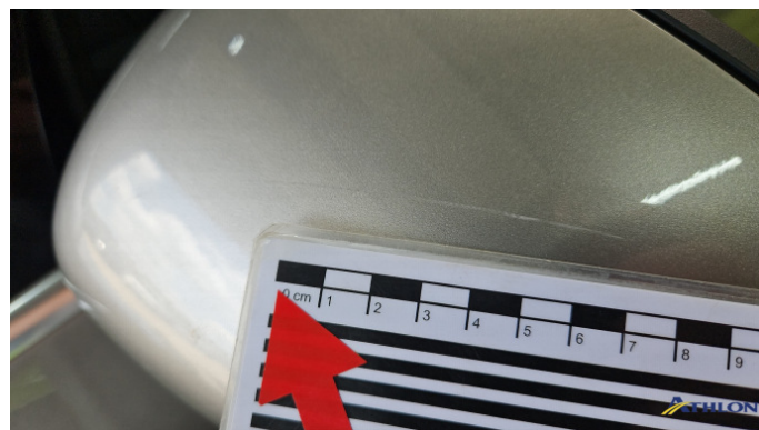
3. Außenspiegel Gehäuse - Links Kratzer