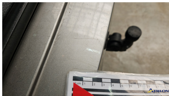
5. Stoßfänger Hinten Kratzer