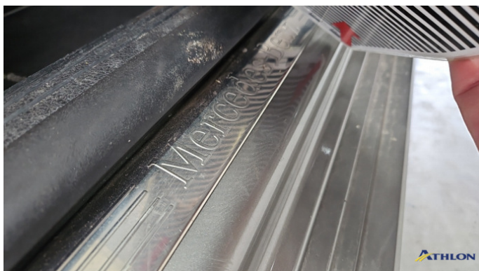
7. Türeinstieg Vorne - Rechts Verformt (leicht)