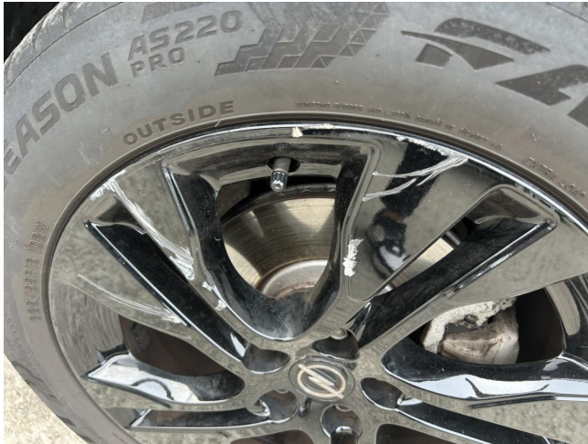
Felge VR beschädigt - erneuen

Anzahl Halter lt. Zulbesch. II: keine Angabe