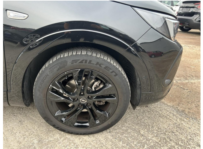
Felge VR beschädigt - erneuen