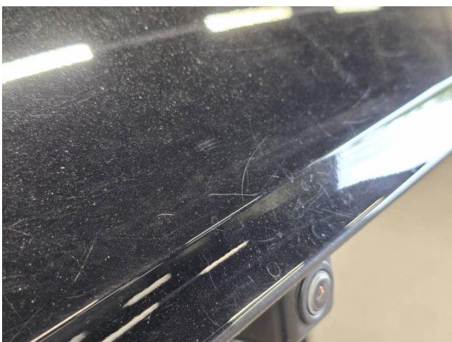
Heckklappe - auslegen