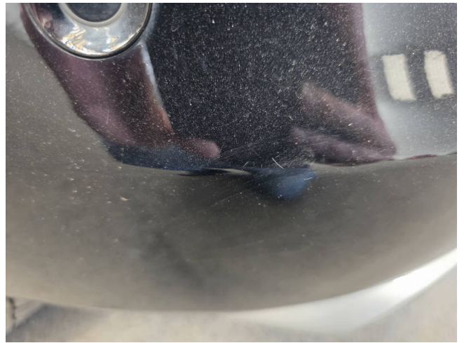
Stoßfänger H - auslegen