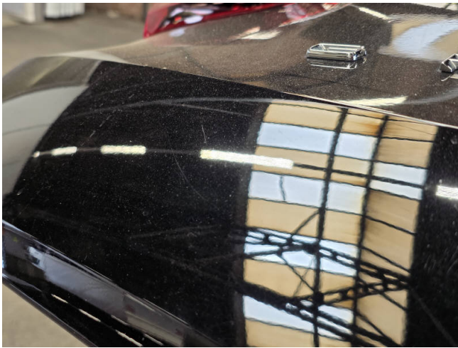
Heckklappe - auslegen