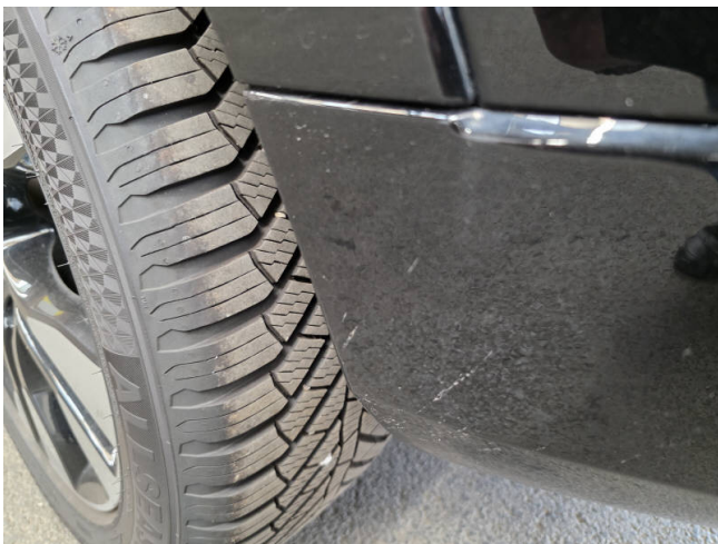
Stoßfänger H - auslegen