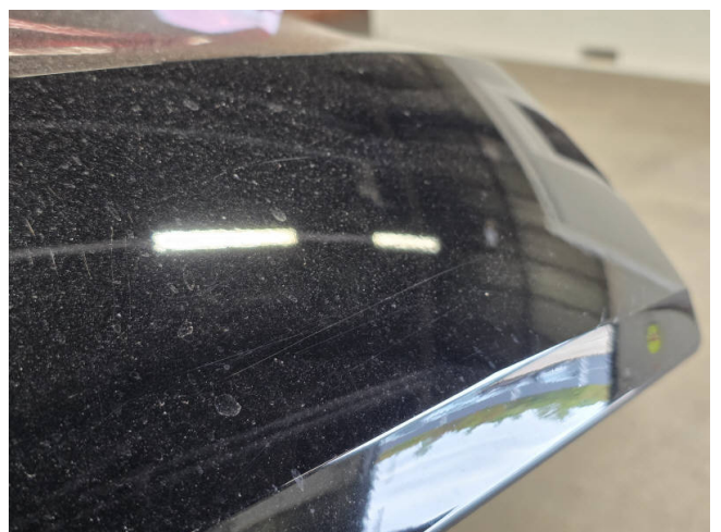
Heckklappe - auslegen