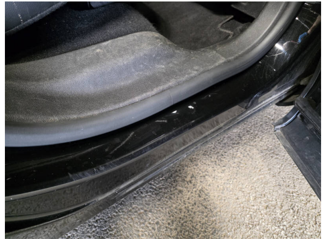
Türeinstieg HR - Smart Repair