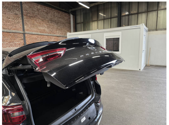
Heckklappe - auslegen