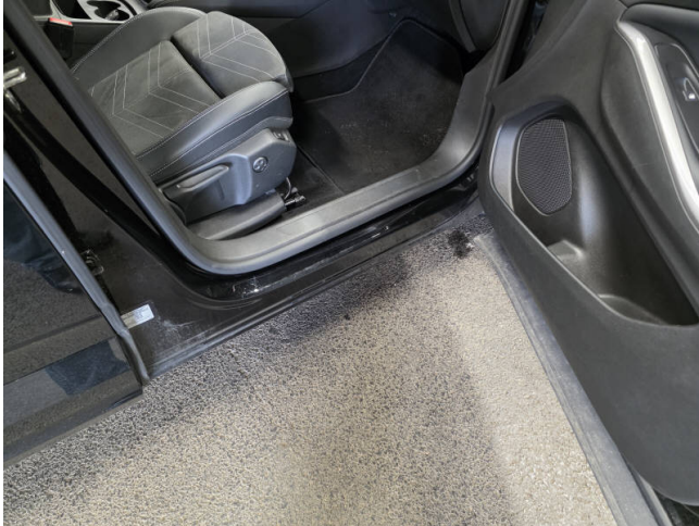
Türeinstieg VR - Smart Repair

Anzahl Halter lt. Zulbesch. II: keine Angabe