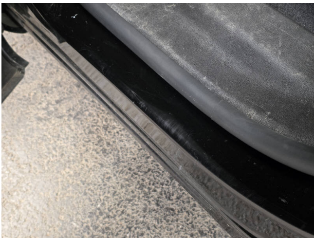
Türeinstieg HL - Smart Repair