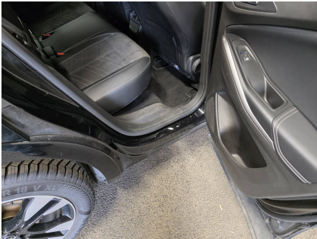
Türeinstieg HR - Smart Repair