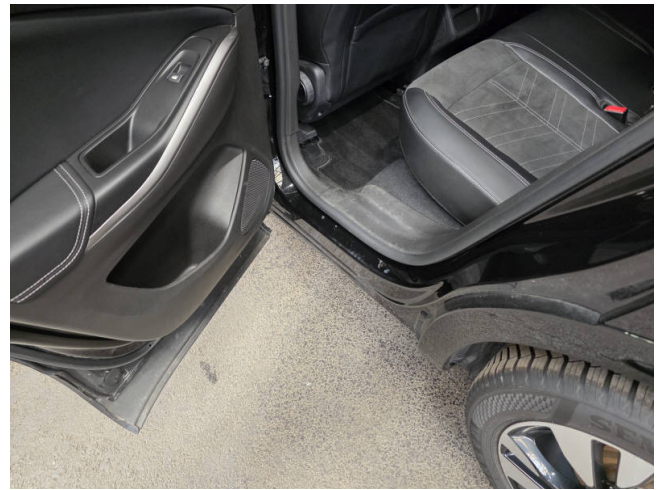
Türeinstieg HL - Smart Repair