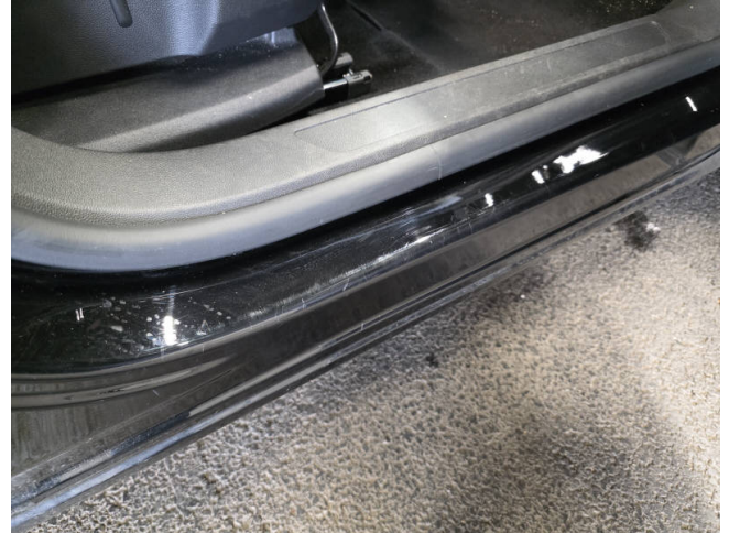
Türeinstieg VR - Smart Repair