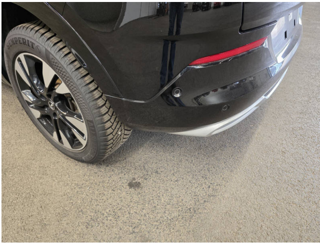
Stoßfänger H - auslegen