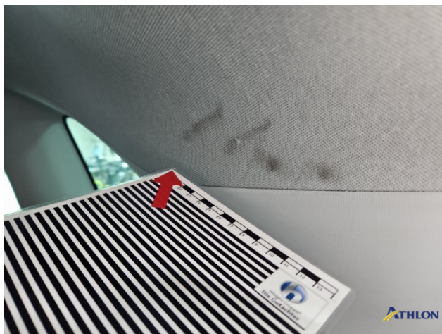
14. Kofferraum Gebrauchsspuren