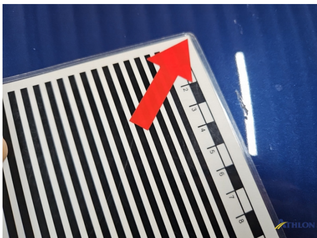
1. Motorhaube Kratzer Ab 60mm