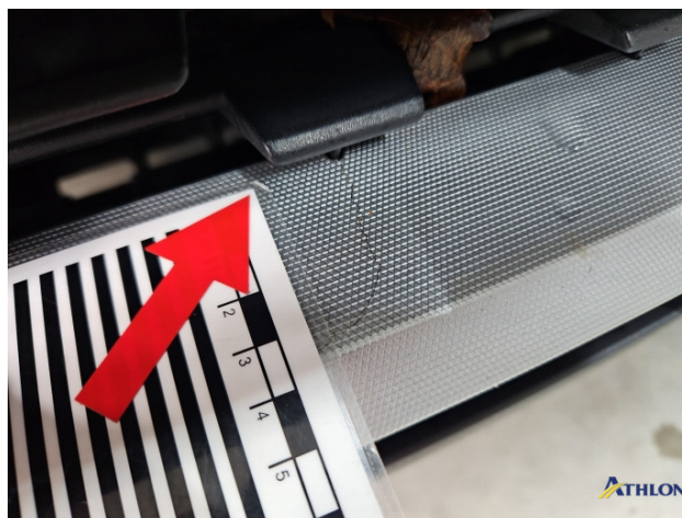
2. Stoßfänger Vorne Bruch