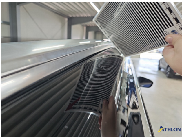
8. Dachrahmen - Rechts 1 Delle