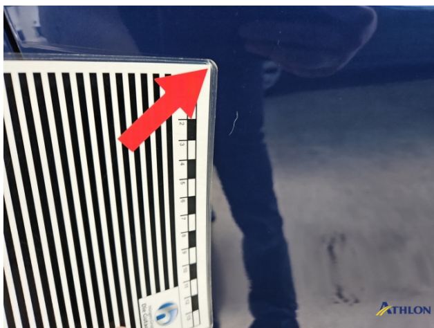
13. Tür Vorne - Rechts Kratzer