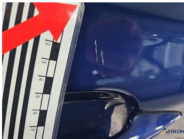
13. Tür Vorne - Rechts Kratzer