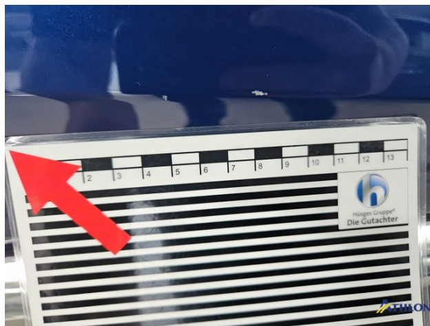
11. Tür Hinten - Rechts Kratzer