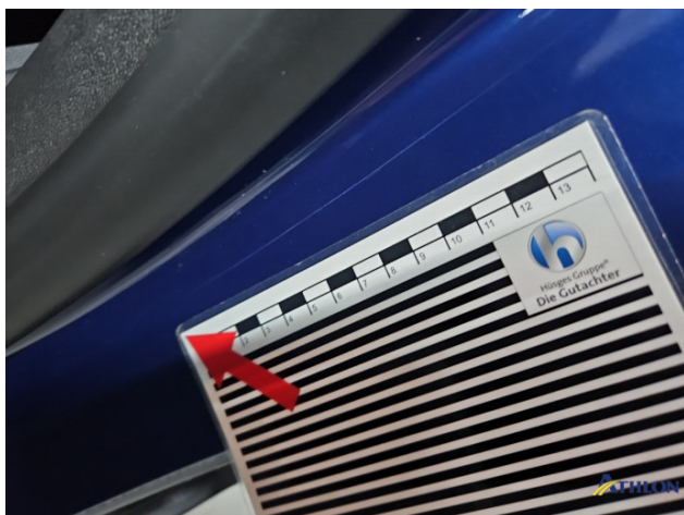
6. Türeinstieg Hinten - Links Kratzer