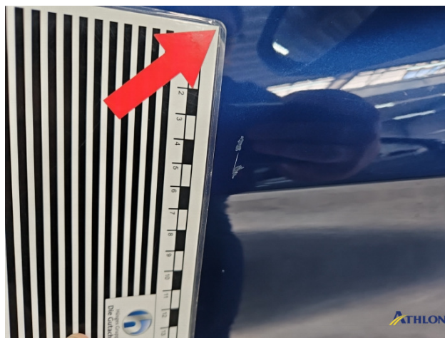
13. Tür Vorne - Rechts Kratzer