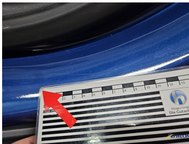
4. Türeinstieg Vorne - Links Kratzer