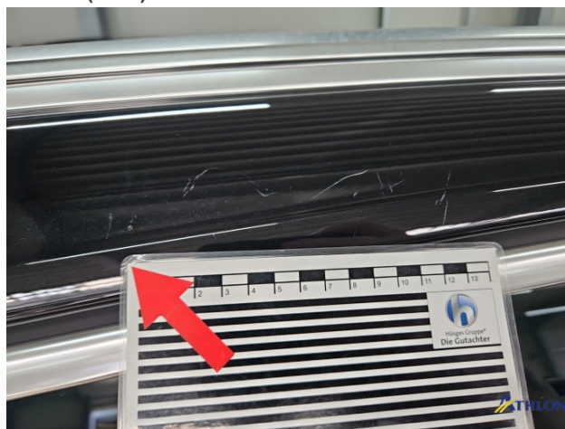
9. Dachrahmen - Rechts Kratzer