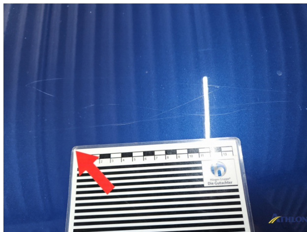
1. Motorhaube Kratzer Ab 60mm