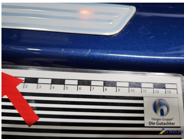
4. Türeinstieg Vorne - Links Kratzer