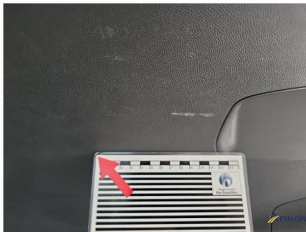
14. Kofferraum Gebrauchsspuren