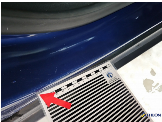
10. Türeinstieg Hinten - Rechts Kratzer