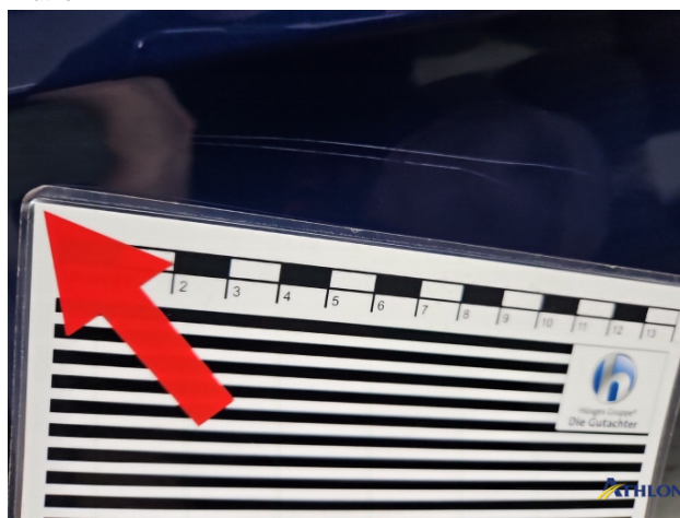
5. Tür Hinten - Links Kratzer