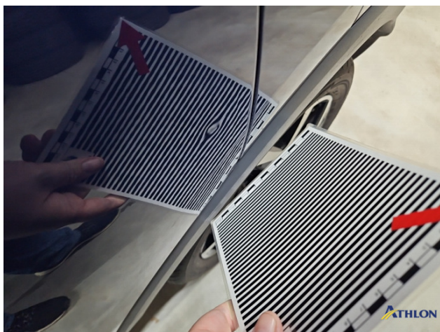
3. Tür Hinten - Links 1 Delle