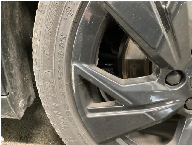
Felge (Ganzjahres-Radsatz) - Vorderachse rechts - Kratzer - smart Repair