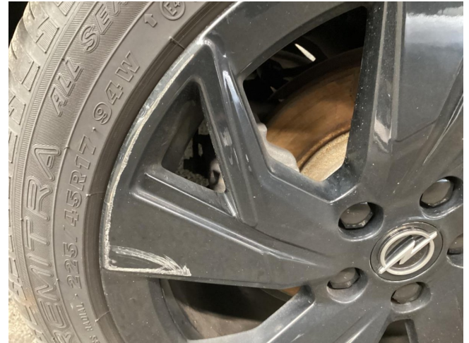
Felge (Ganzjahres-Radsatz) - Hinterachse rechts - Kratzer - smart Repair