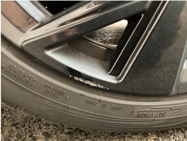
Felge (Ganzjahres-Radsatz) - Vorderachse links - Kratzer - smart Repair

Anzahl Halter lt. Zulbesch. II: keine Angabe