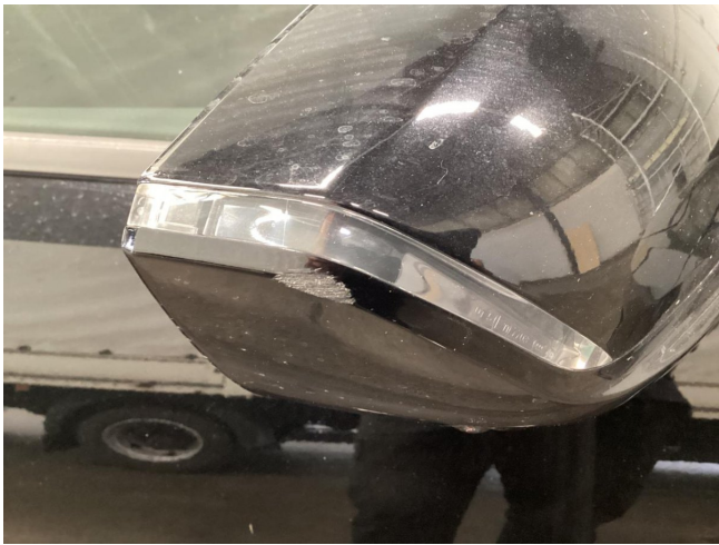
Außenspiegelgehäuse rechts - Spiegelkappe zerkratzt - lackieren