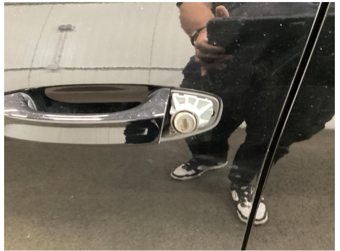
Türgriffkappe VL fehlt - erneuern