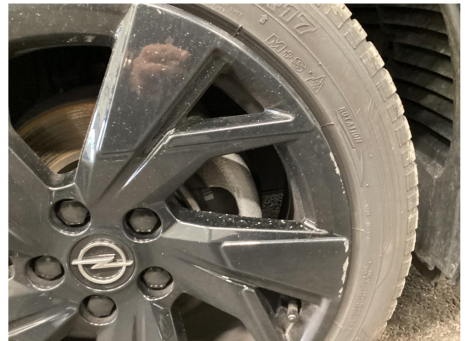
Felge (Ganzjahres-Radsatz) - Hinterachse links - Kratzer - smart Repair