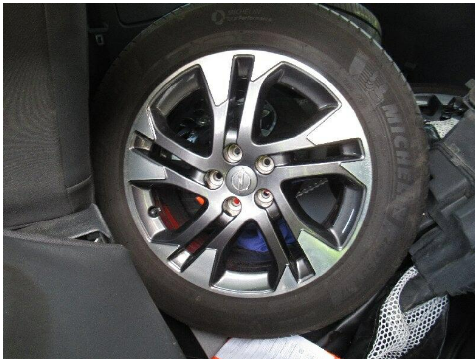
Seite 8 von 15