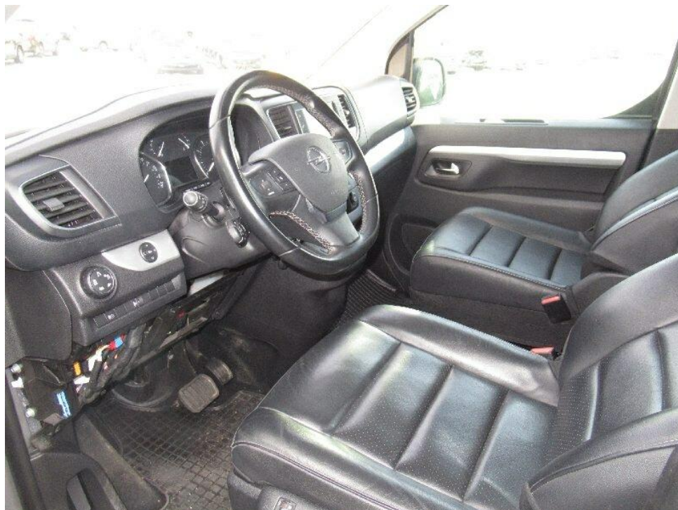
Bild 8 : Durch geöffnete Fahrertüre: Fahrersitz, Armaturenbrett und Schalthebel