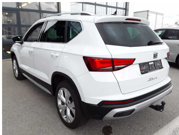
Abbildung 4: Schräg hinten