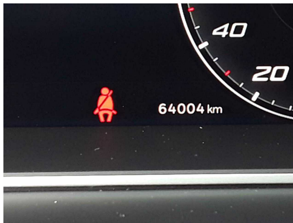
Abbildung 10: Kombiinstrument