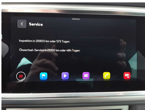
Abbildung 15: Sonstiges