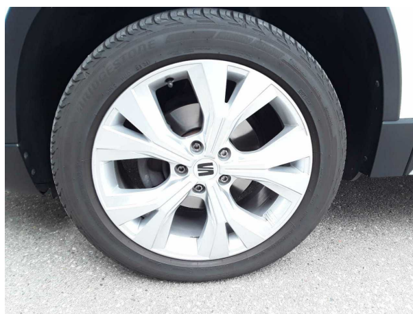
Abbildung 6: Montierte Bereifung