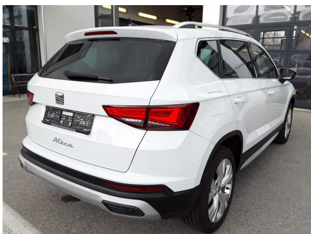
Abbildung 5: Schräg hinten