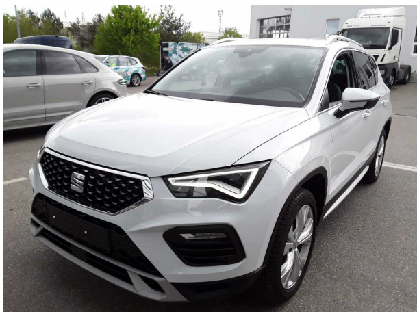
Abbildung 3: Schräg vorne