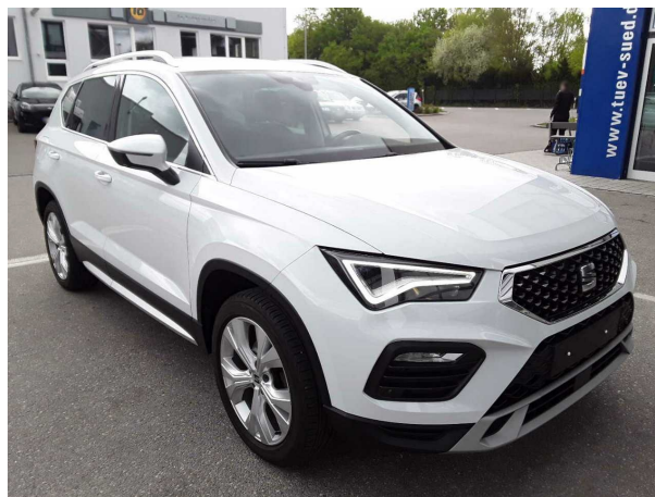
Abbildung 2: Schräg vorne