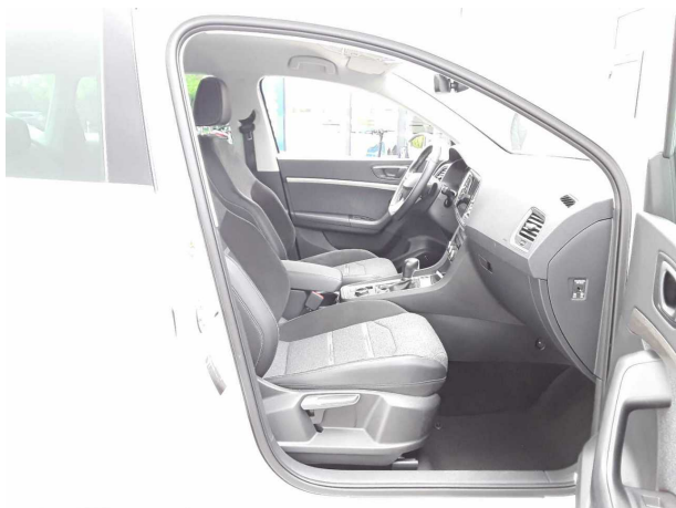
Abbildung 7: Innenraum vorne