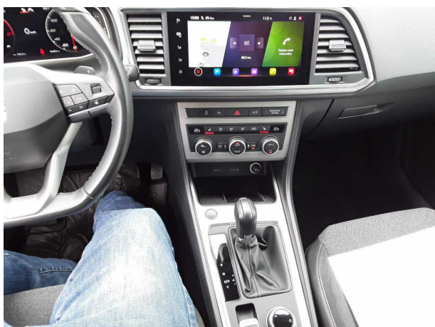
Abbildung 11: Instrumententafel