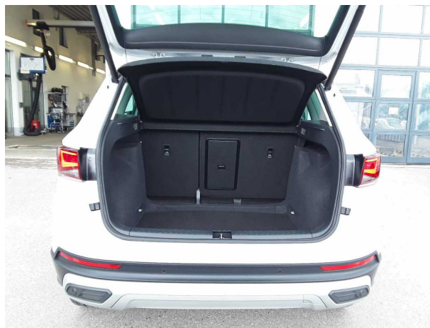
Abbildung 8: Laderaum