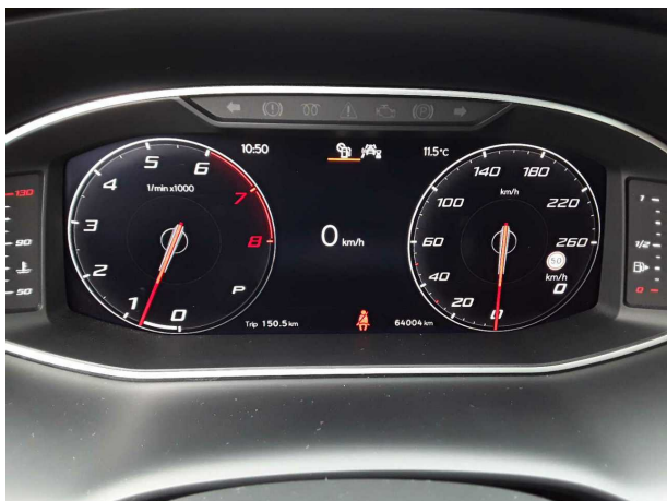
Abbildung 9: Kombiinstrument