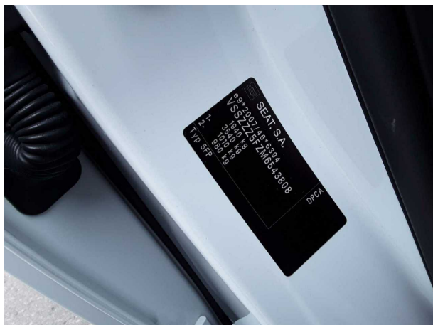
Abbildung 1: FIN