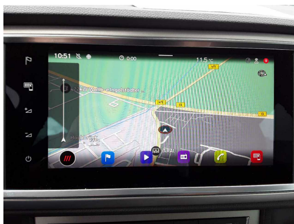
Abbildung 12: Instrumententafel