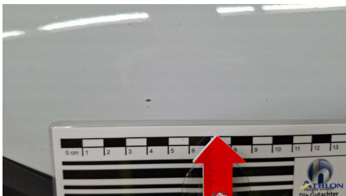
6. Motorhaube Steinschlag