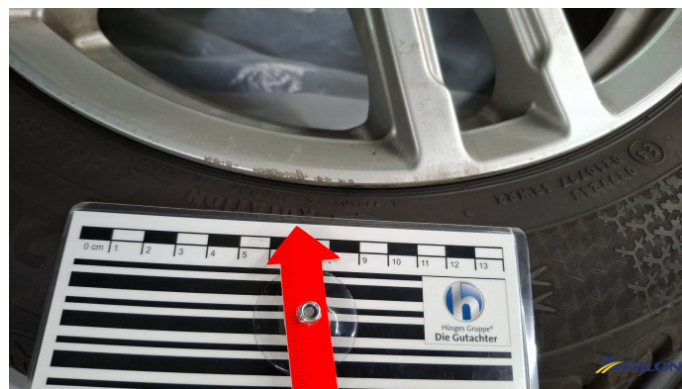
10. Winterfelge VR Kratzer