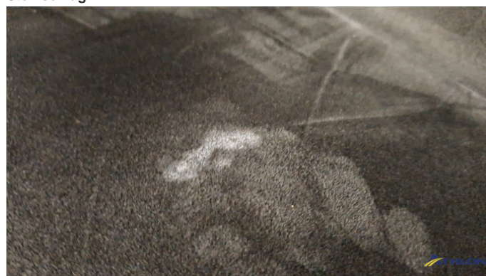
8. Fahrersitz Verschmutzt (mittel)