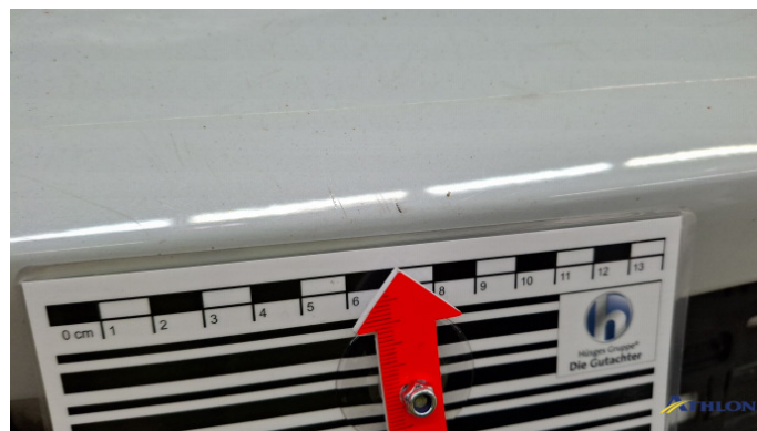
1. Stoßfänger Hinten Kratzer