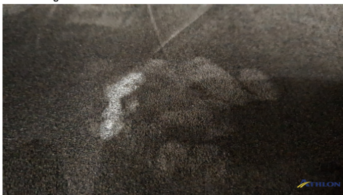
8. Fahrersitz Verschmutzt (mittel)