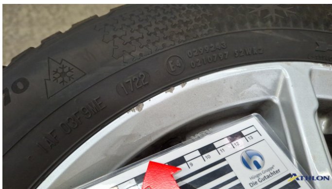
9. Winterfelge HR Kratzer