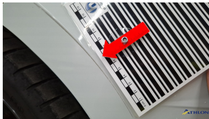
5. Stoßfänger Vorne Kratzer