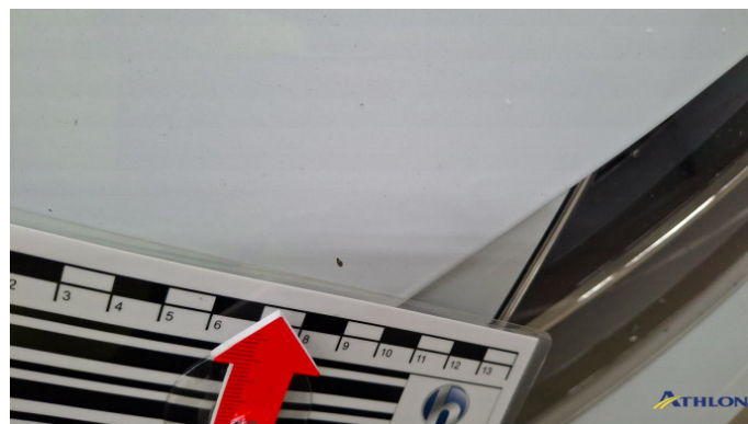
6. Motorhaube Steinschlag