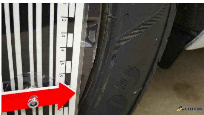
2. Felge Hinten - Rechts Kratzer