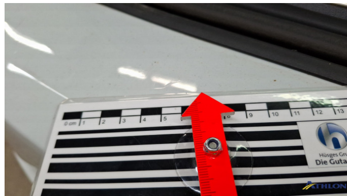
1. Stoßfänger Hinten Kratzer