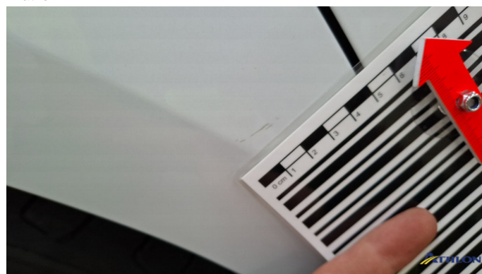
3. Seitenwand - Hinten - Rechts Kratzer