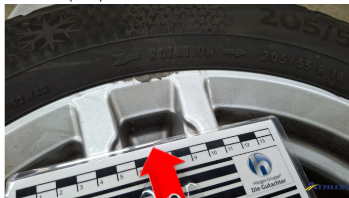
9. Winterfelge HR Kratzer