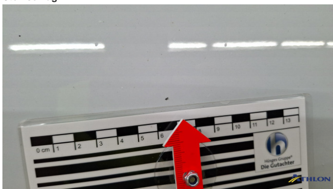
6. Motorhaube Steinschlag