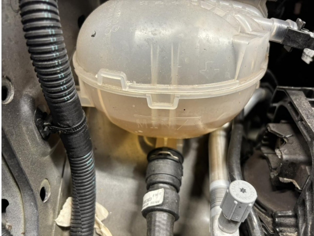
Kühlerfrostschutz unter Min - Prüfen

Anzahl Halter lt. Zulbesch. II: keine Angabe