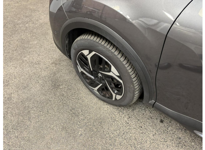
Felge VL - Minderwert