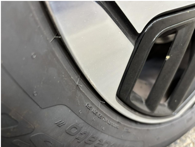
Felge VL - Minderwert