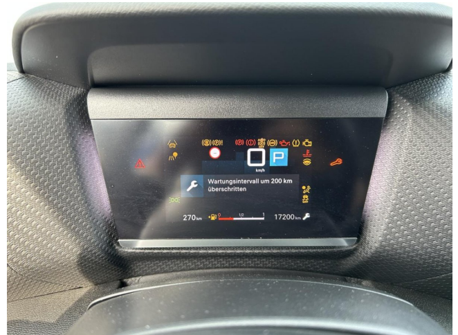
Inspektion - Jahresinspektion fällig - durchführen