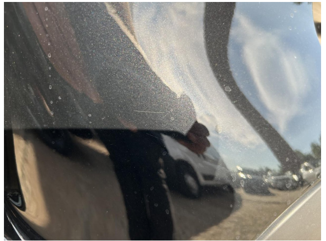
Stoßfänger hinten - Kratzer - polieren