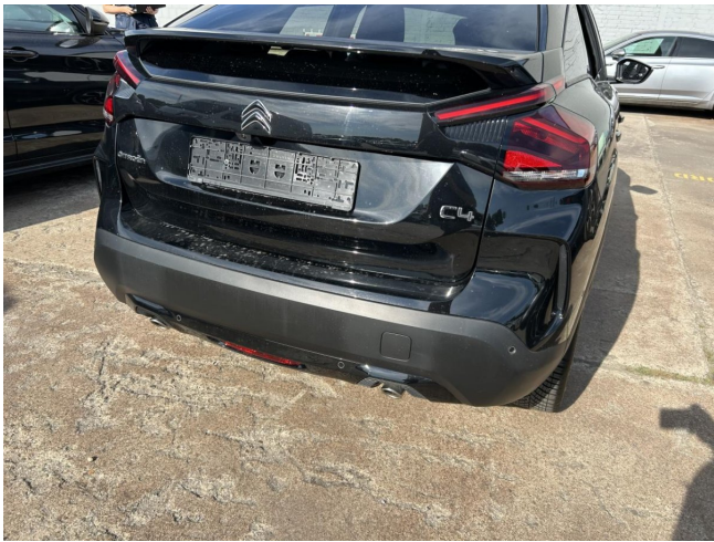
Stoßfänger hinten - Kratzer - polieren