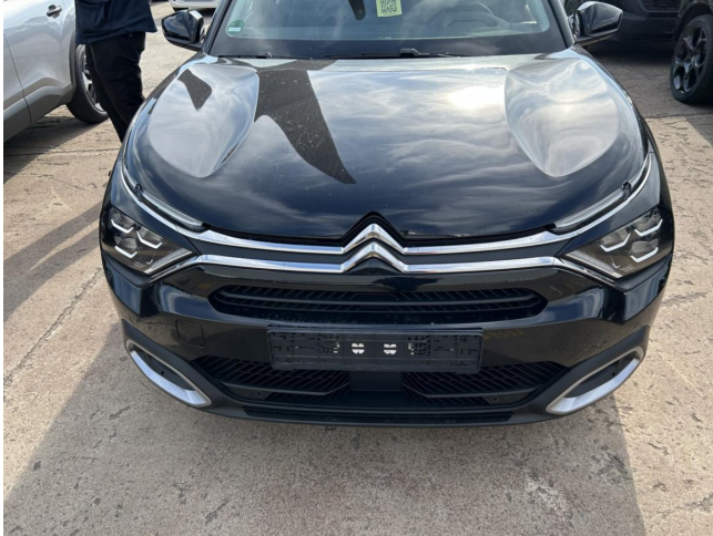
Frontbereich - leichter Steinschlag - kein Abzug

Anzahl Halter lt. Zulbesch. II: keine Angabe