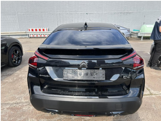
Heckbereich - leichte Kratzer - kein Abzug