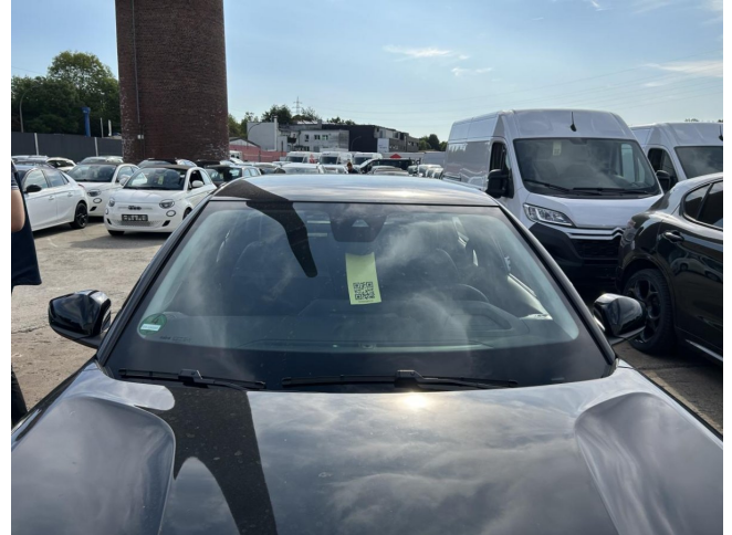
Frontbereich - leichter Steinschlag - kein Abzug