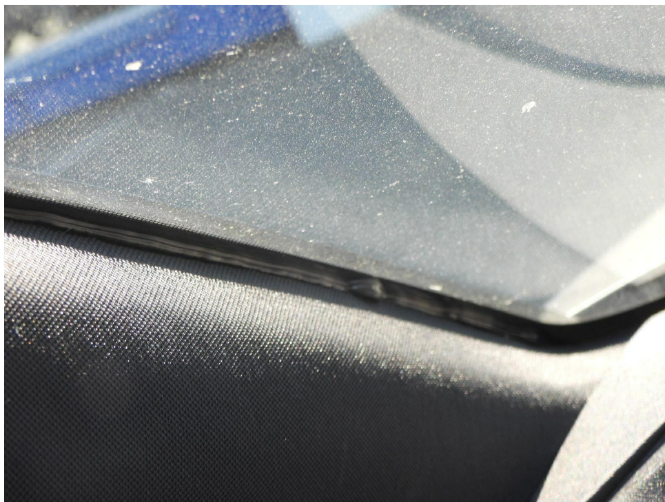
Bild 9 : Frontscheibe weist Mängel in der Montage auf (sichtbarer 1K-Klebstoff) (aus/einbauen)