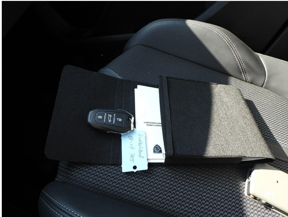
Bild 5 : Schlüssel, Servicenachweis / Serviceheft (letzter Eintrag)