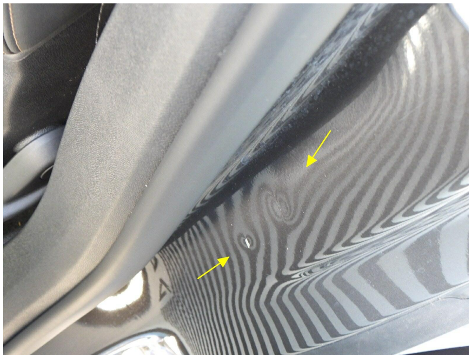
Bild 8 : Einstieg hinten links, mehrfach eingedellt und zerkratzt