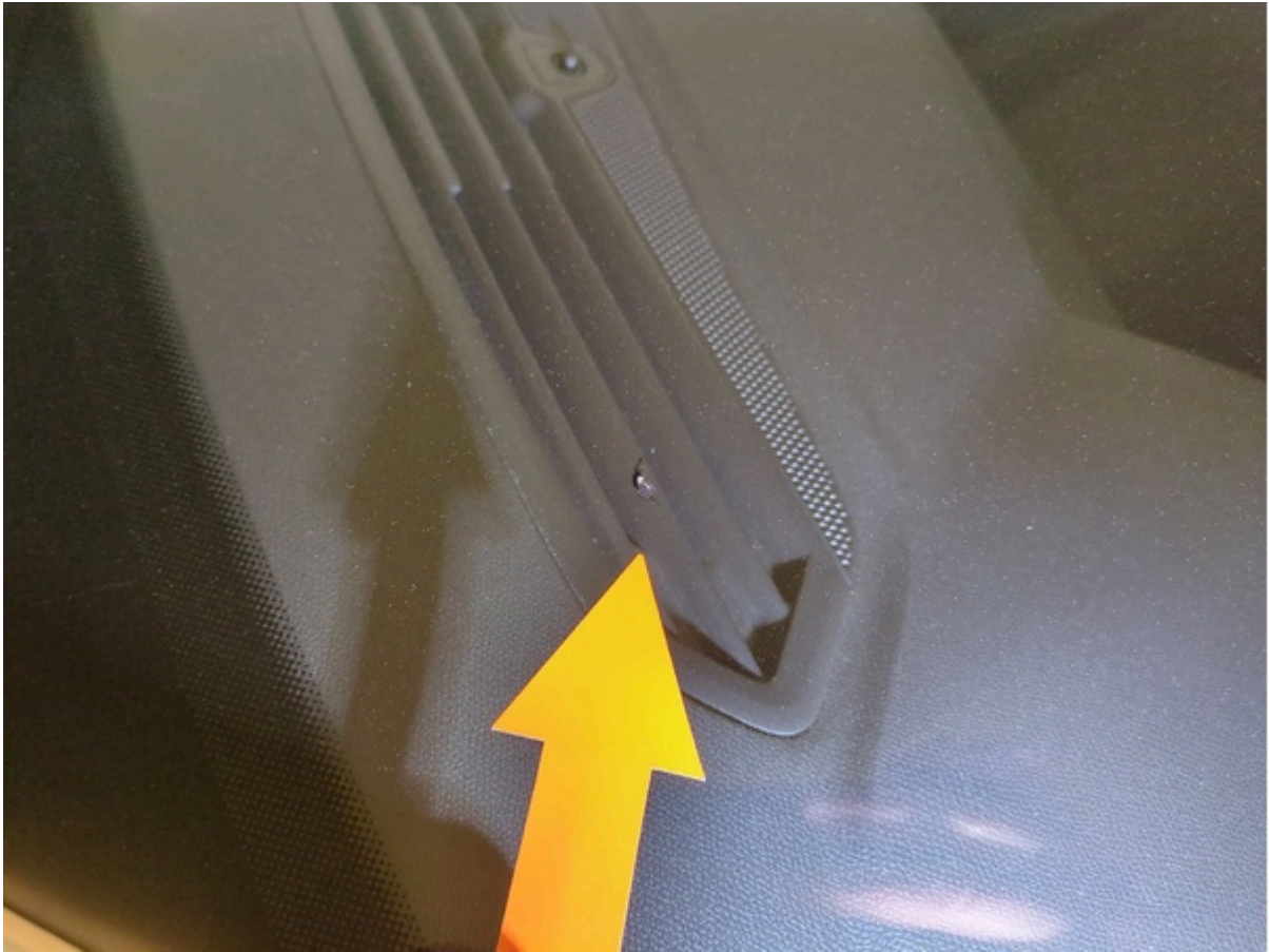
Glas Vindruta Stenskott 300 kr