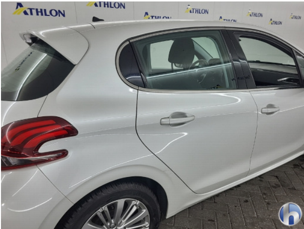
1. diverse Gebruikssporen - Aanvaardbaar