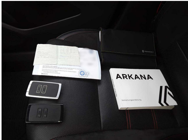
Abbildung 13: Dokumente