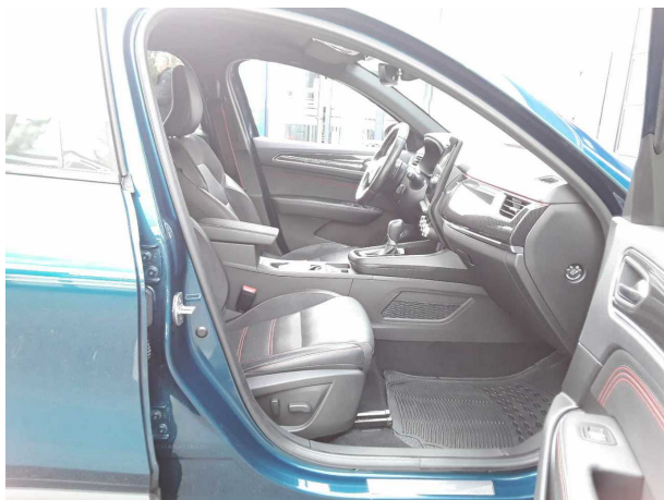
Abbildung 7: Innenraum vorne