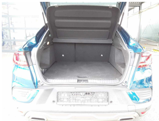
Abbildung 8: Laderaum