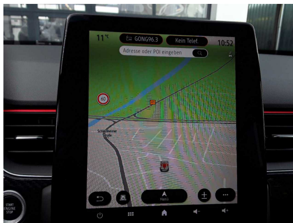
Abbildung 12: Instrumententafel