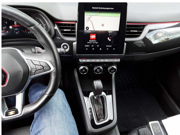
Abbildung 11: Instrumententafel