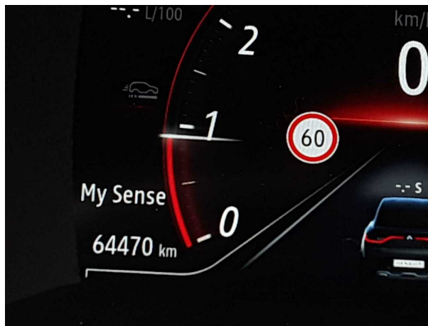
Abbildung 10: Kombiinstrument