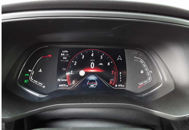
Abbildung 9: Kombiinstrument