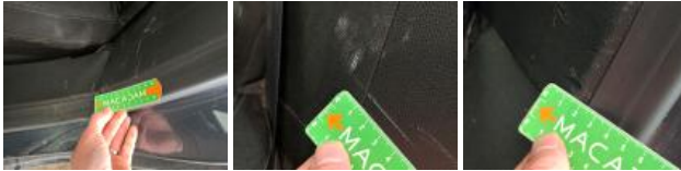
Bas de caisse int ARD, Bosse(s) et griffe(s), PDR - Débosselage ss peinture