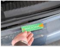
Garnit couvercle AR, Dégrafé, Dépose/Repose