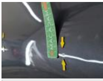
Aile ARD, Bosse(s) et griffe(s), PDR - Débosselage ss peinture