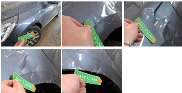
Bas de caisse ext G, Bosse(s) et griffe(s), LI - Réparer et peindre (complet)