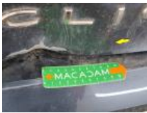
Pare-chocs AR, Déformé / Forcé, Le - Remplacer et peindre