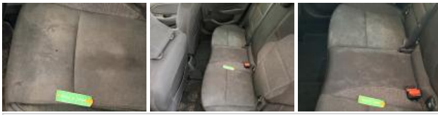
Revêtement assise siège AVG, Brûlé, Smart repair